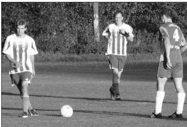
Třebské áčko si doma poradilo s Loděnicemi.