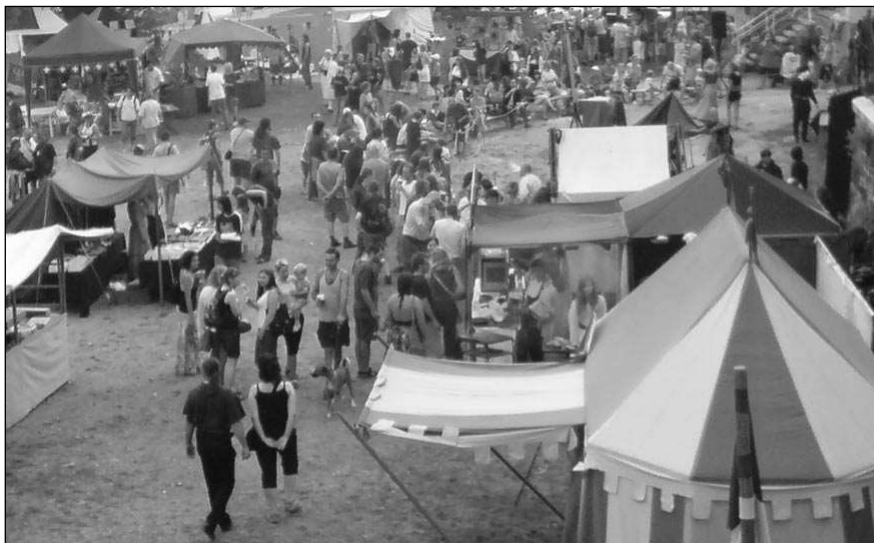
Černošická Alotria přilákala do Dobřichovic množství diváků.