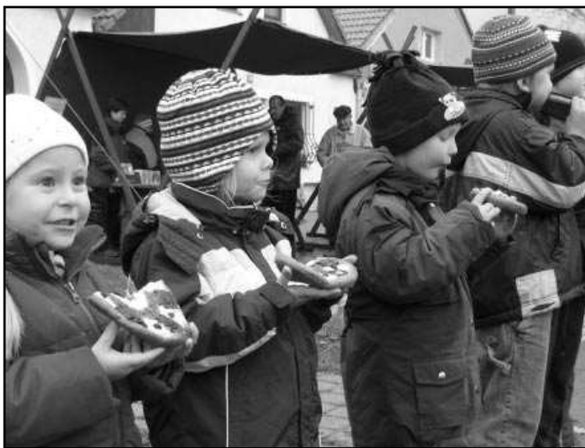
Jednou z obcí poberounského kraje, kde se slaví posvícení, jsou Lety. Koláčovou koledu nahradila soutěž v pojídání koláčů.

Zůstaly nám zachovány i jiné posvícenské zvyky. Na návsi před hospo-