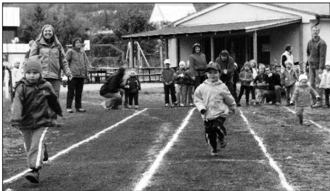
MALÍ ZÁVODNÍCI. Atletického trojboje v Dobřichovicích se zúčastnili především nejmenší závodníci.

Cvičení bylo zahájeno slavnostním nástupem, sokolským pozdravem a vyvěšením vlajky. Po rozsvícení začaly děti soutěžit. Vyhlášení vítězů se konalo za přítomnosti cvičitelů a rodičů, kteří pomohli zajistit bezvadný průběh soutěže. Zaslouží si za to veliký dík!