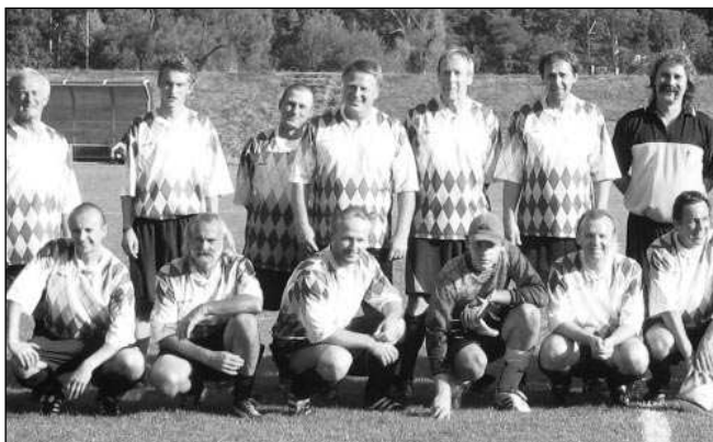
»STARÍ PÁNOVÉ«. Pětasedmdesáté výročí založení oslavil fotbalový klub FK Lety. V rámci oslav se utkala letovská stará garda (na snímku) s německým týmem Rot-Weiss Ailertchen.