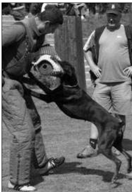
Na letovském »cvičáku« byly k vidění zajímavé výkony.

Další zkoušky se konají v neděli 9. listopadu, závod pořádáme 28. října. Pokud někoho z vás zají-