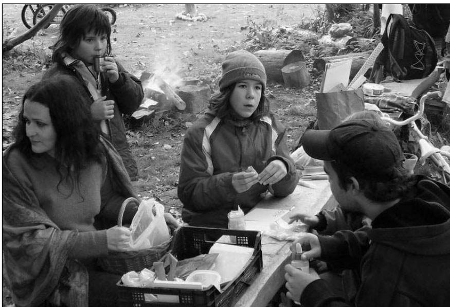
Malí i velcí na »dýňovém odpolední« v Zadní Třebani tvořili a ochutnávali netradiční dobroty.