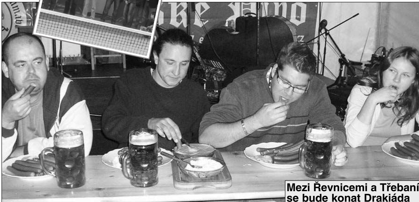
OKTOBERFEST. Pivní Oktoberfest se konal první říjnovou sobotou v Mokropsech. Součástí akce, na níž vystoupilo několik kapel, byly také soutěže v pití piva a pojídání párků.