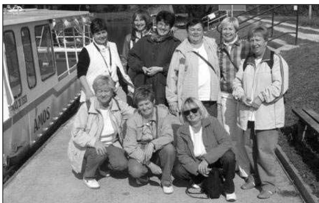
Holky v rozpuku u Baťova kanálu.

Plno známých tváří je tu, mnohé se hned smějí, pěkný pobyt, vydařený, upřímně všem přeji.