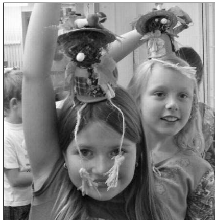
Barevné panáčky »podzimníčky« vyráběly v poberounském Domě dětí a mládeže děti ze zadnotřebeňské málotřídky. (Viz strana 2)