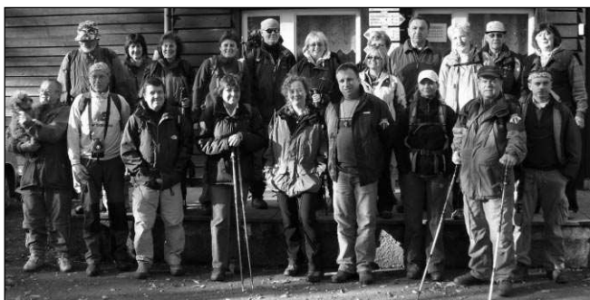
Přes dvě desítky turistů ze Zadní Třebaně a okolí podnikly na konci října tradiční putování podzimní Šumavou. (Viz str. 2)