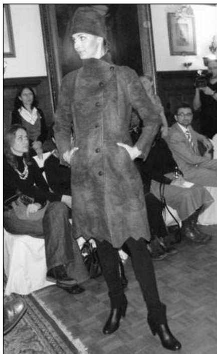
Jeden z modelů Blanky Hovorkové-Maříkové na módní přehlídce v Bruselu.

Přehlídku jsem původně nazvala Bude zima, bude