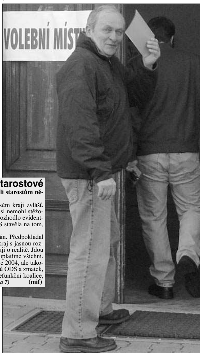
Jeden z řevnických voličů jde odevzdat svůj hlas.