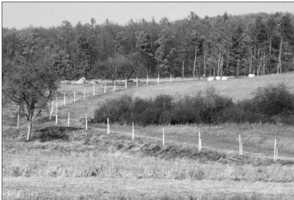
V areálu budoucího Geoparku byly vysazeny nové stromy.