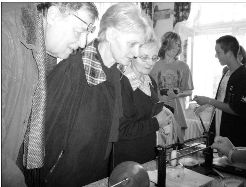
Při dnu otevřených dveří v liteňské škole bylo pro návštěvníky připraveno mnoho ukázek, včetně pokusů.

LITEŇSKOU ZŠ SI O DNU OTEVŘENÝCH DVEŘÍ PŘIŠLO PROHLÉDNOUT TŘI STA NÁVŠTĚVNÍKŮ