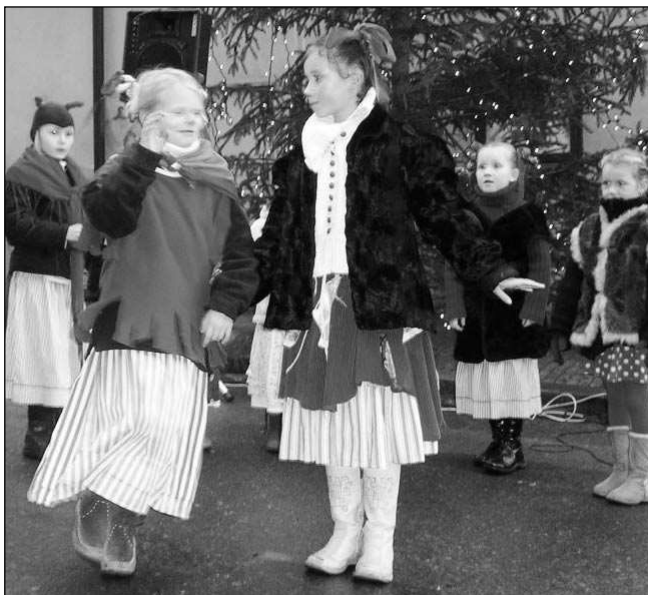
Na premiérovém Karlštejnském adventu loni zatančil řevnický soubor Klíček. Na náměstí pod hradem se představí i letos.

Adventní oslavy se pak budou odbývat každou další nedělí. Diváky potěší například dětské folklorní soubory Klíček a Kamýček, pěvecké sbory Chorus Angelus a Bonbon, divadelní soubory Excelsior a Křoví, dechovka Týnečanka či děti ze školy v Litni a z Dětského domova v Letech. Vše vyvrcholí v neděli 21. prosince pří-