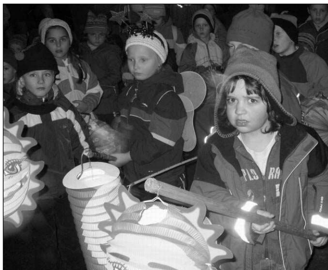
V PRŮVODU. Sedm desítek dětí s lucernami a lampióny prošlo první listopadový pátek Zadní Třebaní.