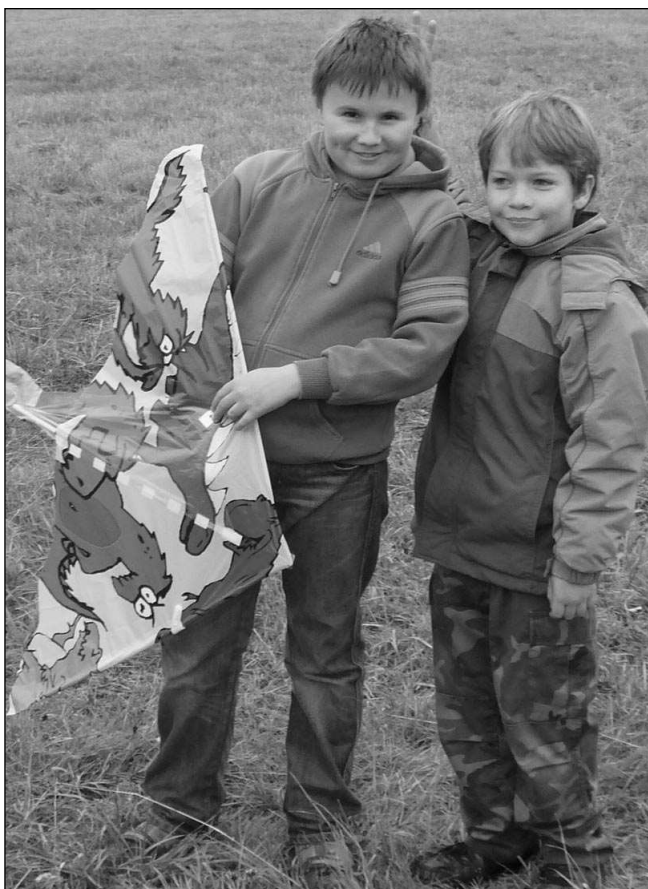
Dva z několika desítek účastníků Drakiády, která se konala na kopci Vrážka mezi Řevnicemi a Zadní Třebaní.

větrí. „Dneska to létat nebude,“ tvrdila první přichozí maminka z Řevnic. Přesto se louka na Vrážce postupně zaplnila, a také první draci se vznášeli do vzduchu. To už konečně začalo trochu foukat, takže se během další hodiny vystřídalo ve vzduchu kolem padesáti draků. Nejlépe litaly lehké igelitové exempláře. Cenu za originalitu vyhrál doma vyrobený, va metry velký trojrozměrný drak. „Dělal jsem ho z latěk a igelitové fólie. Už jsem odmotal určitě 200 metrů provazu,“ říkal jeho majitel chvíli předtím, než se mu parádní výtvar utřhl a uletěl neznámo kam. I ostatní draci vypadali na nebi krásně, byli tu draví ptáci, chobotnice, šašek i různá trójuhelníková a čtvercová vznášedla. Za výšku jejich letu a výdrž ve vzduchu si na konci odneslo drobné ceny hned několik dětí. Drakiádu si užily nejen ony, ale i mnozí tatínkové, kteří vydrželi pouštět draky skoro dvě hodiny. Někteří rodiče měli s sebou nápoje na zahřátí, pár z nich si na kopec přineslo dokonce láhev šampaňského a skleničky.