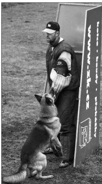
Kynologický závod se konal o státním svátku 28. října v Letech.

klubovně bylo neustále »natřískáno«, a to nejen závodníky, ale také početnými diváky. Když dokončil poslední závodník obranu, bylo na hodinách přesně 16.00. Spočítání výsledků a vypsání diplomů trvalo sice jen chvíli, protože v kanceláři v průběhu dne postupně výsledky zpracovávali, takže měli hodně věcí hotových, nicméně se rychle šefilo. Všichni byli unaveni, vymrzli