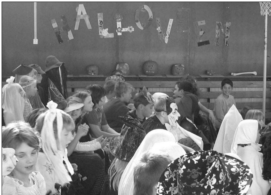
V osovské škole slavili Halloween - den strašidel a duchů.