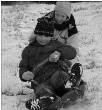
NAPADL, HURÁ! První sníh potěšil zejména děti. Ty zadnořebské se uplynulou nedělí hned pokoušely bobovat.