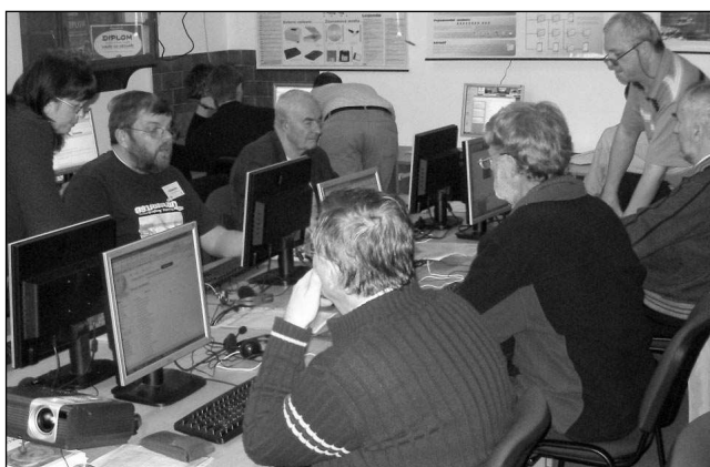
Esperantisté v Dobřichovicích.