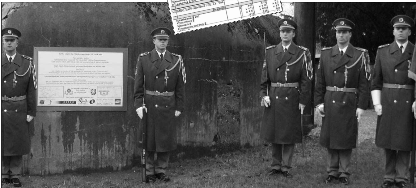
PAMÁTNÍK 1938 - 2008. Slavnostní odhalení pamětní desky na památku 70. výročí mobilizace v roce 1938 se konalo 21. listopadu v Karlštejně. Akce, kterou pořádal Svaz důstojníků a praporčíků Armády ČR ve spolupráci s městem Karlštejn, byla součástí oslav 17. listopadu. S odhalením památníku byl v Karlštejně také otevřen lehký objekt obranné linie Prahy.