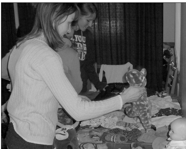
Zájemci si vybírají zboží na treboňském bazárku.

V předchozích letech výtěžek dvakrát pomohl ješkům ze záchranné stanice ve Všeradicích, nyní peníze poputují do Hlásné Třeboň. Broučci alespoň malou částkou přispějí na nákup speciálních vzdělávacích pomůcek pro sedmiletého handicapovaného Jonáše.