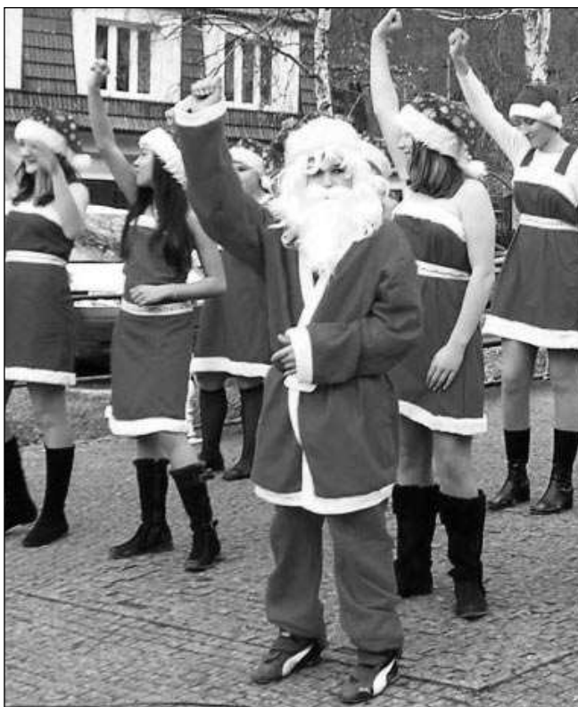
Na loňském Karlštejnském adventu vystoupily také děti z liteňské školy. Svůj program pod hradem předvedou i letos - 7. prosince.

Přímo na Štědrý den zazní Rybova Missa solennis Hej mistře, vstaň bystře v karlířském kostele. Od 23.00 ji uvede soubor Ludus musicus. (pš)