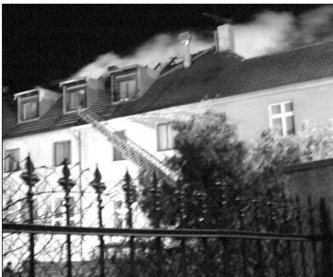
ZAČALO TO OHNĚM. Požár Lidového domu odstartoval vzrušenou debatu o sportování v Řevnicích.

Zastupitelstvo města Řevnice by nemělo důvod se činnosti Řevnické sportovní s.r.o. vůbec zabývat, kdyby neprojevila zájem koupit pozemek pod částí areálu LTC Řevnice. Vlastnictvím tohoto pozemku by mohla zcela ovládat činnost LTC -