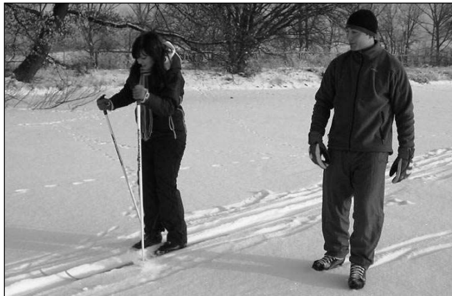
NA LYŽÍCH I NA BRUSLÍCH. Na rybníku v Leči se uplynulý víkend bruslilo i lyžovalo.