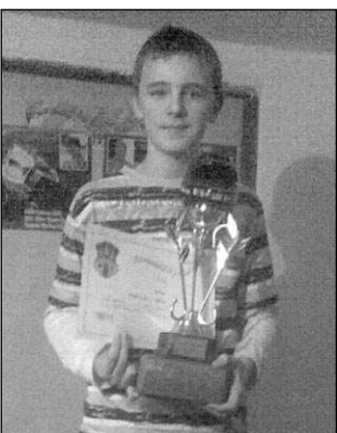
Vítěz Silvestrovského závodu M. Motyčka.

Třetí ročník Silvestrovského závodu modelů aut na autodráze se jel 27. prosince v Litni. Zúčastnilo se jej třináct závodníků.