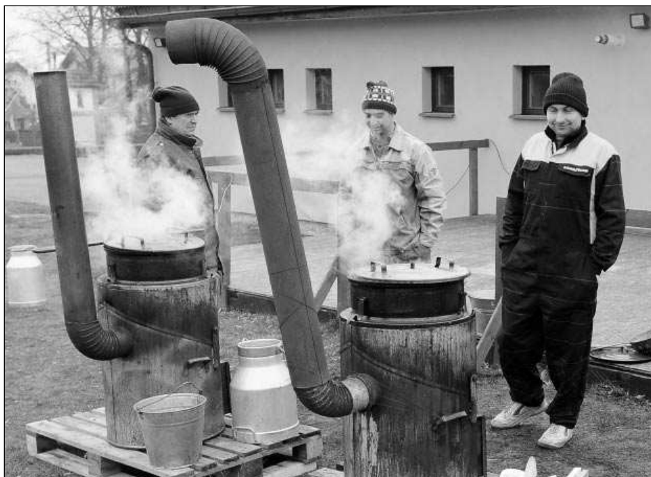
U KOTLŮ. Na konci roku se v Podbrdech konala veřejná zabíjačka.