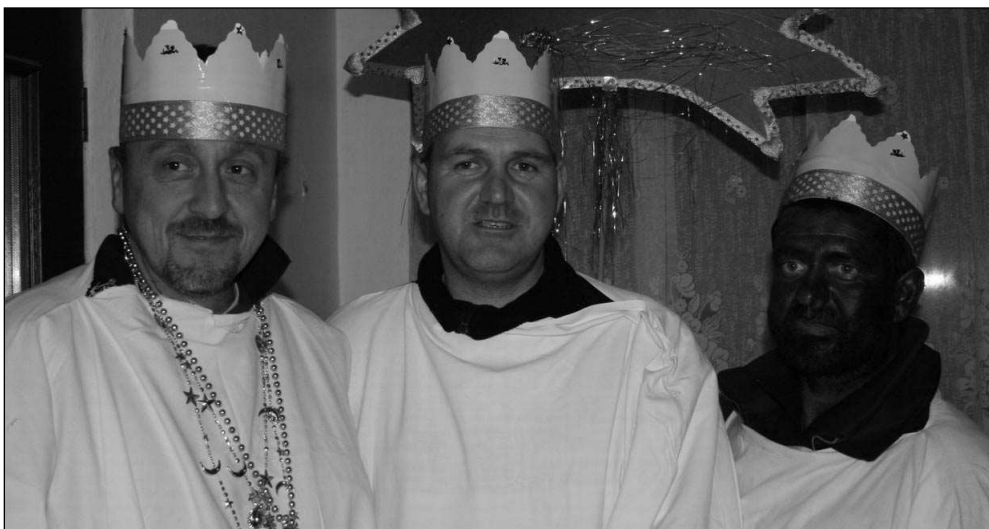
TŘI KRÁLOVÉ. Svinařští Tři králové, kteří letos chodili koledovat po vsi.