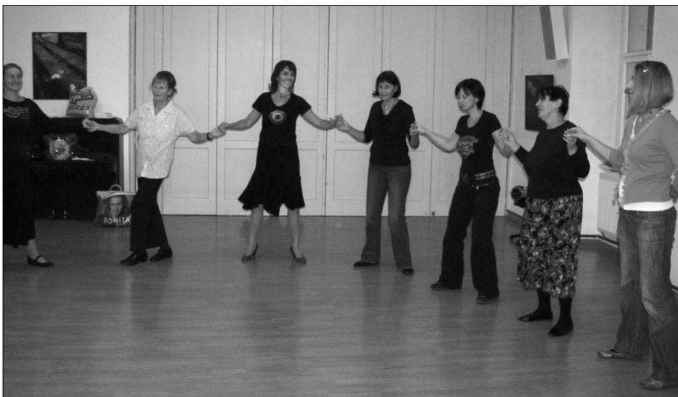
V KOLE. Záběry z kursu řeckých tanců v dobříchovickém Fürstově sále.

V podstatě si o ně řekli sami lidé, na našich řeckých večerech. Předtancovaly tam dvě řecké dívky a lidi za námi začali chodit s tím, že by se to někde chtěli řádně naučit a ne jen chytat kroky na místě. Tak jsme se do toho daly a vymyslely systém, co a jak se bude učit. Dlouho to byl jen kurs základních osmi tanců, ale někteří lidé si jej opakovali třeba i třikrát za sebou. Takže nastal čas na druhý stupeň a dnes už je výuka třístupňová. Čtvrtá skupina jsou naše stalice, ti s námi dokonce jezdí na některá