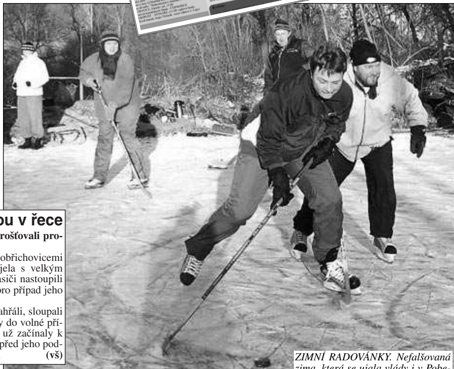
ZIMNÍ RADOVÁNKY. Nefalšovaná zima, která se ujala vlády i v Pobeřouní a na Podbrdsku, dělá radost hlavně vyznavačům zimních sportů. Bruslí se na Berounce i na většině rybníků po okolí. Na snímku jsou zachyceny hokejové boje ve Svinařích.