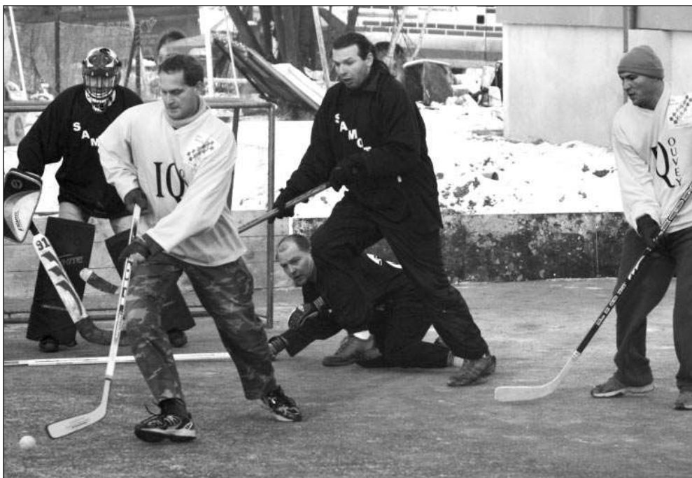
UŽ SE HRAJE. Další ročník Bandy cupu rozehráli uplynulou sobotou řevničtí pozemní hokejisté.

Mrazivé počasí hráčům vyhovuje. „Je to lepší, než když je mokrý a cáká to,“ dodal. Pavla ŠVĚDOVÁ