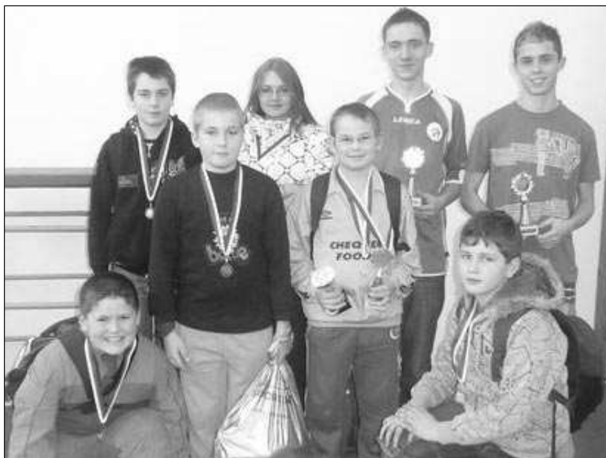
Liteňští hráči stolního hokeje.