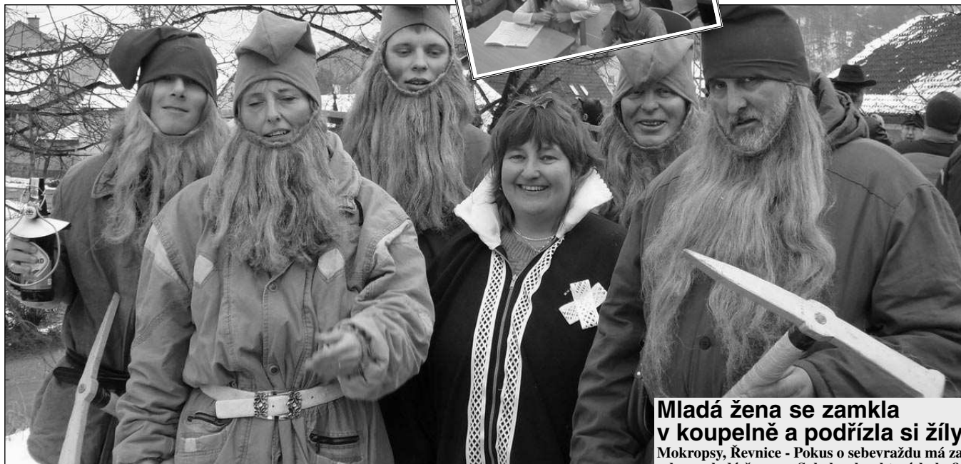
SNĚHURKA A TRPASLÍCI. Jednou z nejvydařenějších maškar na letošním XX. poberounském masopustu v Zadní Třebani byla Sněhurka s trpaslíky. (Viz strana 3)