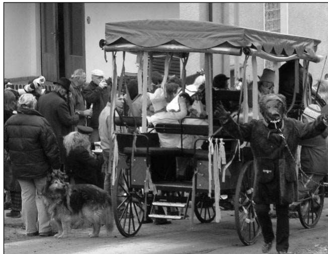
Na masopustu v Srbsku bylo veselo.