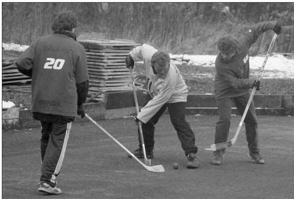
O TÝM MĚNĚ. Z řevnického Bandy cupu odstoupil celek Pivo Boys. Ostatní mužstva ovšem bojují dál s nemenším nasazením.