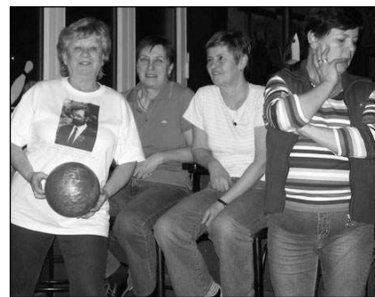
NA BOWLINGU. Hlásnotřebské »holky« ve všensorském bowling centru.

Hlásnotřebské Holky v rozpuku žijí nejen kulturně ale i sportovně. Společně jsme navštívily bowling centrum ve Všensorech, zamluvily dvě dráhy, utvořily dvě družstva a soutěžily o sto šest. Na to, že jsme si podobný sport vyzkoušely poprvé, byly naše výsledky ohromující. Podaly jsme strhující výkon, každý chtěl vyhrát. U bowlingových drah panovala tak bezvadná atmosféra, že jsme se rozhodly v tomto klání pokračovat alespoň jedenkrát měsíčně.