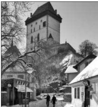
SEZONA ZAČÍNÁ. Poslední únorový víkend otevře po zimní přestávce své brány hrad Karlštejn. (Viz strana 6)