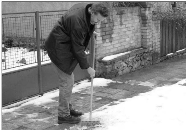
O uklid sněhu před domy se teď budou starat obce.