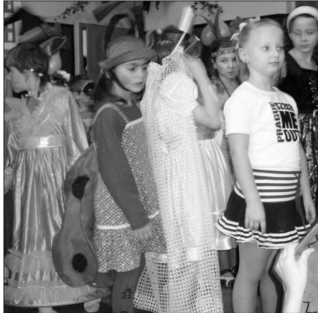
REJ MASEK. Caparti se na dětském karnevale taneční skupiny Proměny jaksepatri vyřádili.

Lidového domu ve švech. Desítky dětí v maskách soutěžily a tančily, některé z nich vyhrály dorty za nejlepší masky. Malí i velcí se opravdu vyřádili. Lucie PALÍČKOVÁ