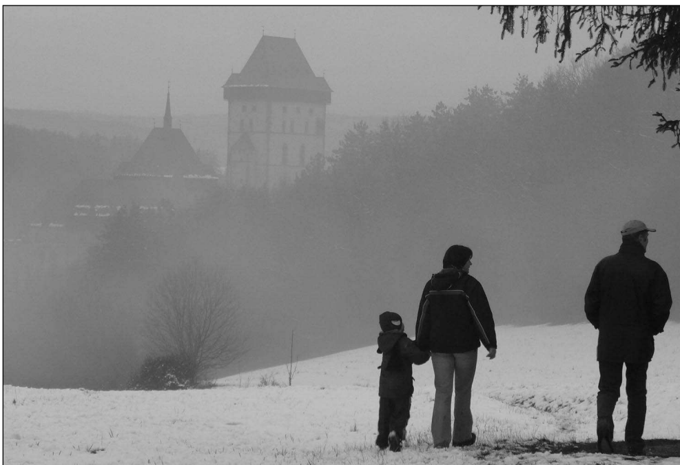
Hrad Karlštejn první návštěvníky po zimě přivítá poslední únorový víkend.

Hrad Křivoklát je poprvé otevřen celoročně – od ledna do března od pondělí do pátku pro předem ohlášené skupiny nad deset osob. Letos tam čeká návštěvníky otevření nového prohlídkového okruhu nazvaného Cesta královskou historií. „Provede lidi po nejvýznamnějších částech hradu včetně nikdy neotevřeného prostoru nad kaplí a jižním křídlem se starobylým točícím schodištěm.“ řekl Svoboda. Pavla ŠVĚDOVÁ