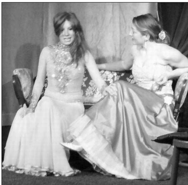
DÁMY V »PYŽAMU«. Představitelky dámských rolí v divadelní komedii Pyžamo pro šest.

* Výstava fotografií Martina Bouzka je do konce března k vidění v Místní knihovně Radotín. (mif)