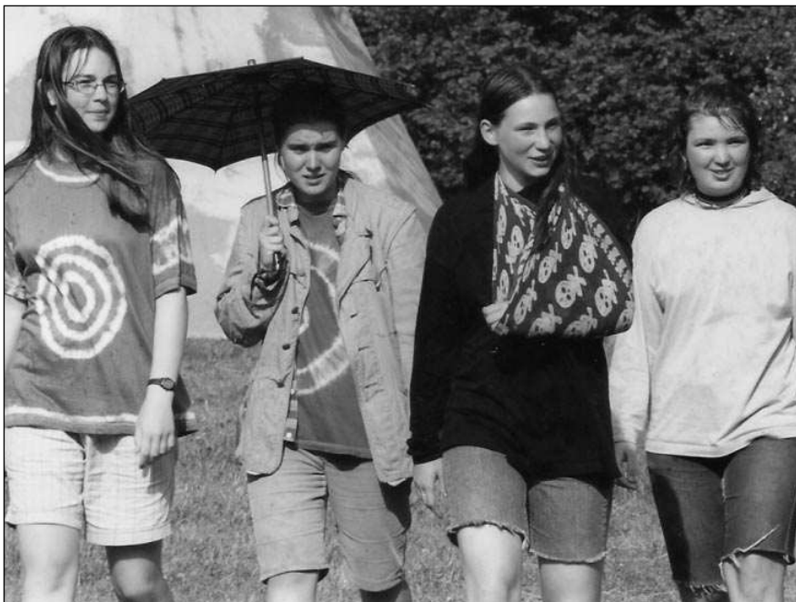
Skautky ve vlastnoručně batikovaných tričkách.

Technologii batikování nám popsala jedna ze světlušek, čili nejmenších skautek, taktov: „To se vezme látka (nebo tričko) které se postupně ovazuje provázkem všude tam, kde chceme nechat původní barvu. Nebo se udělá uzel na rukávu a může se dělat i různá skládaná batika. Tričko se potom různě barví buď koupenou barvou nebo také přírodními barvivy, které nám poskytuje sama matka příroda. Tak to prý kdysi v prérách dělali američtí indiáni.