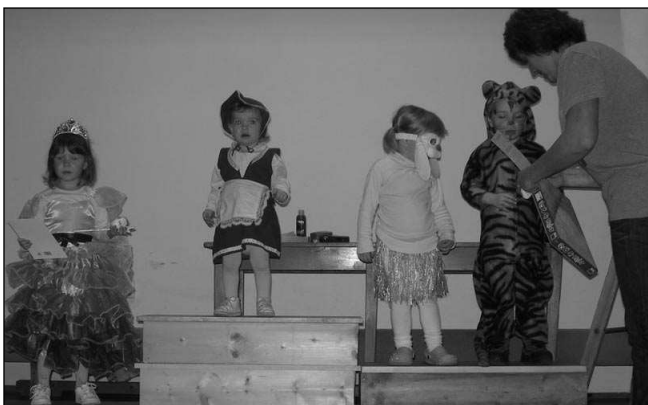
NEJHEZČÍ MASKY. Dekorování nejhezčích masek na sokolském dětském karnevalu v Hlásné Třebani.