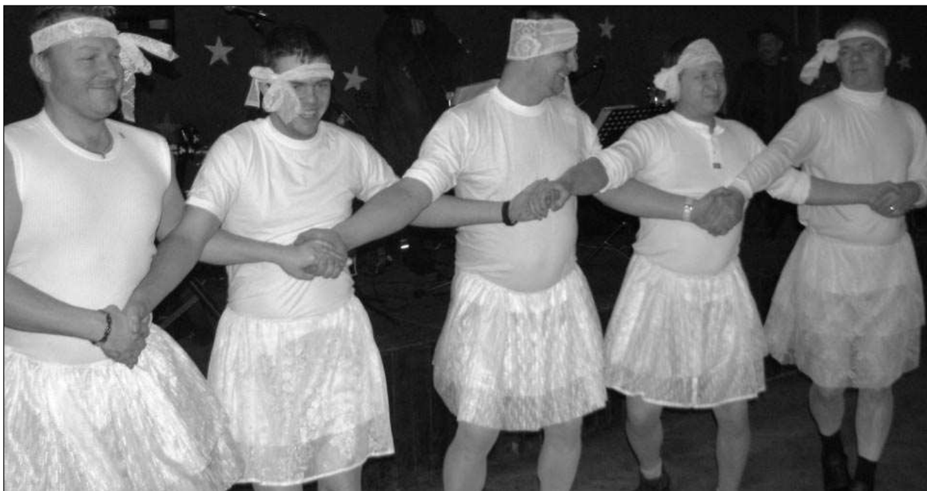
Labutí tanec předvedli Osovští chlapi na Dnu osovských žen.

Aktuální informace ze Všeradic a okolí, číslo 5/2009