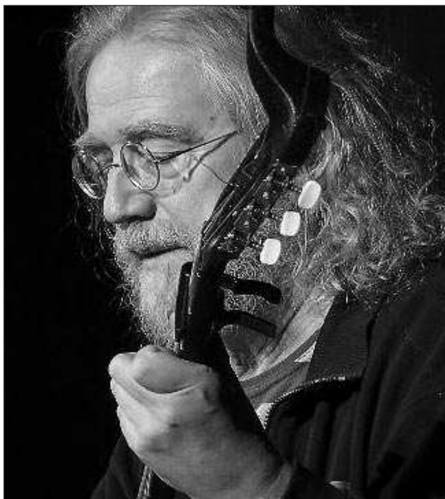
HUTKA V ČERNOŠICÍCH. Písničkářská legenda Jaroslav Hutka zahraje 27. března od 20.30 hodin v černošickém Clubu Kino.

27. 3. 17.00 a 19.30 PEKLO S PRINCEZNOU 28. 3. 17.00 a 19.30 VEŘEJNÝ NEPŘÍTEL Č. 1 29. 3. 15.00 ČERT A KÁČA 29. 3. 17.00 a 19.30 FIGLE 3. 4. 17.00 a 19.30 ZAMILOVANÁ ZVÍŘATA 4. 4. 17.00 a 19.30 JAK SE ZBAVIT PRÁTEL A ZŮSTAT ÚPLNĚ SÁM 5. 4. 15.00 PŘÍBĚHY CVRČKA ŠTEJNÁTKA 5. 4. 17.00 a 19.30 TOKIO!