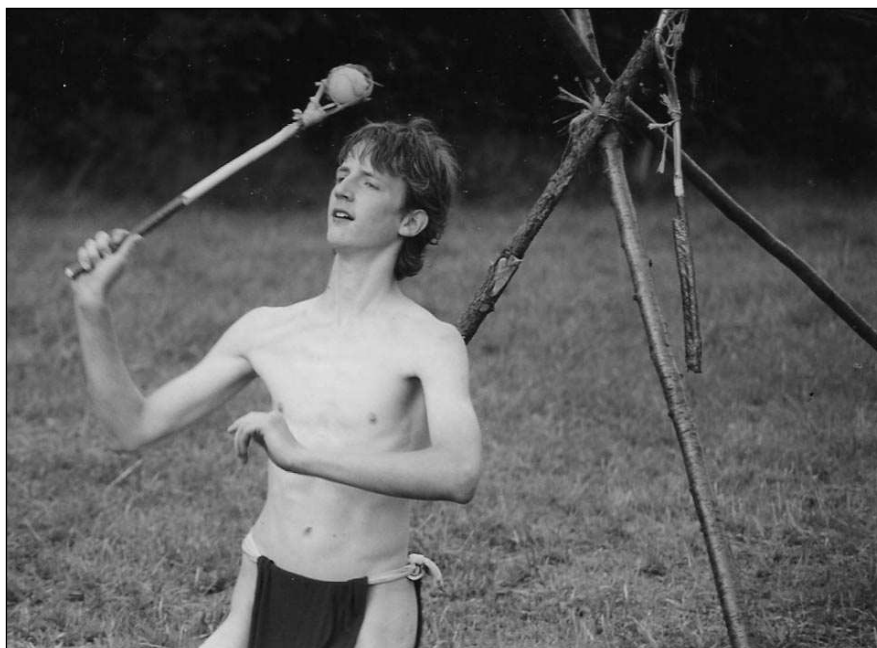
Skaut v tradičním indiánském sportovním úboru při lakrosu.

Samozřejmě, že tato hra se z Ameriky dostala i k nám a horlivými propagátory lakrosu se u nás stali skauti. Určitých změn doznala i pravidla: Na hřišti, které není přesně vymezeno ani ohraničeno, jsou 50 metrů od sebe vzdáleny brány velikosti 180x180 cm. Mezi nimi je půlící čára, která je mezníkem mezi stranami týmů. Jiná omezení hřiště nejsou. Každé soupeřící družstvo má pět hráčů a brankáře. Základním a vlastně jediným vybavením hráče je lakroska - hůl dlouhá cca 50 cm, která má na konci vypletenou hlavu připomínající kapsu. V