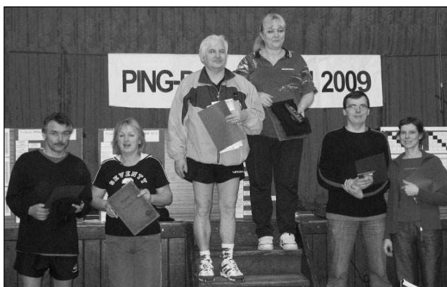
Vítězové v kategorii Smíšená čtyřhra.