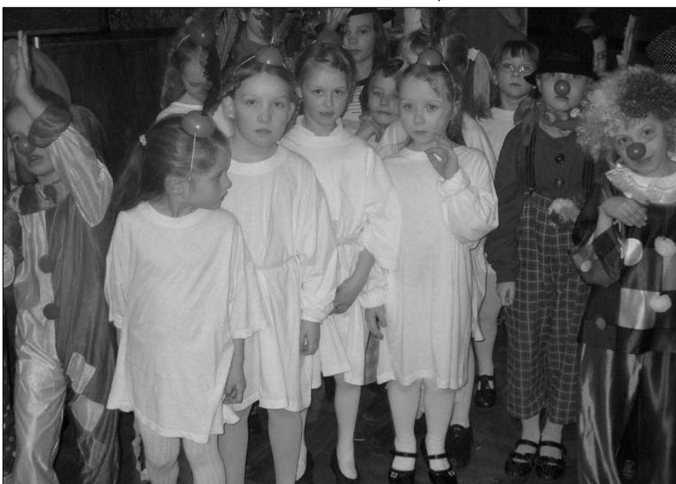
Tanečnice z Klíčku se chystají na své plesové vystoupení nazvané Cirkus.