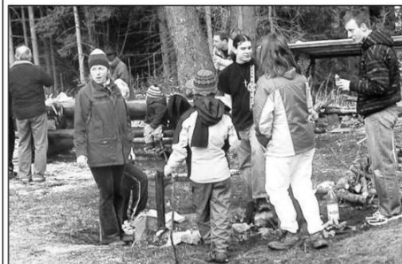
Jaro přivítaly stovky turistů 21. března na brdské rozhledně Studený vrch nad Malých Chlumcem. (Viz strana 5)