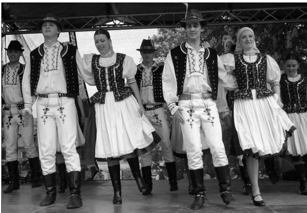
SLOVÁCI NA MÁJÍCH. Ani letos na Staročeských májích nebudou chybět Slováci. Zatímco loni se v Mníšku představili Šarvanci (na snímku), letos v Letech a ve Všeradicích vystoupí soubor Jánošíček.

Poberounský folklorní festival Staročeské máje patří spolu s Tuchlo-