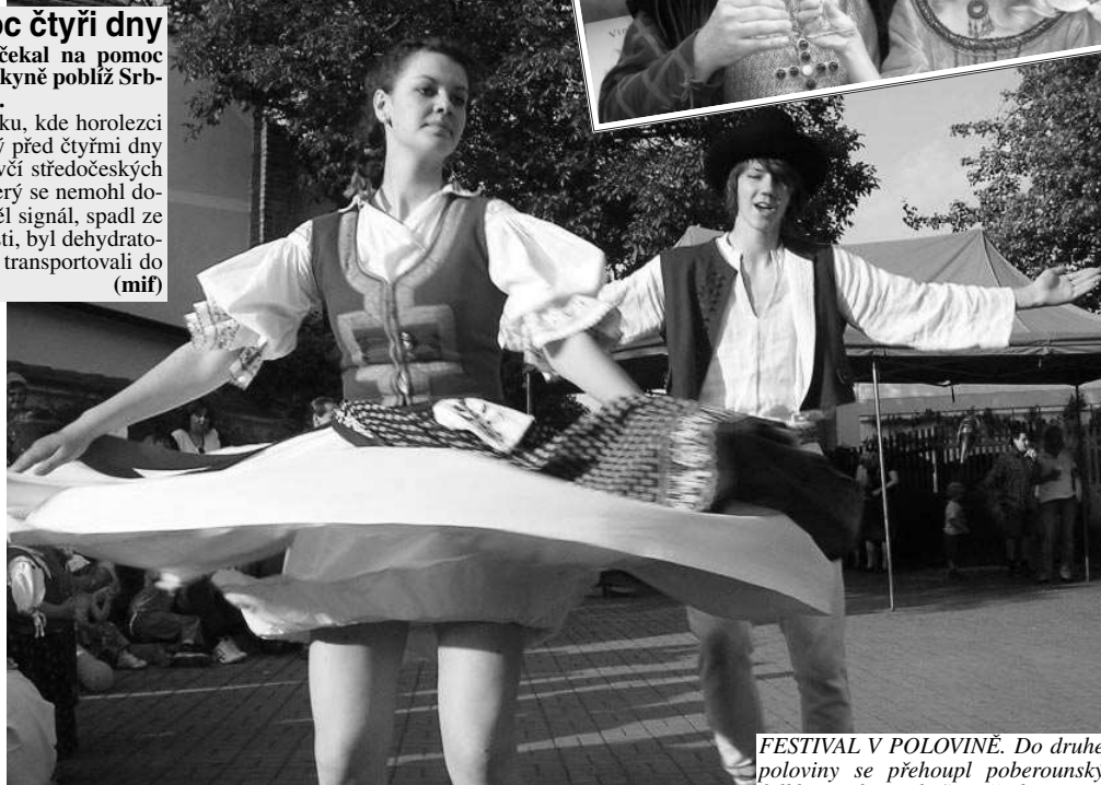
FESTIVAL V POLOVINĚ. Do druhé poloviny se přehoupal poberouňský folklorní festival Staročeské máje. (Viz strana 2)