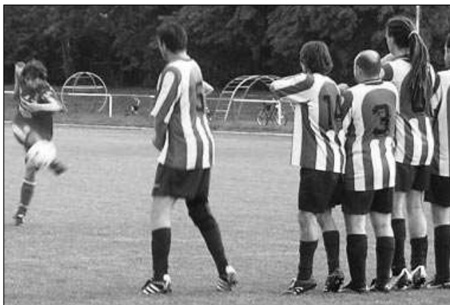
BODY ZŮSTALY DOMA. O svém vítězství 2:1 nad Kazínem rozhodl B-tým Řevnic až v samotném závěru utkání.

Domáci rozhodli utkání dvěma góly v posledních deseti minutách. V 10. minutě šly Lety do vedení po průniku Koudely, jehož přízemní střela se odrazila od tyče do branky. Hosté zanedlouho vyrovnali. Hrál se fotbal nahoru - dolů a v 28. minutě strhl vedení na stranu domácích z trestného kopu Plánička. Druhý poločas byl pod taktovkou hostů. Vypracovali si několik střeleckých příležitostí, ale v 81. minutě udeřily Lety - po průniku Foja vstřelil gól Kalivoda. V 86. minutě z penalty výhru pojistil Jablonský. (Jiří KÁRNÍK)