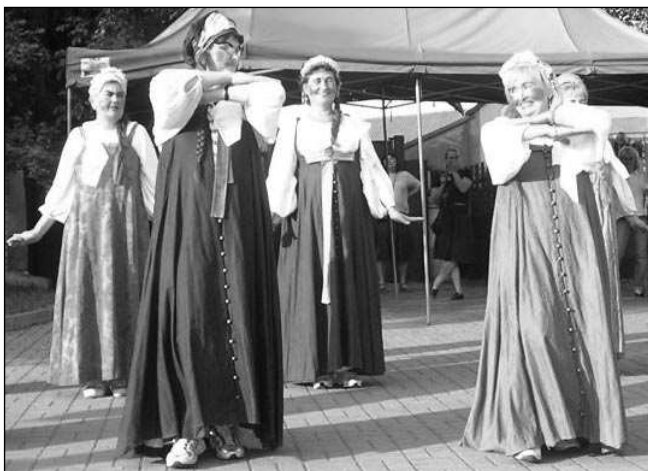
MARFUŠI. Ruské častušky v podání hlásnotřebaňských Holek v rozpuku rozesmály nejednoho z diváků.