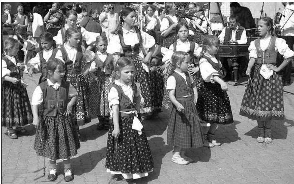
VALAŠI NA MÁJÍCH. Valašský soubor Vonička na mokropeském Masopustním náměstí.

V sobotu 9. května nedlouho po poledni festival v Černošicích-Mokropsích zahájilo vystoupení kapely Třehusk, která se zaměřuje na městský, staropražský folklor, a úvodní proslov tradičního »záštitce« festivalu, senátora Jiřího Oberfalzera. A pak se na Masopustním náměstí, jehož kolorit dotvářely desítky stánků