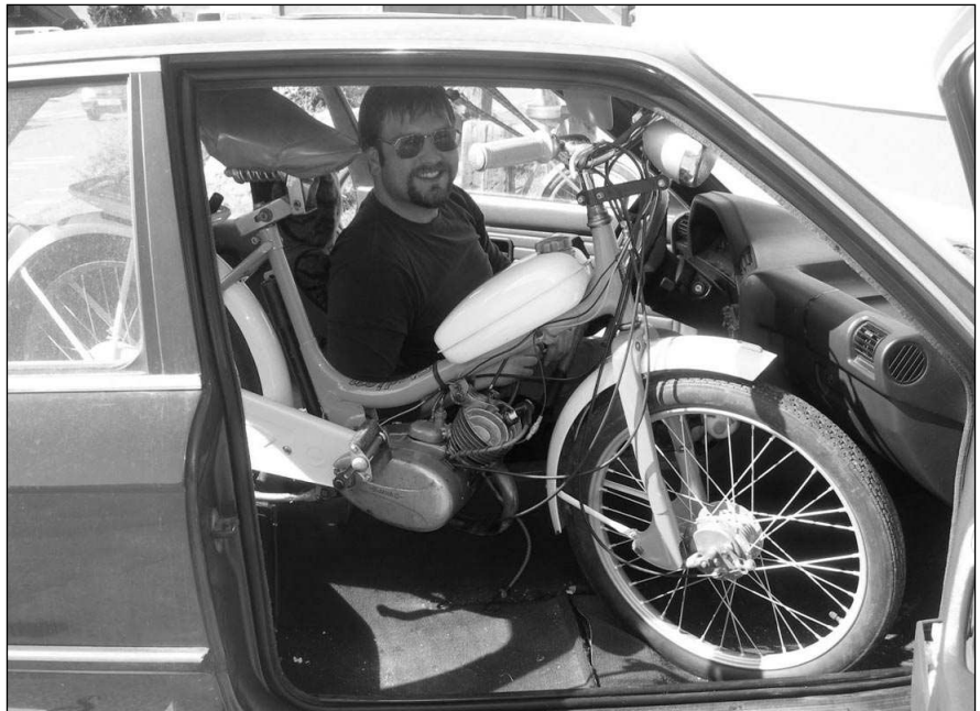
MANŽELKU NECHAL DOMA. Nadšenec z Brna si na sraz mopedistů do Žebráku svoji »mašinu« přivezl přímo v autě.

Přijďte se svými dětmi vyzkoušet příjemné prostředí solné jeskyně! Rodiče si odpočinou a caparti si pohrají v solném písečku, pozdraví solné skřítky a dostanou malý dárek ke svému svátku. Na akci je nutné se objednat do 28. 5. a zaplatit vstupné 30 Kč (platí pouze dospělí). Informace na tel.: 311 510 541. Romana HOUDKOVÁ, Líteň