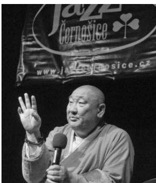
Černošice navštívil ctihodný Chamba Láma Čojdzamc, opat kláštera Ghandančenling v hlavním městě Mongolska a hlava buddhistů-lámaistů oblasti. (Viz strana 4)