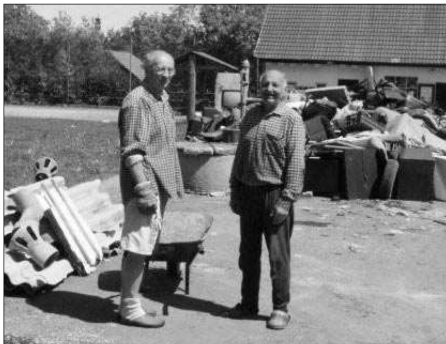
Sběr nebezpečného odpadu ve Všeradicích po odvozu dvou velkoobjemových kontejnerů, ještě dva jsou připraveny k odvozu. Největší účast za poslední roky. Text a foto Bohumil STIBÁL