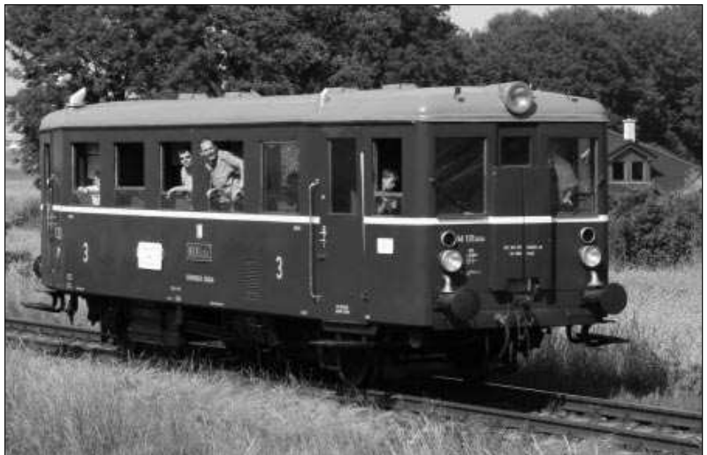
Od června se budete moci každou neděli na podbrdské trati svézt historickým motoráčkem.

„Projekt jsme nazvali Podbrdský motoráček, ale bude mít širší záběr,“ uvedl Bohumil Augusta z KŽC. „Vlaky budou vyjíždět už ze Zdic, po lochovicko-liteňské trati budou pokračovat do Zadní Třebaně a odtud ještě dále do Karlštejna. Zde se necelé tři hodiny zdrží a po stejné