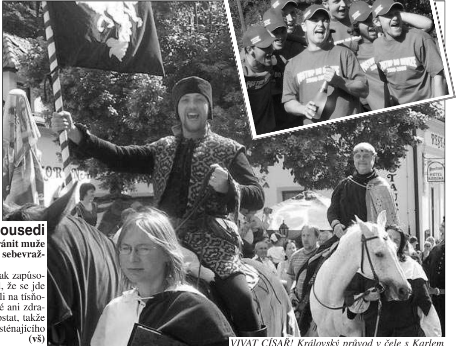
VIVAT CÍSAŘ! Královský průvod v čele s Karlem IV. putoval první červnový víkend z Prahy na Karlštejn. V celém dolním Poberouní jej zdravily tisíce nadšených diváků, obce připravily bohatý uvítací program. (Viz strana 2)

Dobříčovice - V poslední chvíli se podařilo zachránit muže z Dobříčovic, který chtěl 1. června ráno spáchat sebevraždu za použití prášků. Nešťastník se před činem posilil alkoholem, ten však zapůsobil dříve. Postižený začal v bytě tropit hluk a křičel, že se jde otrávit. S tímto sdělením také sousedé v 7.15 zavolali na tíšňovou linku a zřejmě mu tím zachránili život. Policisté ani zdravotníci se do paneláku v ulici 5. května nemohli dostat, takže byli přivoláni hasiči, kteří do bytu pronikli. Muže sténajícího bolestí potom sanitka odvezla do nemocnice. (vš)