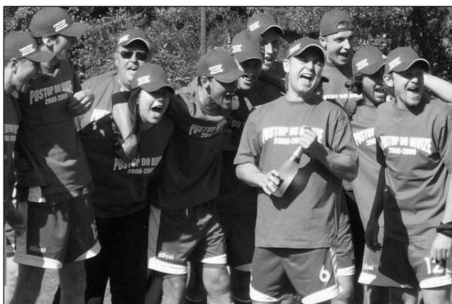
OSLAVA POSTUPU. Řevničtí fotbalisté se radují poté, co definitivně stvrdili postup do divize.

Hosté přijeli pro bod, získali všechny! Z prvního protiútoku v 17. minutě se ujali vedení. Domácí měli převahu, ale nedokázali se prosadit. V 37. minutě podnikli hosté další protiútok a zvýšili náskok. Druhý poločas byl ze strany domácích vabank,