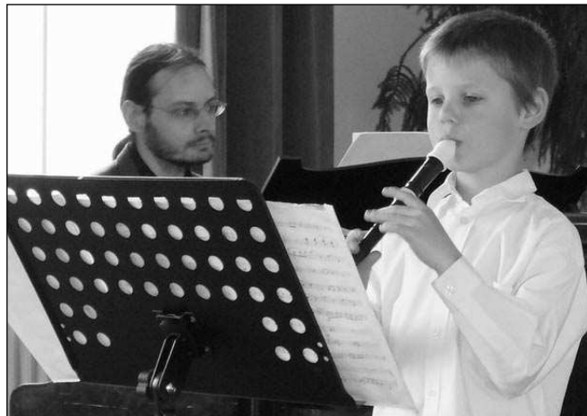
MALÍ UMĚLCI. Děti ze základní umělecké školy Řevnice v závěru školního roku vystoupily na několika koncertech.

19. 6.17.00 a 19.30 EL PASO 20. 6.17.00 a 19.30 NORMAL 21. 6.17.00 a 19.30 BABIČKA 26. 6.17.00 a 19.30 MONSTRA VS VETRELCI 27. 6.17.00 a 19.30 PO SVATBĚ 28. 6.16.00 a 19.00 DER BAADER MEINHOF KOMPLEX