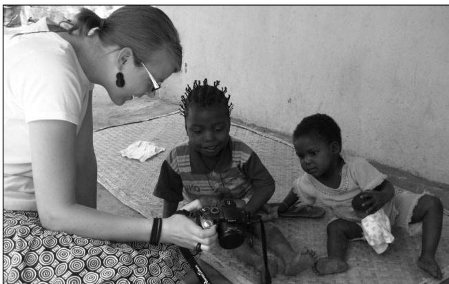
Dobrovolnice ze SIRIRI ve stacionáři pro sirotky.