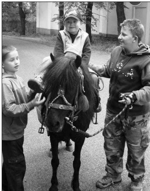
Liteňské děti se na Květinovém dnu mohly svést na poníkovi (vlevo), v Zadní Třebani zase obdivovaly ovečky.