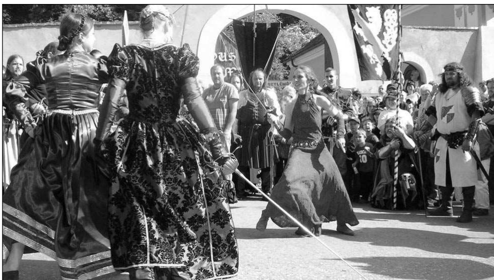
NA POČEST CÍSAŘE. Karla IV. v Karlštejně pozdravily také šermířky z Černošic.