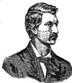
Karel Havlíček - Borovský