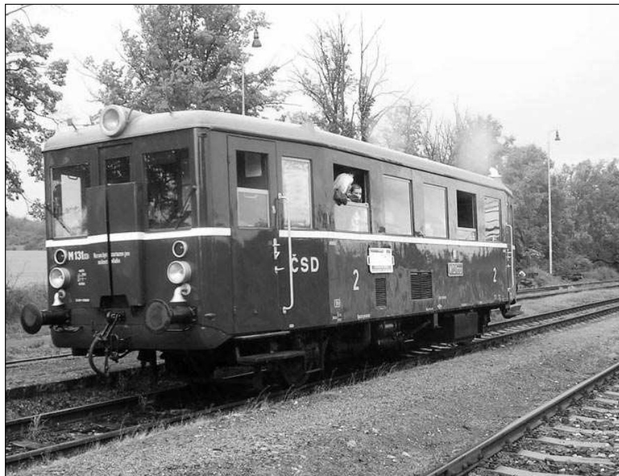
UŽ JEDE! Historický motorák »Hurvínek« vyráží na první jízdu z Lochovic směr Všeradice, Zadní Třeboň a Karlštejn.