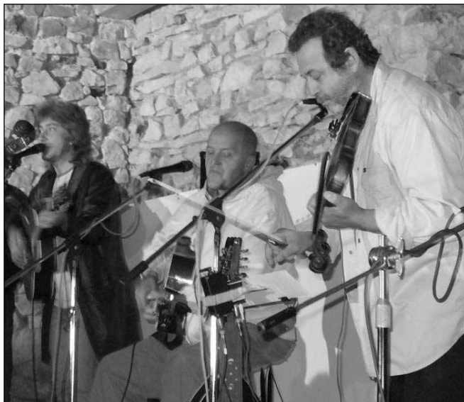
RANGERS. Program letošních Slavností trubačů vyvrcholí koncertem známé kapely Rangers-Plavci. Na snímku je část skupiny při první prohlídce svinařského zámku, která se konala předloni.