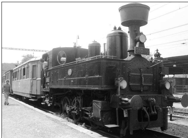
Parní vláček na nádraží v Zadní Třebani.