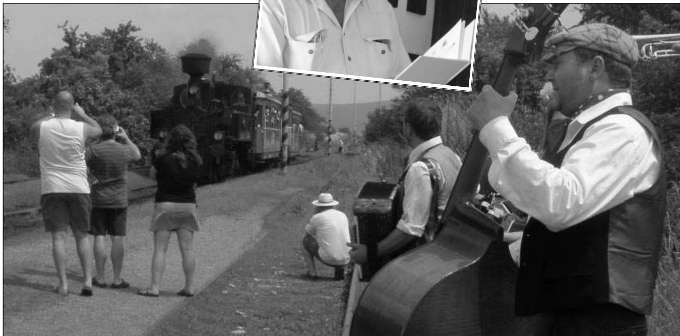
JEDE PÁRA! Vlak tažený parní mašinou projel první červencovou sobotu tratí podbrdské lokálky. (Viz strana 3)