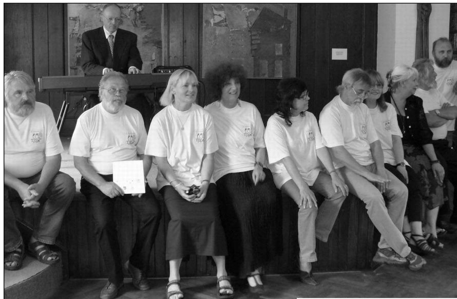
UMĚLCI. Malíři, kteří se zúčastnili čtvrtého ročníku všeradickeho Art Symposia.