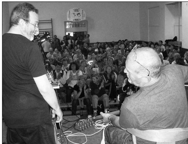
APLAUS PRO RANGERS. Kapela Rangers na Slavnostech trubačů aplaudoval zaplněný sál hlásnotřebované sokolovny.

* Výstava Zkamenělé poklady je v berounském Muzeu Českého krasu přístupná do 13. 9. David PALIVEC