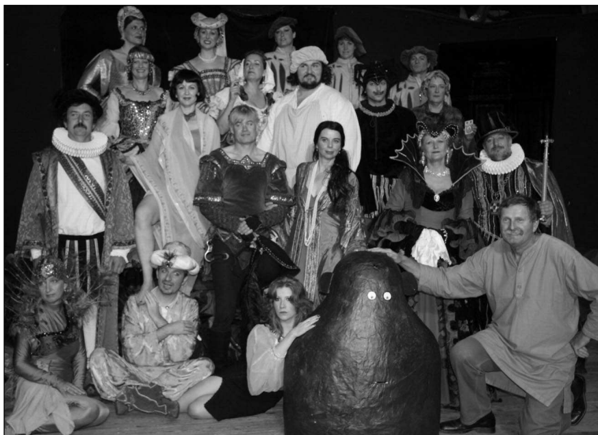
Dobřichovičtí ochotníci ve feérii Oživlá hlína .