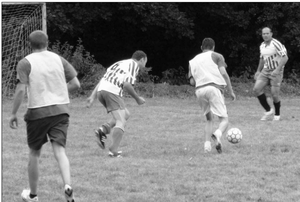
DOMÁCÍ V AKCI. Svinařští fotbalisté (v pruhovaném) vybojovali na domácímu turnaji v malé kopané druhou příčku.