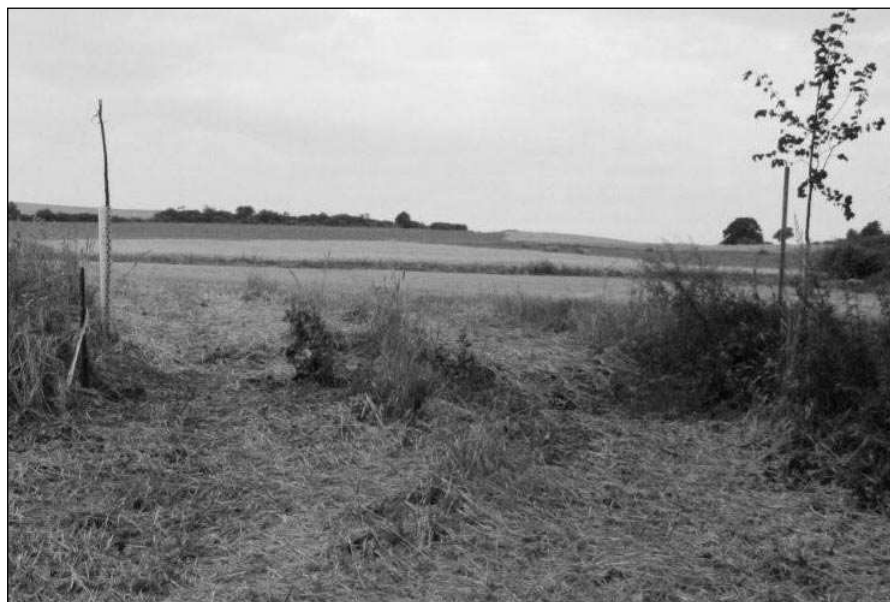
KOMU PŘEKÁŽELY...? Torza lip v obnovené všeradicke aleji.