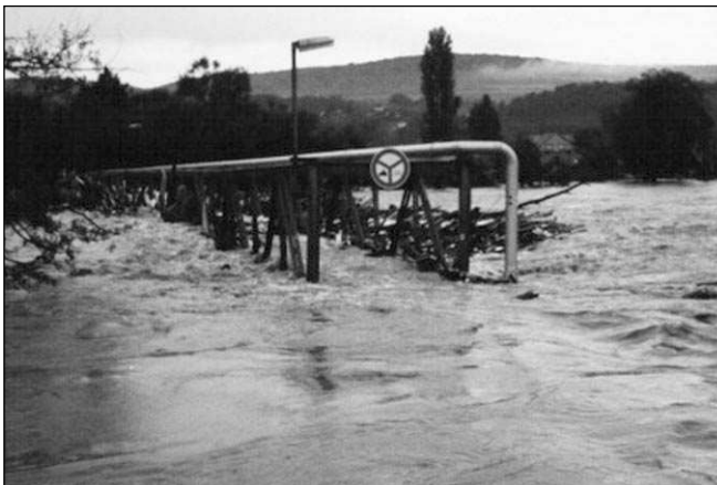
LÁVKA POD VODOU. Zatopená lávka mezi Hlásnou a Zadní Třeboň při povodních v srpnu 2002.

Rok začal sněhovou kalamitou, kdy závěje zastavily vlak (NN 1/2002). Předtím však založili Hlásnotřebeňští novou tradici - zpívání na násvi (NN 1/2002) a v únoru se do Svinář vrátil masopust (NN 3/2002). Zatímco na začátku srpna se NN věnovaly polemice o rozhledně (NN 16/2002), hledaly místa, kde se dobře koupe (NN 14/2002) a o povodních informovaly jen jako o události z jihu a západu Čech (NN 16/2002), o dva dny později už bylo vše naprosto jinak. Čtyři zvláštní vydání během týdne informovala o hrůzách, které velká voda přinesla do Dolního Poberouní. Další články vyšly v regulárním čísle (NN 17/2002) a NN stá-