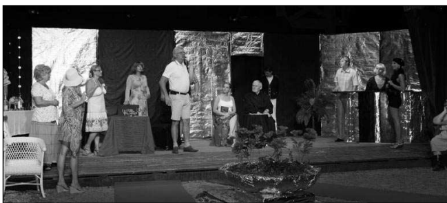
Záběr z divadelní hry Sbalí Karla z Monte Carla?