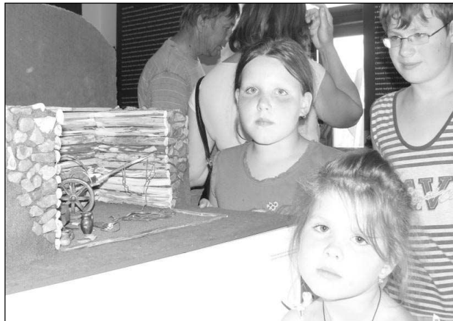
VELKÝ ZÁJEM O MUZEUM. Slavnostního otevření nového všeradického muzea se zúčastnilo několik desítek návštěvníků.