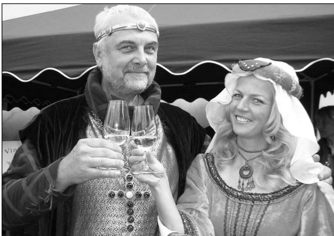
CÍSAŘSKÝ PÁR. Také na letošní vinařské slavnosti do Dobřichovic dorazí Karel IV. s manželkou Alžbětou.

Do 3. 9. kino nehraje. 4. 9. 17.00 a 19.30 NOC V MUZEU 2 5. 9. 17.00 a 19.30 GRAN TORINO 6. 9. 15.00 PERNÍKOVÁ CHALOUPKA 6. 9. 17.00 a 19.30 PAŘÍŽ 36