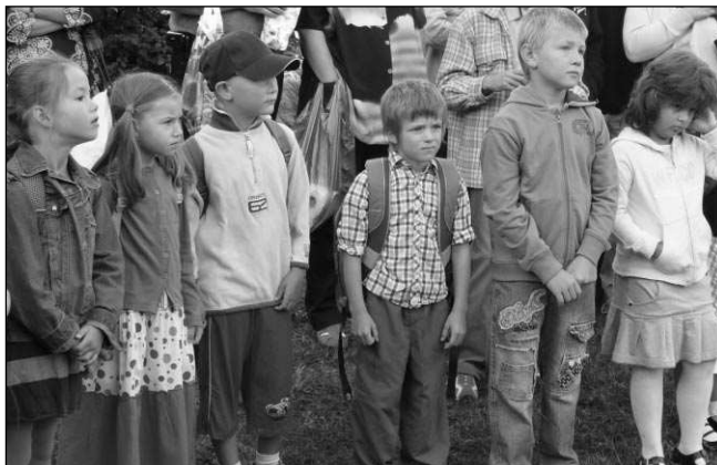
NEJDŘÍV SE ZPÍVALO. Nový školní rok začal 1. 9. i v zadnotřeboňské mlátidce. Před školou si nejdříve děti s učitelkami zazpívaly písničku. Do školy letos přišlo čtrnáct prvňáčků. (lup)