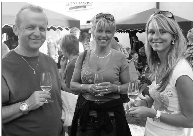
VÝBORNĚ! Skvělé víno si na Vinařských slavnostech v Dobřichovicích vychutnávaly stovky návštěvníků.