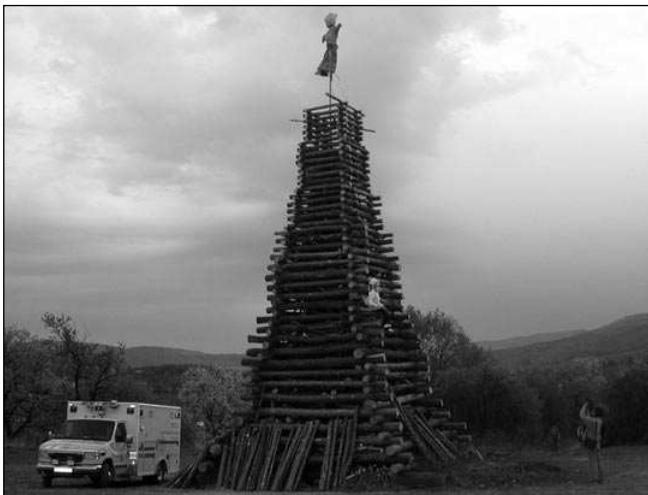
Rekordní čarodějnická hranice v Řevnicích.

Napište nám i vy, co jste si rádi v NN přečetli, ale také co vám v nich chybělo a chybí. Z vašich příspěvků vylosujeme pět čtenářů, pro které jsou přichystána trika s logem NN a další dárky. Ze všech událostí vybereme Událost dvacetiletí, jež bude vyhlášena v listopadu v rámci oslav dvaceti let existence nezávislého poberounského občasníku. Články roku 2003 naleznete na: www.nasenoviny.net . Josef KOZÁK