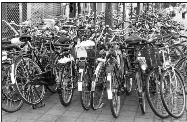
Bonn je městem cyklistů.

20. Na sportovní nebo horské stroje tu totiž moc nenatrefíte, protože se tu kolo používá převážně jako dopravní prostředek z místa A na místo B. Jsou to vesměs mohutná městská kola s vysokými řídítky, aby jezdec mohl sedět zpříma, mají blatníky, kryty řetězů, nosič, košík, nezbytný zvonek a také světlo na dynamo! Že kola k Bonnu neodmyslitelně patří, dokládá třeba každoměsíční trh s »ojetinami« nedaleko místní univerzity nebo jediný pohled na budovu nádraží, k níž je skoro problém se dostat přes tu spoustu zaparkovaných kol, které se prý vůbec nekradou. Upřímně, už jsem si také zvykla jen prostrčit zámek skrz zadní kolo a