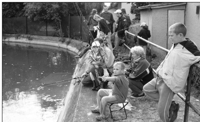
VÝLOV V HATÍCH. Tradiční výlov ryb z hasičské nádrže se konal v Hatích. V 7.00, kdy výlov začínal, začínalo také pršet a foukal silný vítr. Naštěstí zde bylo několik šikovných kutílů, kteří během pár minut postavili provizorní pergolu. Počasí se nakonec umoudřilo a výlov navštívilo dost hostů. Odpoledne zahrála skupina Sedláci, kterou v pauzách střídala p. Lojda s harmonikou. Poslední hosté odcházeli před druhou hodinou ranní a i přes chvílemi podzimní počasí se výlov vydařil - nejlepší výkon byl 22 vylovených ryb. Spolu s výlovem ryb se v požární zbrojnici konala výstava fotografií ukazující práci i zábavu dobrovolného hasičského sboru v Hatích od jeho založení před 75 lety až po současnost. Spousta návštěvníků se na fotkách poznala a společně zavzpomínali na doby minulé.