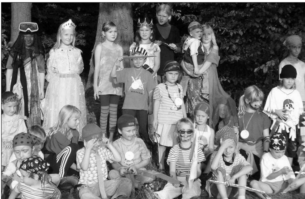
PIRÁTI, PRINCEZNY A SPOL. Děti ze souboru Klíček se jako pohádkové bytosti vyřádily.