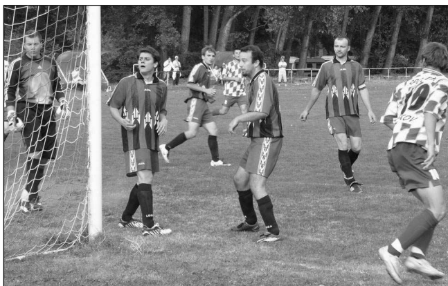
DOSTALI »BŮRA«. S Českým lvem Beroun prohráli fotbalisté zadnořebského Ostrovanu na svém hřišti 2:5.

Řevničtí borci mají za sebou černý týden - dva zápasy bez bodu. Tentokrát nestačili na Třeboň. Domáci měli chvílemi drtivou převahu, ale nedali dvě penalty, takže si vyhrát zřejmě ani nezasloužili. (mák)