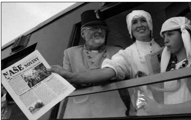
V parním vlaku, který v roce 2004 vypravily Naše noviny, bylo k máni zvláště vydání nezávislého poberounského občasníku.

PLETLI OBÁLKY (NN 22/2004). Mikroregion Horymír nechal vystavět odpočívadla - HORYMÍR JEŠTĚ