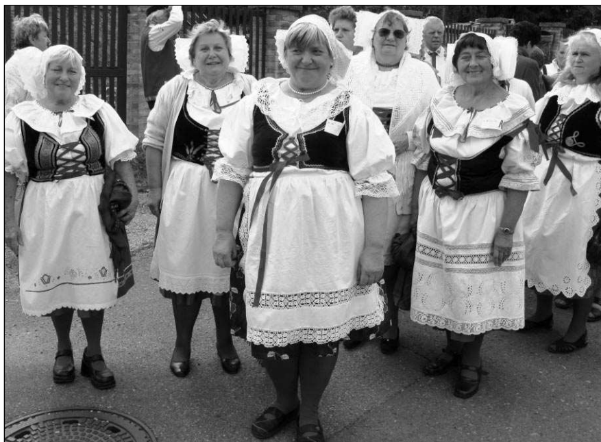
TETIČKY OSLAVENKYNE. Řevnické baráčnice při oslavách svého spolku.