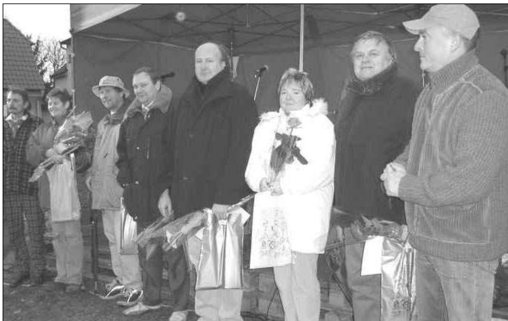
KDO TO BUDE? Jméno toho, kdo letos získá Cenu Našich novin, se dozvíte v listopadu.