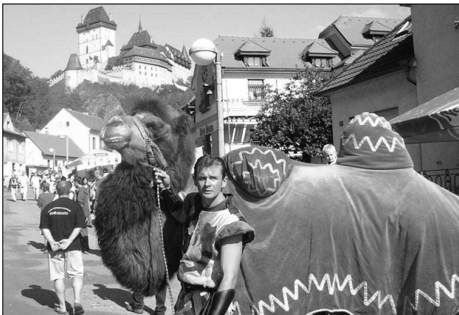
TRADIČNÍ ÚČASTNICE. Ke karlštejnskému vinobraní neodmyslitelně patří i patnáctiletá velbloudice Landyšá.