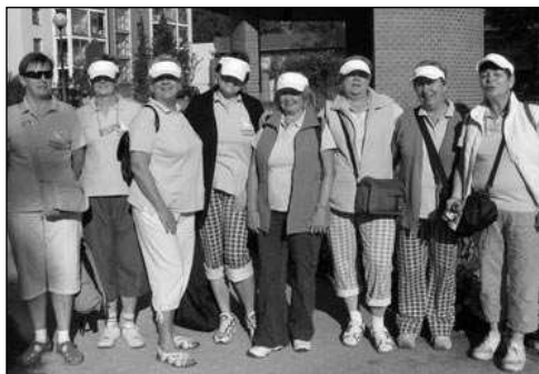
NA VÝLETĚ. Hlásnotřebské »holky« pózují v Hodoníně.

Rok utekl jako voda a skupina hlásnotřebských žen, která si říká Holky v rozpuku, opět odjela do Lázní Hodonín. Zde jsme si čtyři prosluněné dny nechaly hýčkat těla lázeňskými procedurami a dobrým vínkem. Lázeňský personál nás již dobře zná, a proto nás přivítal velmi mile. Prohlédly jsme si Hodonín, zda nepřibýlo něco, co bychom ještě neznaly. Popily jsme i dobrého vínka ve sklípku v Mutěnicích, podnikly výlet do Čejkovic, kde jsme prošly vyhlášené