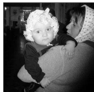
NA MŠI SVATÉ. Češi (ti rumunští) jsou zbožní. Do kostela samozřejmě chodí starí, mladí i ti úplně nejmladší...