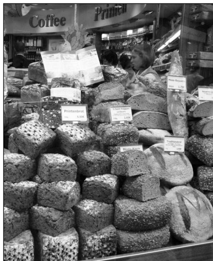
CO SI DÁTE? Výběr pekařských pochoutek je v Německu obrovský...

Co zní naším ušima jako jasný dotaz prodavačky ve venkovském koloniálu, když si kupujete salám k svačině, to je v Bonnu běžná otázka při koupi chleba. Poprvé jsem byla trochu překvapená, ale teď už se »vyznám« a dopředu hlásím, že bych prosila ten a ten druh a nakrájet. Paní za pultem se usměje, ukrojí z bochníku půlku (hospodaření v jednom člověku je taky docela veselé...), tu vloží do takové maxiverze kráječe na vajíčka se strunami na svíslu, načechá to krátce zavřít a na druhé straně vylezou úhledné chlebové plátky. Ty pak prodavačka vloží do igelitového pytlíku, který je perforovaný, aby se chleba nezapařil. Při placení se vždy zeptá, zda si budu přát doklad, aby ho netiskla zbytečně, a nakonec mi popřeje hezký zbytek dne, nebo víkend, nebo se jinak mile rozloučí. Jsou to vlastně jen takové drobnosti, ale dělají ten rozdíl.