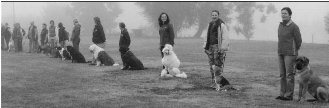
RANNÍ NÁSTUP. Účastníci kynologických zkoušek v Letech na nástupu před zahájením akce.

NA LETOVSKÉM CVIČÁKU SE »PŘEDVÁDĚLI« NĚMEČTÍ OVČÁCI, PUDL I LOUISIANSKÝ LEOPARDÍ PES