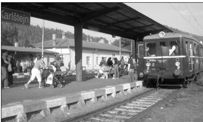
PŘED JÍZDOU. »Hurvínek« na nádraží v Karlštejně.

doval“. „Koupili jsme vrak z roku 1949, který jsme zrekonstruovali do původní podoby. Je to nejstarší dochovaný motorový vůz u nás,“ dodal Augusta. Pavla ŠVĚDOVÁ