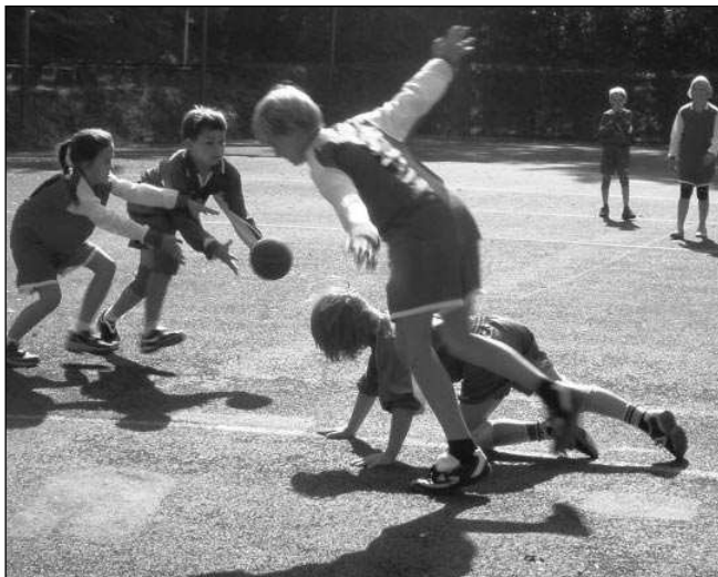
LÝTY BOJ. Tanečně-sportovní kreaace v podání nejmladších řevnických házenkářů.

V prvním poločase jsme propadli v obraně, ale ani v úvodu jsme při střelbě nemohli mít čistě svědomí. Ve 2. poločase nastoupil na beka Tomáš