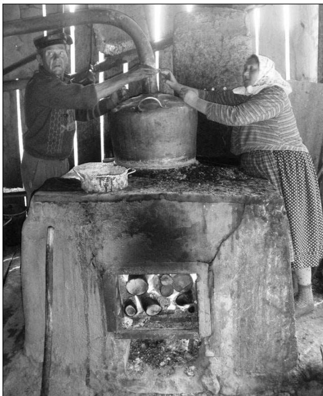
PÁLENICE V GERNÍKU. Jakmile se jednou pod kotlem založí oheň, nesmí vyhasnout...

Jejích mise, během níž zhlédnou několik šumavských hradů, začne ve středu 28. 10. na třebeňském nádraží. Odtud se vlakem přepraví do Horaždovic, které jsou výchozím místem letošní expedice. Trasa prvního dne povede přes vrch Prácheň se zříceninou stejnojmenné gotické pevnosti do Žichovic a Rabí. Prohlídka zdejšího hradu, proslaveného bitvou, v níž přišel o oko známý husitský vojevůdce Žižka, výletníky čeká druhý den. Po exkursi pošloupou dále do Žihobců, Strašína, kde uvidí největší šumavský kostel, a do Nezdic, kde přenocují. V pátek 30. října mají výletníci v programu rozhlednu na hoře Javorník, hrad Kašperk. Pustý hrádek a vrch Sedlo s nádherným výhledem po celé západočeské části Šumavy. Po posledním noclehu, tentokrát ve starobylé vsi Albrechtice už turisty čeká jen deset kilometrů do Sušice, prohlídka města a návrat domů. (miř)