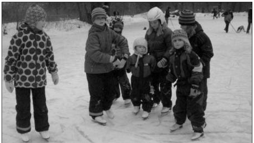
NA RYBNÍCE. Na rybníce ve Svinařích bruslili v minulých dnech malí i velcí.

V Dobřichovicích stál jednorázový úklid dokonce přes sto tisíc, pracovníci museli navíc odvázet snůh z centra. Podle starosty Michaela Pánka peníze budou chybět. „Už takhle máme rozpočet o 10 milionů nižší než loni. Úplně jsme škrtili investice, ze současných 20 milionů nejsme schopni zaplatit ani to základní – provoz úřadu, školy, školky, osvětlení, údržbu... Ještě 4 miliony nám chybí. Měla by se znovu rozpoutat diskuse o tom, zda je s-