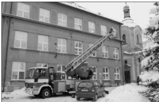
Hasiči odstraňují led ze střechy školy v Liti.

Třicetimetrový hasičský žebřík z Berouna se tříčlennou obsluhou a dalšími třemi hasiči ze Řevnic odstraňovali snůh a rampouchy z budovy školy v Mořině. Vilém ŠEDIVÝ