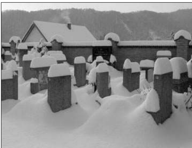
ZASYPANÉ HROBY. Přívaly sněhu zasypaly také hroby na hlásnotřebském hřbitově.