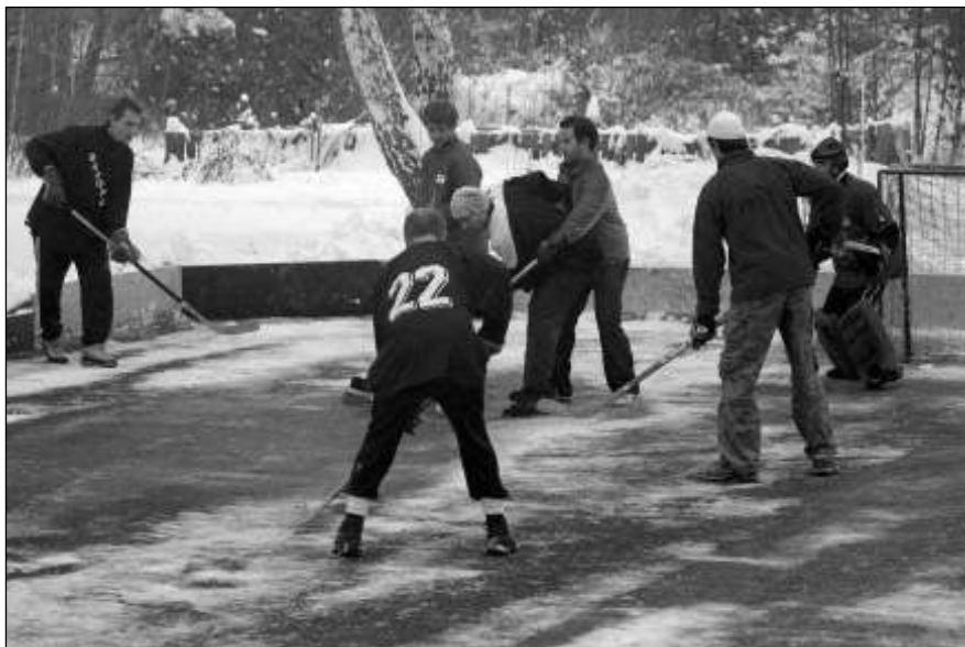
HOKEJ »NA SUCHU«. Boje třináctého ročníku řevnického turnaje v pozemním hokeji Bandy cup jsou v plném proudu.