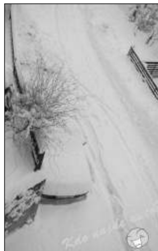
KDO NAJDE AUTO?