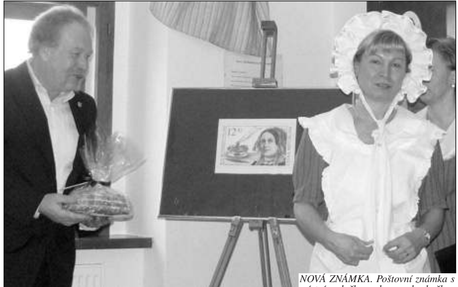
NOVÁ ZNÁMKA. Poštovní známka s místní rodačkou, slavnou kuchařkou M. D. Rettigovou byla pokřtěna ve Všeradicích.