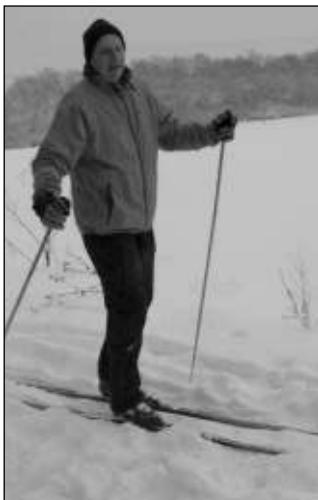
LYŽAŘ. Běžkař na cestě do Haloun.

ZIMNÍ SNÍMKY NÁM POSÍLEJTE NA ADRESU: redakce@nasenoviny.net, AUTOŘI TĚCH NEJHEZČÍCH ZÍSKAJÍ CENY