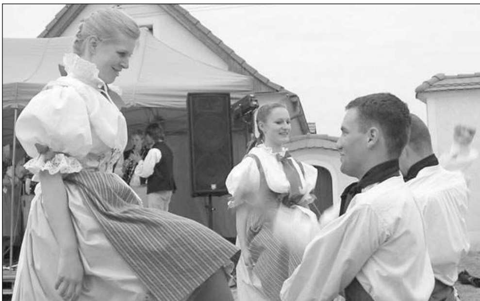
Desítky folklorních souborů z celé republiky i ze zahraničí dorazí na festival Staročeské máje.

Zahraniční folklor tentokrát bude reprezentovat temperamentní sloven-