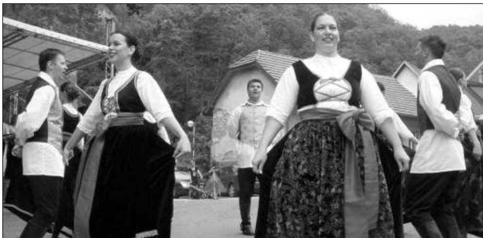
CHORVATI POD HRADEM. Chorvatský soubor Jedinstvo předvedl skvělé tance i kroje.

Pak se průvodem od místní pošty vydala krojovaná družina v čele s dechovkou. Na náměstí už ji očekával starosta Ureš a také senátor Jiří Oberfalzer, který nad festivalem tradičně převzal záštitu. Oba pozdravili přítomné a starosta udělil právo k pořádání májů. Zábava mohla pokračovat. Pásmo tanečků předvedly děti z Hlásné Třebaně se svými rodi-