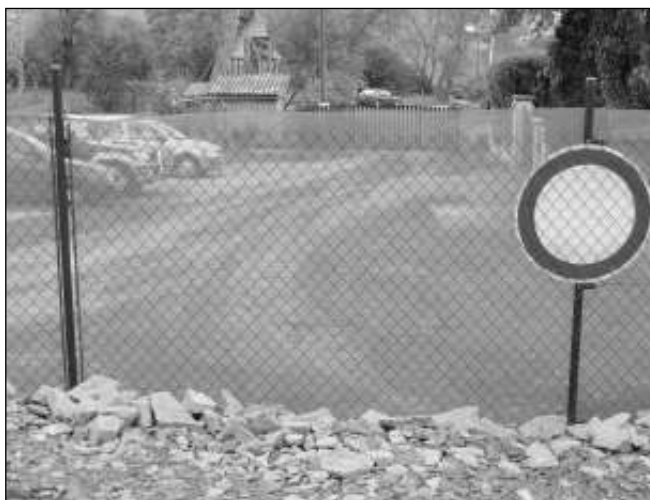
ZÁKAZ VJEZDU. Majitel pozemku přehradil ulici plotem a vyvěsil značku zákaz vjezdu.

„Ned jsem obešel sousedy a upozornil je na to, že za rok si chci oplo-