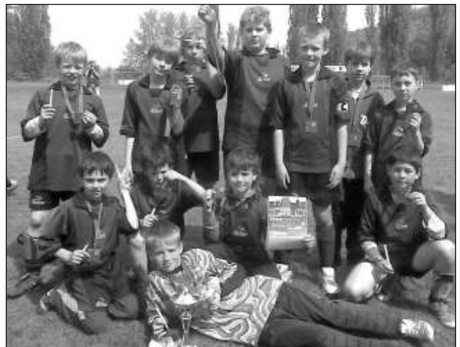
Malí osovští fotbalisté s bronzovými medailemi.

rý se ve vitrině slávy pěkně vyjímá. Děti po návratu dostaly dětský šampus, který spolu vypily z putovního poháru. Jana FIALOVÁ, ZŠ Osov Hana HAVELKOVÁ, ZŠ Litěň