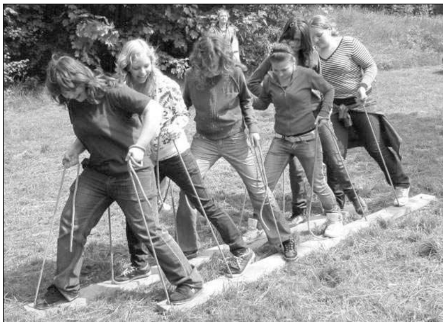
A JDE SE! Liteňské osmačky při soutěži v chůzi na kládách.

P.S.: Děkujeme mysliveckému sdružení Ostříž, majitelům Višňovky, i rodičům a spřátelené veřej-