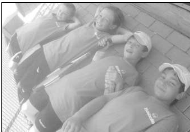
Řevničtí tenisté, již porazili berounský Sport Eden.

Branky: Neugebauer 2 Tetín - Všeradice 0:12