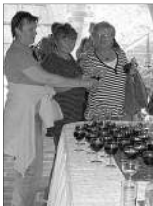
Holky v rozpuke při zdolávání zásob vína na Karlštejně.