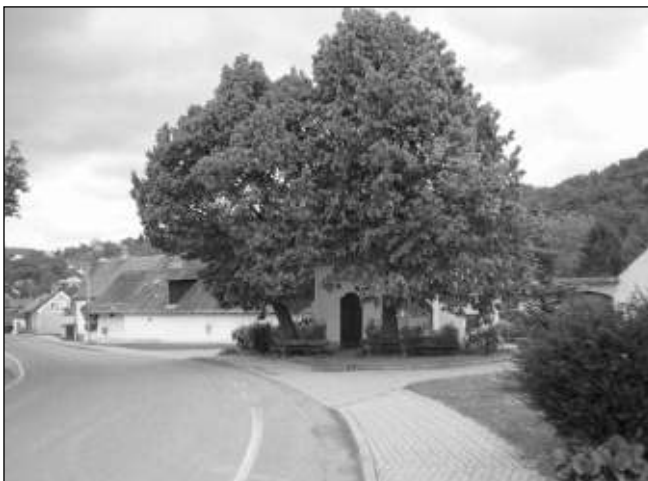
HLÁSNÁ TŘEBAŇ. Dominantou návsi je kaplička.

Kolem návsi stojí nejstarší domy v obci, silnice tu vede od začátku 20.