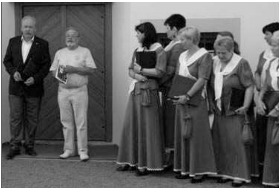
ZPÍVAL SBOR. Na všeradické vernisáži zazpíval Sbor paní a dívek z Litomyšle.