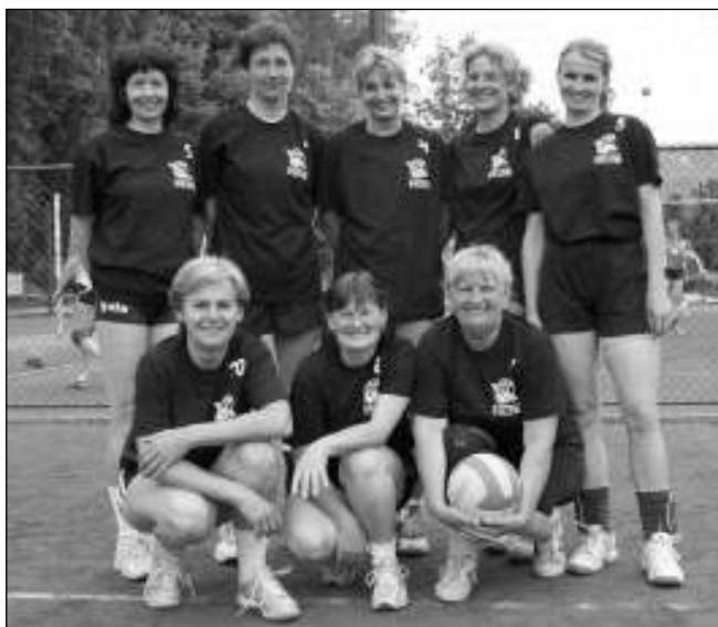
SENIORKY. Tým Dobřichovic, který na mistrovství České republiky ve volejbale seniorek obsadil deváté místo.

Po slavnostním zahájení a po státní hymně uvítal sportovkyně starosta Dobřichovic M. Pánek. Ve všech utkáních hráčky dokazovaly, že z volejbalového umění neztratily vůbec nic, že mají radost ze hry a že v bojovnosti a zápalu předčí mnohé »juniorky«. Hrál se přitom fair-play, bez dramatických diskusí o tom, zda míč byl či nebyl v autu, a na všech děvčatech bylo vidět, že si přijela zahrát a ne zvítězit za každou cenu. Mistrzem České republiky ve volejbale seniorek se stalo družstvo ABC Bráník, které tak obhájilo titul z loňského roku, na 2. a 3. místě se umístily seniorky Slávie Děčín a VK Křenovice (loni druhé); tato družstva získala pohár a všechny hráčky medaili. Nejlepší nahrávačkou byla I. Pokorná (ČZU Praha), nejlepší blokačkou M. Bromová (Děčín), nejlepší smečačkou B. Hartingová (Děčín) a nejvšestrannější hráčkou M. Černá