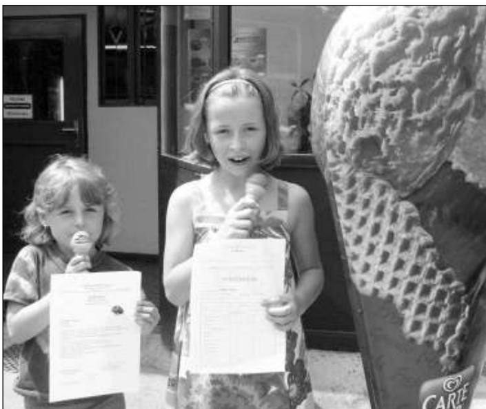
ZMRZLINA ZA VYSVĚDČENÍ. Řevnická cukrárna na náměstí rozdávala dětem za vysvědčení zmrzlinu zdarma.

ZDEJŠÍ ZÁKLADNÍ ŠKOLU SI O PRÁZDNINÁCH VEZMOU DO PRÁCE ŘEMESLNÍCI