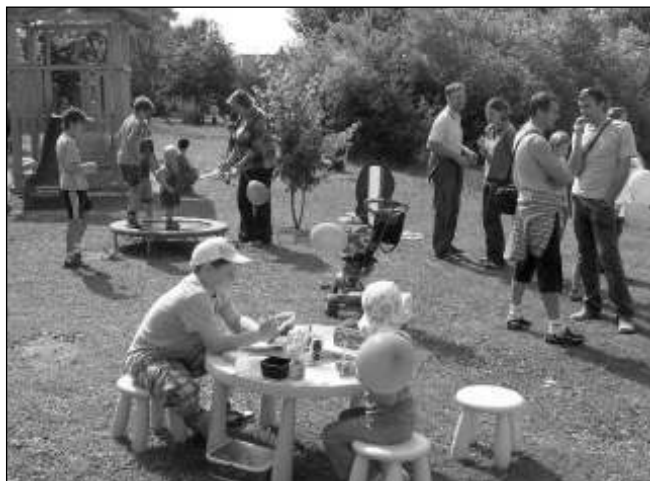
PIKNIK. Liteňský piknik, na kterém byly zprovozněny první prvky budoucího dětského hřiště - domeček a pískoviště.

Všichni zúčastnění věří, že se po stokorunách (a třeba i tisícikorunách) podaří sehnat potřebné peníze a v