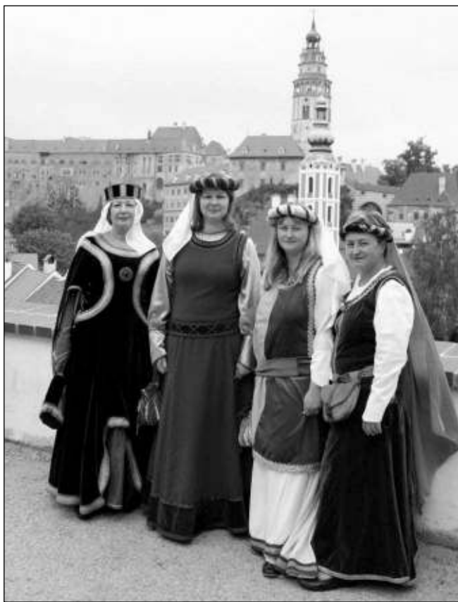
NA SLAVNOSTECH. Část karlštejnské výpravy na Slavnostech pětilisté růže v Českém Krumlově.