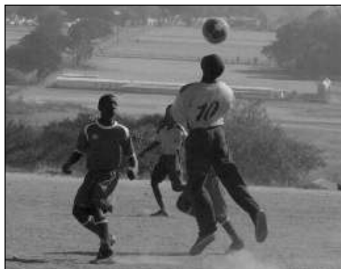
HRAJÍ VŠUDE. V Jihoafrické republice hrají fotbal malí i velcí doslova všude.

„Bylo to náročné, jsem rád doma,“ uvedl pro NN Palička. JAR je podle něj rozmanitá země, jež dýchá pro mistrovství světa. Fotbal tam hrají děti i dospělí všude na ulicích, na tržištích se prodávají vlajky a dresy, ale také třeba slepičí pařáty k jídlu. „Ty jsem si nedal, i když mi je pořád