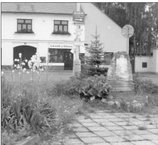
LITEŇ. Dominanty liteňského náměstí - pomník padlým z druhé světové války a ošklivé nákupní středisko