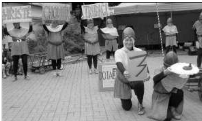
DOSTALI JSME... Holky v rozpuku při zpěvu písně o dotacích, které Hlásná Třebeň nedostala od krajského úřadu.

To je teda podraz, však žádná novina, že neprošel dotací vodovod Rovina.