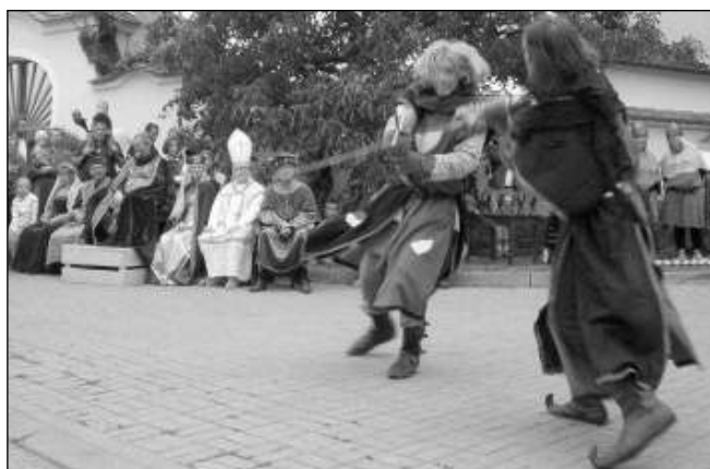
NA POČEST CÍSAŘE. Šermířská skupina Harciři předvedla na počest Karla IV. několik lýtých soubojů.

Byl to moc příjemný den, plný zážitků, a tak se už teď moc těším na příš-