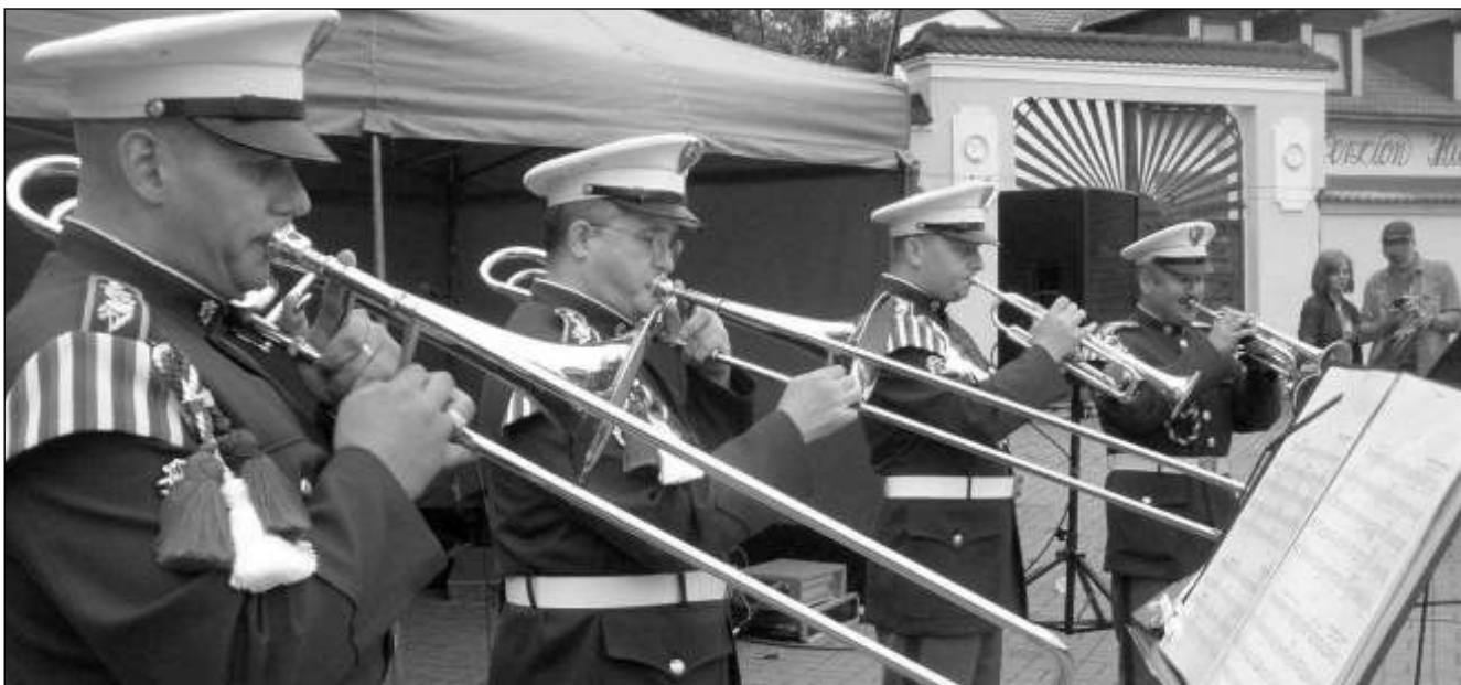
TRUBAČI PANA PRESIDENTA. K ozdobám letošních hlásnotřebaňských slavností patřili Trubači Hradní stráže presidenta republiky.