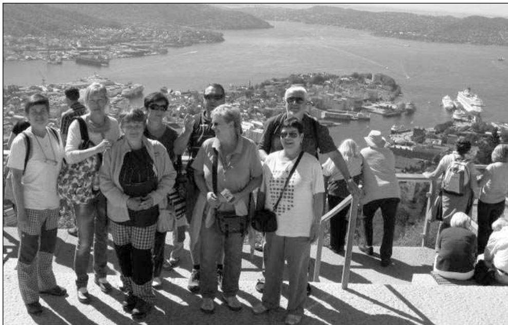
KRÁSNÁ VYHLÍDKA. Hlásnotřebské Holky v rozpuku na vyhlídce nad norským městem Bergen.

Vychutnaly jsme si i dvouhodinový výlet lodí Aurlandsfjordem a Naeroyfjordem, který je místy jen 250 metrů široký, i město Flam, které je konečnou stanicí světoznámé železnice. S autobusem jsme šplhaly do výšek i 1200 metrů, kde byla sněho-