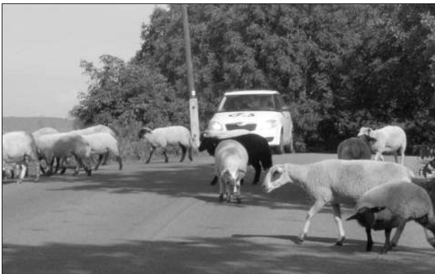
POZOR, OVCE! Stádo ovcí, ale i koz, bez jakéhokoliv doprovodu se v pondělí 26. července vydalo přes silnici do Berouna, u odbočky na Koněpruské jeskyně. Někteří řidiči měli co dělat, aby stihli včas a bezpečně dobrzdít.

VYHRÁT MŮŽETE TURISTICKÝ ATLAS STŘEDOČESKÉHO KRAJE, VÍNO ČI ŘECKÝ KOŇAK METAXA