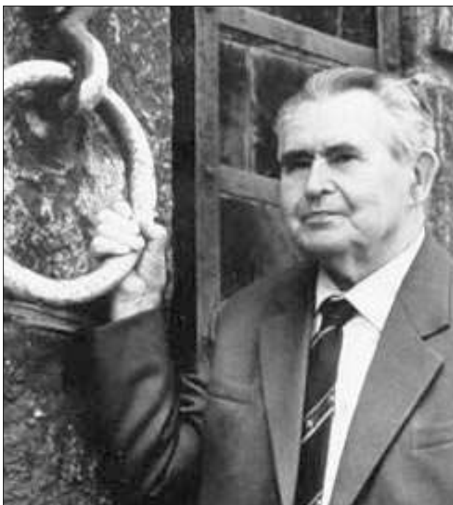
JESTŘÁB. Známý skautský spisovatel Jaroslav Foglar.

Do skautského oddílu vstoupil jako třináctiletý v roce 1920 a z počátku prošel několika oddíly. V jednom z nich získal i svou skautskou přezdívku Jestřáb, která ho pak provázela po celý jeho život. O prázdninách roku