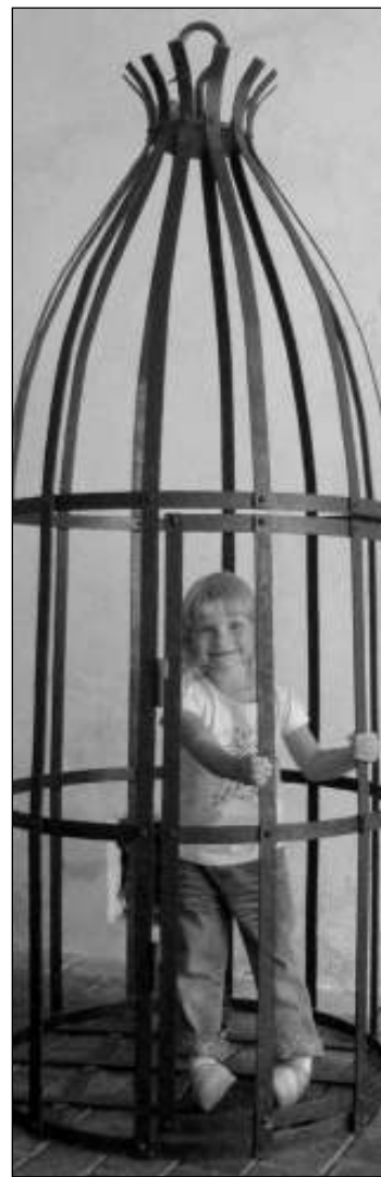
Pomůcka pro unavené rodiče.