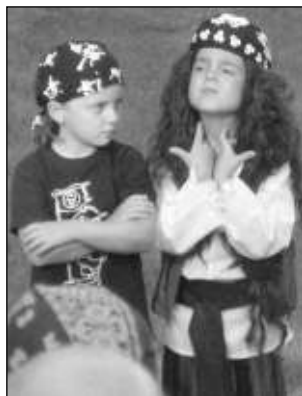
Dva malí piráti na táboře, který pořádá Domeček Hořovice. Základna Eustach nedaleko Tábora.