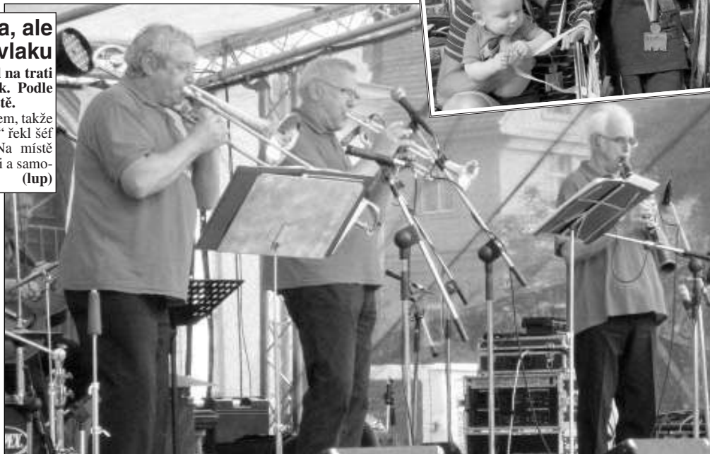
DIXIELAND V ŘEVNICÍCH. Osmá přehlídka dixielandových kapel se uplynulou sobotou konala v Řevnicích. Program zahájila skupina Ajeto Glass Dixieland z Nového Boru.

„Lidé v lese hodně padají, zřejmě jak se ženou za houbařskými úlovky. Už jsme ošetřovali vykloubené rameno, rozbitá kolena i zlomenou ruku,“ řekl šéf záchranky Bořek Bulíček. Minulý týden měli lékaři v práci starší ženu, kterou přivezli příbuzní z lesa, kde spadla na kámen. „Měla tržně zhmotněnou ránu asi 15 cm velkou,“ dodal Bulíček, jehož lidé většinou jezdí pro houbaře na kraj lesa. (lup)