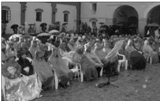
V PLÁŠTĚNKÁCH. I když druhé představení v Třeboni přšelo, jen se lilo, diváci odmítli odejít - dvě hodiny vydrželi v pláštěnkách.