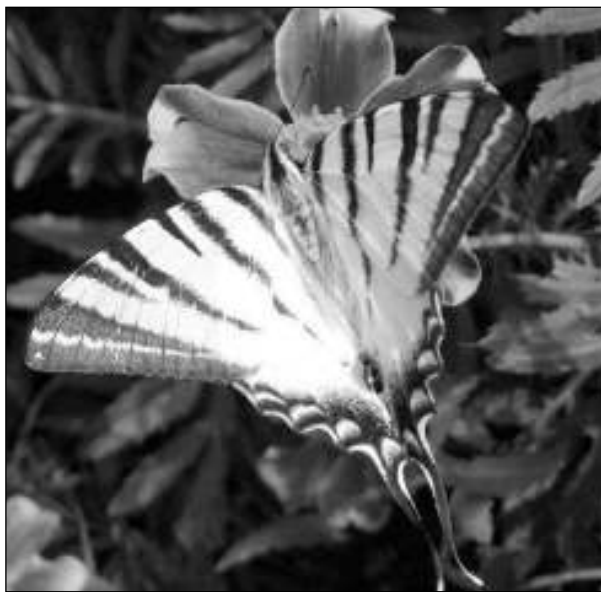
Host řevnické zahrady.