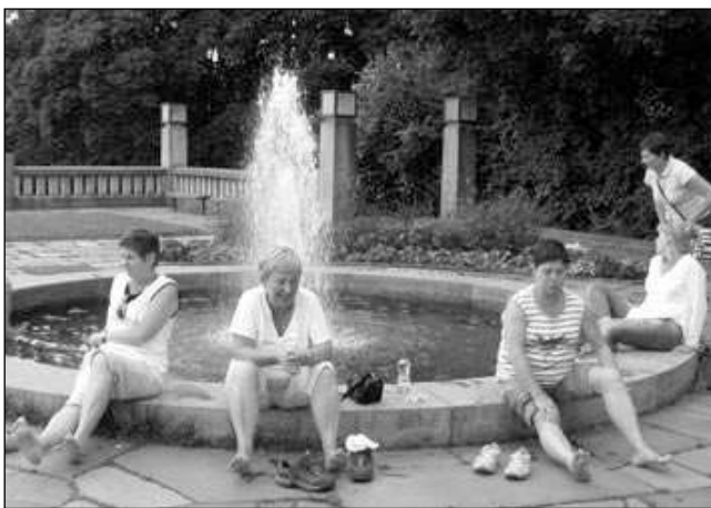
Po túře bolí nohy.