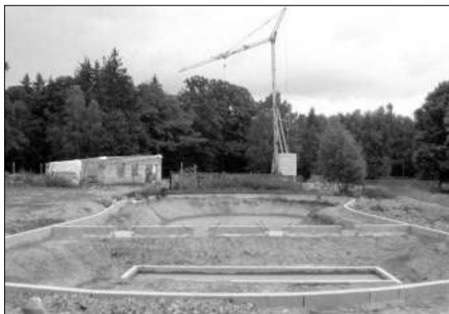
UPROSTŘED LESA. Takto to nyní vypadá na Rochotech. Uprostřed lesa pánuje čilý stavební ruch.

Dobříšská radnice, pod kterou spadá lokalita hájovny Rochoty, nemá ještě schválený nový územní plán. Dříve známý předpoklad termínu schválení byl do konce roku 2010. V návrhu nového dobříšského územního plánu je lokalita hájovna Rochoty navržena na přeměnu způsobu užívání z rodinného domu na pension s ubytováním vlastníka. Znáte to, řeči se vedou a voda plyne. Říká se prý, že pension v tomto unikátním, do té doby neposkrvněném zalesněném hřebetu v blízkosti Prahy má pojmut až 50 hostů. V jakém rozsahu se na tomto dříve klidném místě se zalesněným okolím staví a jak je tu rušno, si může každý návštěvník Brd ověřit sám. Hřebeny byly mimochodem koncem minulého roku rozhodnutím Rady Středočeského kraje vyhlášeny lokalitou s označením přírodní park Hřebeny (Brdy). Přírodní park znamená