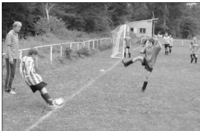
Dva zápasy odehráli mladší žáci fotbalového Ostrovanu Zadní Třebaň. V prvním z nich vyhráli doma s SK Chýňava 4:2 (na snímku), druhé utkání v Rudné se jim nepovedlo – prohráli vysoko 0:9. (Iup)

Sestava a branky: Benda- Leinweber, Hartmann P., Smrčka, Švarc- Hartmann 9, Zavadil 7, Knybel 5, Veselý 2, Jandus Franíšek ZAVADIL