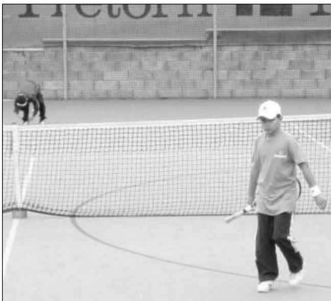
MALÍ TENISTÉ. Na řevnickém turnaji v babytenise se utkalo šestnáct hráčů z celého kraje.

Den po memoriálu se na kurtech za Lidovým domem konal turnaj v babytenise. Přihlásilo se šestnáct borců