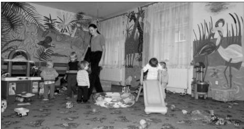
HERNA. Prostor Rodinného centra Letánek, který děti využívají ke hraní.

V nabídce Letánkových aktivit jsou i novinky. K dispozici rodičům je každé pondělí odpoledne a od úterý do čtvrtka dopoledne hlídací herna s