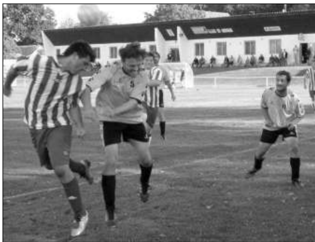
TĚSNĚ, ALE PŘECE. Liteňští fotbalisté na domácím hřišti prohráli s celkem Lučců 0:1.

Hosté získali zaslouženě tři body. Hned v 1. minutě po rychlé kombinaci poslal Lety do vedení Turek. V 24. minutě pronikl po křídle Kocman a po jeho centru skóroval Jůna. Domácí vyrovnali hru a v 41. minutě nařídil rozhodčí penaltu proti Letům. Domácí gólem do šatny snížili a výraznou převahu měli i úvodních 20 minut druhé půle. Hosté přeživší nápor domácích začali více kombinovat