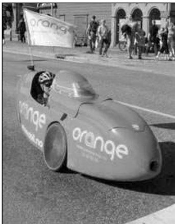
Šlapací formule.