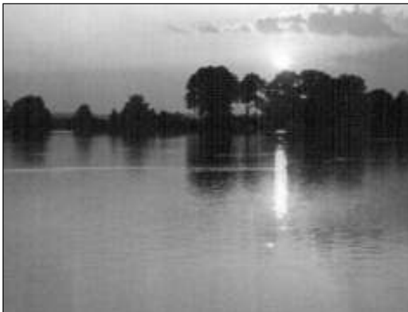
Západ slunce nad třeboňským rybníkem patří k nejkrásnějším zážitkům z dovolené.