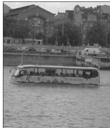
Dunajská lochneska.