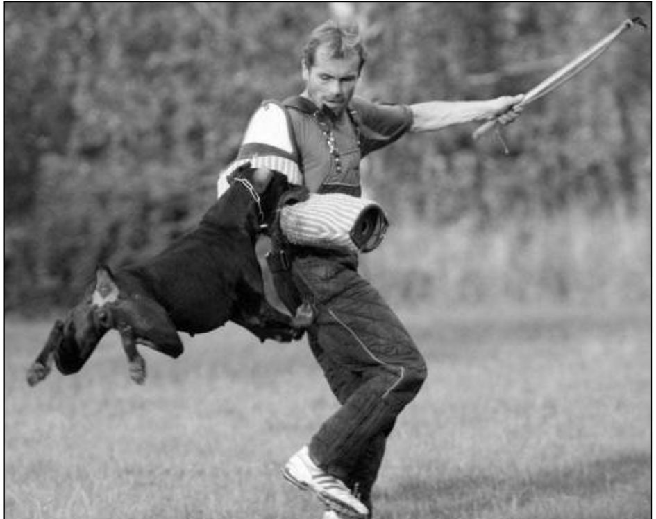
TRHEJ. Letovští kynologové se scházejí na podzimní zkoušky z výkonu.

Jak již bylo napsáno v minulých NN, podařilo se nám uhradit dluh za školné do Řevnic i Dobřichovic. Dále se snažíme hradit dlužné faktury za svoz odpadu, a i to se nám vcelku daří. Musíme si ale uvědomit, že jsou to peníze z rozpočtu obce a ne z poplatků za svoz odpadu, které jsou naprosto nedostačující. Odpad, který vyprodukuje, není možné za vybrané peníze svézt. Starosta Zdravý Třebaně si v minulých NN stěžoval na obrovský nepořádek na sběrných místech. Já se k němu musím připojit. Poslední tři měsíce jsem každé pondělí svázel multikarou odpad z míst, kam se popeláři nedostanou. (Dokončení na straně 8)