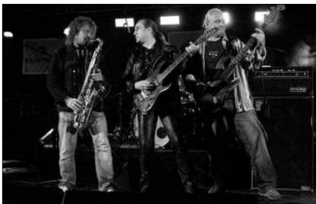
ŽLUTÝ PES. Na samý závěr festivalu Cesty v Řevnicích zahrála skupina Žlutý pes.

Dnem plným živé muziky jsme se mohli protančit s kapelami jako jsou Orkus, Tina Turner Tribute, Cluaran, El Paso, Harry Band, Lety mimo a nakonec Žlutý pes s Ondřejem Hejmou. Na parkovišti u hudební scény jsme měli možnost sledovat představení Váňkova kočovného divadla, vystoupení taneční skupiny Dancing Crackers či divokou a hlučnou Mo-