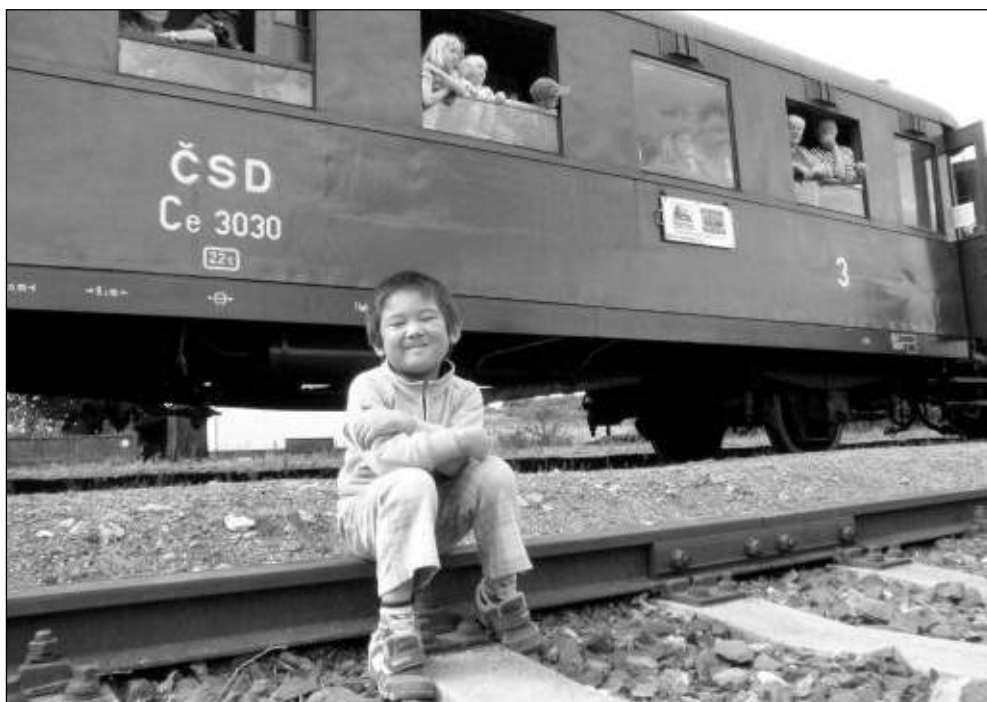
USMĚVAVÝ CESTUJÍCÍ. Jízda parním vlakem se líbila i tomuto malému pasažérovi.