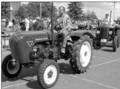
DORAZILY I TRAKTORY. Na setkání starých strojů v Tachlovicích nechyběly traktory.

Letos jsme viděli několik rarit a skvostů - třeba krásnou motorčičku z roku 1916 THE SUN, (fakt rarita!), nastrojeny a nablýs-