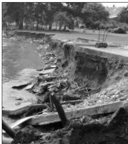
STRŽENÁ NAVIGACE. V Hrádku nad Nisou voda napáchala obrovské škody.

Při povodních v roce 2002 patřily Lety k nejpostiženějším obcím našeho kraje. Při odstraňování škod způsobených vodou v obci pomáhali mimo jiné také hasiči z Liberecka, tedy z kraje, v němž leží právě Hrádek nad Nisou. Miloslav FRÝDL