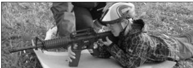
PAL! Na Vižinském trotlíku se i střílelo.