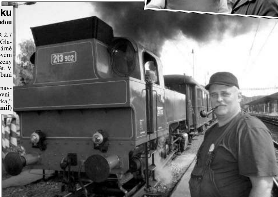
JELA PÁRA. Historická vlaková souprava projela první zářijovou sobotu krajem kolem řeky Berounky a pod brdskými Hřebenými. O romantickou jízdu byl velký zájem. (Viz strana 3)

Odhalení platinové desky na rodném domě v Halvíčkově Brodě se za osobní účasti Landovského, který žije na Brdech, v Kytíně, konalo 10. září. Na desce je Landovský zachycen ve třech podobách - tak, jak vypadal ve filmech Utrpení mladého Boháčka a Černí baroni i tak, jak vypadá nyní. (pef)