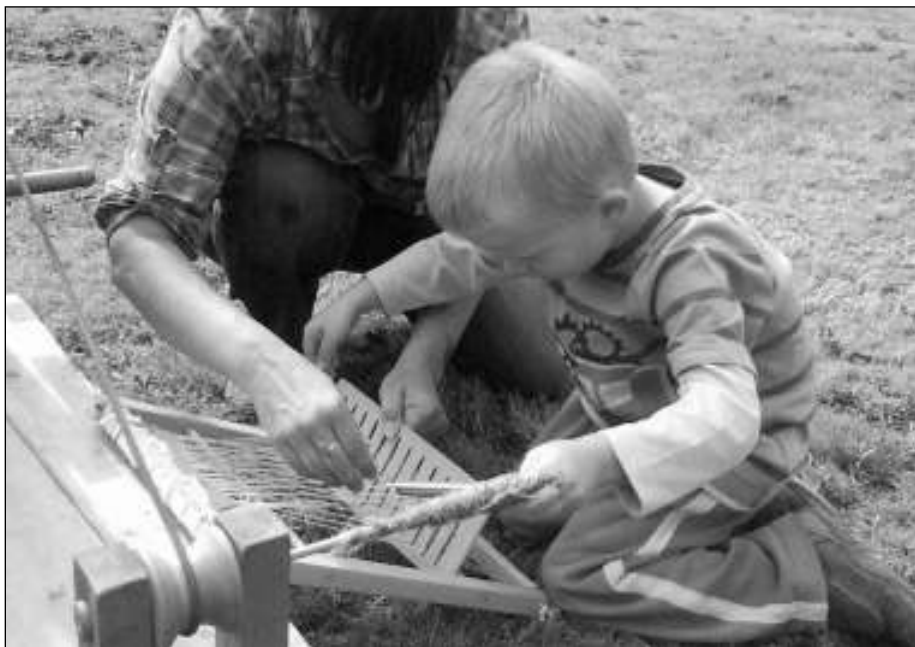
Malí i velcí si ve Všeradicích mohli vyzkoušet řemesla prvních zemědělců.