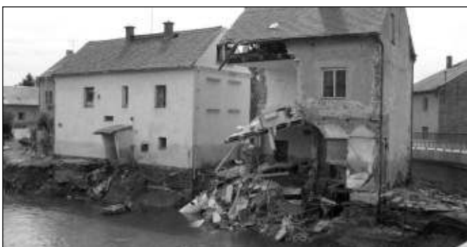
ZNIČENÝ DŮM. Jeden z domů, který zasáhla povodeň.