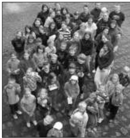
JSME TU VŠICHNI! Notičky na soustředění v Krkonoších.

Příští léto se Notičky na Tetřeví boudy vrátí. Snad tedy Sněžka vyjde napřed. Jan FLEMR, Řevnice