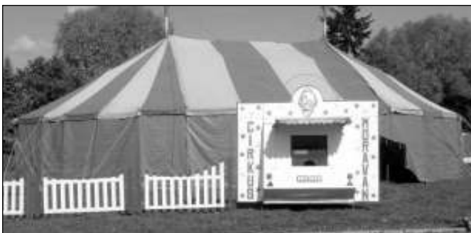
PŘIJEL CIRKUS. Všeradice v neděli 19. září navštívil cirkus Moravan. Představení, ve kterém účinkovali klauni, cvičení psi a kozy, navštívilo asi sedmdesát diváků. (bos)