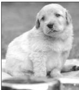
POJEDE SE DO DUBAJE? O štěně z letovské chovné stanice má zájem inženýr z Dubaje.

Šikovný manžel dal kromě webových stránek Rodinného centra Letánek ve svém volném čase dohromady i exklusivně vypadající stránky naší chovatelské stanice www.czechblackkrock.cz. (Rozumějte, bydlíme nad Černou skálou, chovatelskou stanici schvaluje mezinárodní výbor a ze