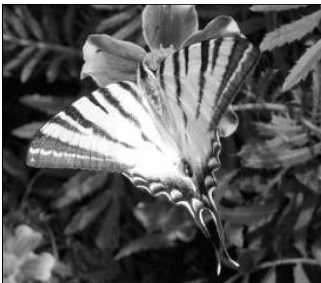
VÍTĚZNÝ SNÍMEK. Host řevnické zahrady.

Vítězný snímek otiskujeme. Místo oceněných básní, které jsou dlouhé a jednou už jsme je otiskli, zveřejňujeme dílo ze zásilky Řevničana Jindry Nováka, které dosud v NN nevyšlo. Výhercům gratuluji, ceny si mohou vyzvednout po domluvě (257 720