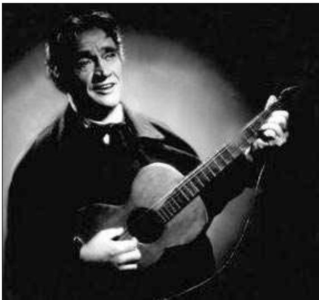
LEGENDÁRNÍ PÍSNÍČKÁŘ. Karel Hašler s kytarou.

Hašler se začal živit svými písněmi a kuplety a v roce 1919 si otevřel vlastní hudební vydavatelství.