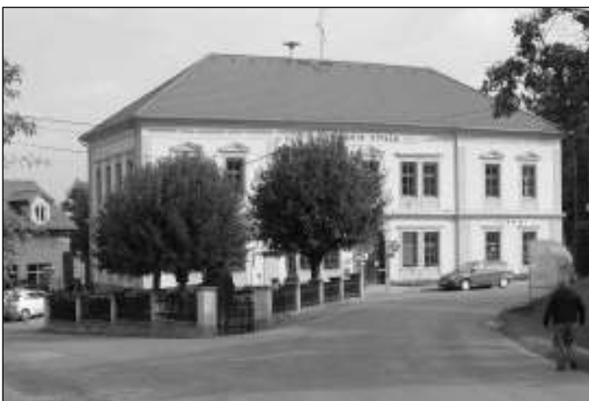
SVINAŘE. Pěkně rekonstruovaná budova obecního úřadu dominuje návesi ve Svinařích.

Zdejší náves je na první pohled udržovaná. Uprostřed stojí mezi stromy pomník padlým ve světových válkách, schovaný za plotem. Na horní konci pak můžeme vidět kapli sv. Václava, která byla postavena v roce 1901 podle plánu stavitele An-