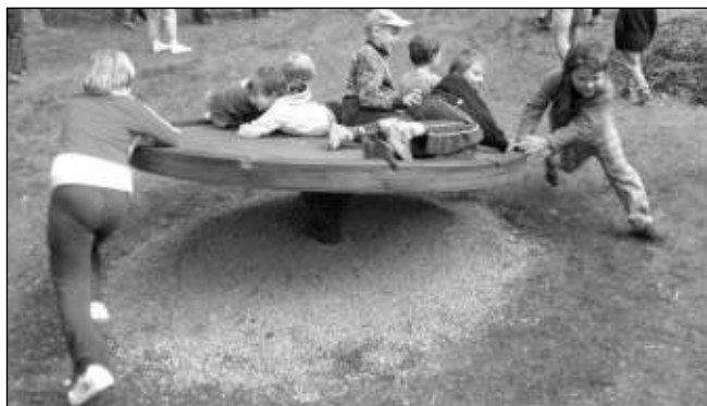
A JEDEM! Děti se při slavnostním otevření hřiště v Řevnicích jaksepatří vyřádily.

Od té doby je na hřišti každý den spousta dětí. Jsme rádi, že se jim tam líbí a doufáme, že tomu tak bude hodně dlouho. Proto prosíme maminky a tatínky, když uvidí, že někdo zařízení hřiště ničí, aby neváhal vandaly vykázat do patřičných mezí. Nyní se o provoz a údržbu hřiště stará město Řevnice, potažmo Ekos. Tam je třeba nahlásit, pokud by byl