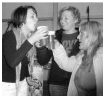
A JEDEM! Čtvrtý ročník černošického Oktoberfestu se konal 25. a 26. září. V obřím stanu na náměstí v Mokropsch mohli návštěvníci ochutnat několik druhů piv nebo změřit síly v pivařských soutěžích. Text a foto NN M. FRÝDL

Pro návštěvníky připravili netradiční »sranda« soutěž v požárním sportu, ukázkou techniky a zásahu u hořícího vozidla. Přítomna byla i policie, která předvedla měření radarem či zásah psovoda při zadržení darebáka, nechyběla dopravní soutěž. Pro děti byl připraven nafukovací skákací hrad a soutěže, o které se postaral dětský Domeček Hořovice. Všichni malí návštěvníci obdrželi dárky a občerstvení zdarma. Kvůli nepříznivému počasí však musel být odpolední program pro děti trochu pozměněn - plánované opékáním špekáčků se nakonec nekonalo. (pef)