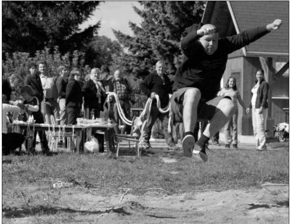
TO BUDE DÁLKA. Skok do dálky na Letánské olympiádě s dětmi vyzkoušeli i dospělí.

Vážení čtenáři! Nastal podzim a volby jsou již opravdu za dveřmi. Všichni bilancují a hodnotí uplynulé čtyři roky. Já jsem přesvědčen, že se toho v naší obci, v Letech, podařilo dost. Jsou tady věci, které jsme ještě nezrealizovali a které jsme museli odložit. Na ty se bude muset zaměřit nové zastupitelstvo. Všechny chci jen poprosit, ať jdou k volbám. Ať je výsledek voleb opravdu volbou většiny. Věřím, že nově zvolená zastupitelstva budou pokračovat v započaté práci svých předchůdců. Že všechno, co se dosud udělalo, nebude jen špatné, protože jsem přesvědčen, že náš region se stále mění k lepšímu. Jsem starostou dvanáct let a s kritikou se setkávám poměrně často. Kritizovat umíme všichni dobře. Většinou ti, co kritizují, nejsou ochotni toho pro ostatní mnoho udělat. A někoho nebo něco pochválit, to je opravdu velká výjimka. V minulém volebním období bylo v našem regionu dokončeno spousta projektů a akcí, které si pochvalu zasloužily. Věřte, že pro každého starostu, zastupitele, projektanta, pořadatele nebo trenéra je i malá pochvala impulsem do další práce. Rozhlížejme se okolo sebe, posuzujme, kritizujme, ale i trochu chvalme - všechno není jen špatné. Myslím, že se nám okolo Berounky žije docela dobře. Krásný podzim přeje Jiří HUDEČEK , starosta obce Lety