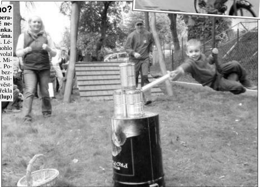
UŽ SI HRAJÍ. Krásné dětské hřiště bylo slavnostně otevřeno v Řevnicích. (Viz str. 11)