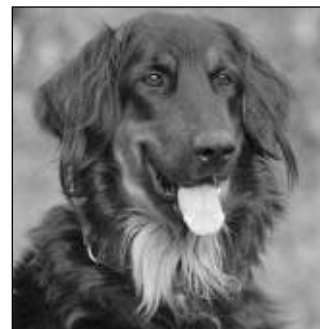
PSÍ MÁMA. Maminka letovských štěňátek, z nichž jedno málem našlo novou domov ve Spojených Arabských Emirátech.