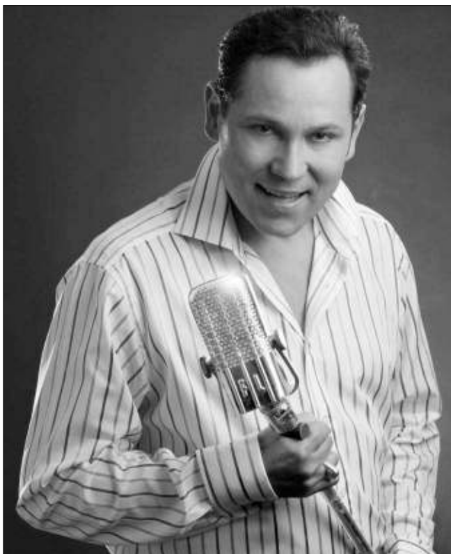
HVĚZDA. Pavel Vítek se těší, až vyrazí za svým publikem.

Komplet bude pokřtěn 3. listopadu na koncertě v pražském divadle Hybernia. Už víte, kdo vám, resp. Hitům mého srdce píše za kmotra?