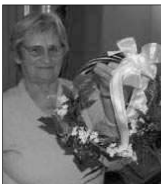
MŮJ VÝROBEK. Letovští senioři se scházejí ke koncertům, cvičení i tvoření zajímavých věcí.