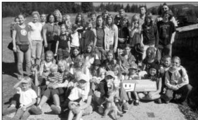
V KRKONOŠÍCH. Děti z hořovického Domečku letos v srpnu absolvovaly letní tábor ve Špindlerově Mlýně.