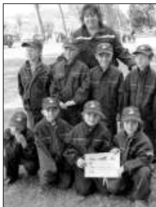
Mladší žáci na Karlštejnském poháru.