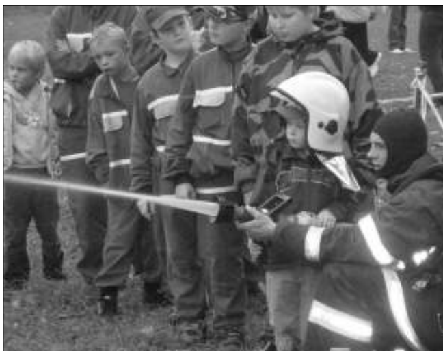
MALÍ HASIČI. Práci s hasičskou technikou si při liteňském Loučení s létem vyzkoušely také děti.

Svůj vůz a vybavení zde předvedla i záchranná služba z Revnic, která si i přes velké pracovní vytížení a neustálou pohotovost našla čas. Dále si místní hasiči připravili netradiční