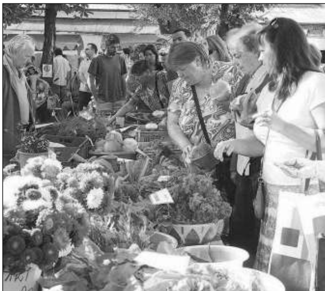
NÁVAL. O zboží, které je k máni na Černošických farmářských trzích, je velký zájem.

Stánků bylo tentokrát o něco méně, ale jak samy organizátorky dodávají, sezóna ještě nekončí. „V poslední době nám kvůli špatnému počasí ně-