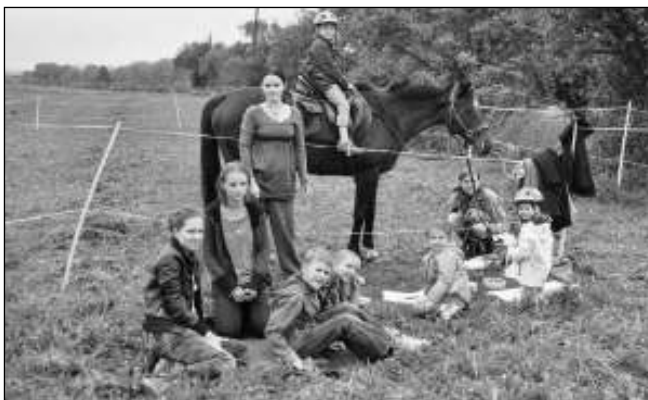
NA POLI. Pastelky v sedle na bělečském poli.

První podzimní víkend, přichystala řevnická výtvarnice Irena Staňková pro děti zajímavý zážitek - Pastelky v sedle. Kdo dorazil do Bělče, kde se akce konala, měl možnost nakreslit obrázek podle živé předlohy kobyly Gazely. Ta jednak stála modelem, jednak malé výtvarníky povozila. Ti, kteří se nebáli, mohli kreslit přímo z jejího hřbetu. Výtvarně odpoledne se konalo v nově vznikající stáji Zuzky Pavlové, jež se chystá nabízet dětským i dospělým zájemcům, kteří by se chtěli naučit přirozené komunikaci s koňmi, individuální hodiny. V tomto případě se nejedná o klasické ježdění v jízdárně, ale spíše o pochopení základních principů péče o tato zvířata a dorozumívání se s nimi. Známe přísloví říká: Co Čech to mu-