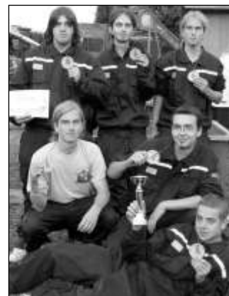
Stříbrný tým na Hasičských hrátkách v Drahlovicích.