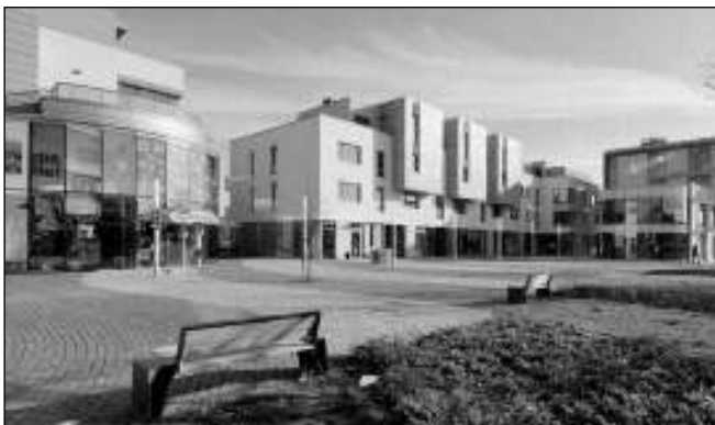
ČERNOŠICE. Moderní náměstí na černošické Vráži.

Náměstí na Vráži je nejnovější částí Černošic, bylo postaveno nedávno. Podle mnohých je to pěkné místo, kde se příjemně prochází i nakupuje. Najdeme tu mnoho obchodů, restaurací, v plánu je pořádání trhů. Centrum bylo navrženo na titul Stavba roku 2010. Lucie PALÍČKOVÁ