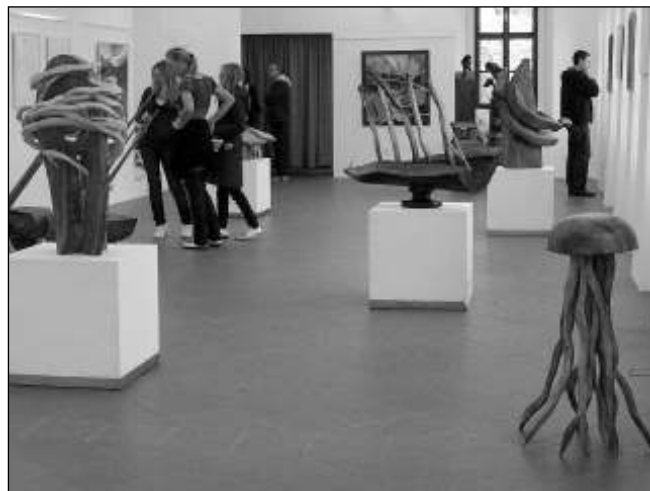
SOCHY A OBRAZY. Unikátní dřevěné sochy a obrazy jsou k vidění na poslední letošní výstavě v klášteře Skalka nad Mniškem.

Expozice potrvá do 31. října a je otevřena v sobotu, neděli a svátek od 10 do 17 hodin, ve všední dny kromě pondělí na požádání u správce barokního areálu Skalka. Dobrovolné vstupné z výstavy je určeno na opravy areálu Skalka. Jarmila BALKOVÁ, Mnišek pod Brdy