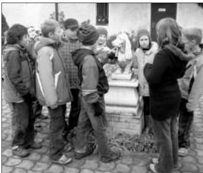
TENHLE JE KAMENNÝ! Na návštěvě v psím hotelu zadnotřebaňští školáci viděli psy živé i vytesané z kamene.

Směli jsme se podívat také do hotelových kotců pro ubytované psy. Každý má teplou dečku, hračku, dvakrát až třikrát denně je venčen,