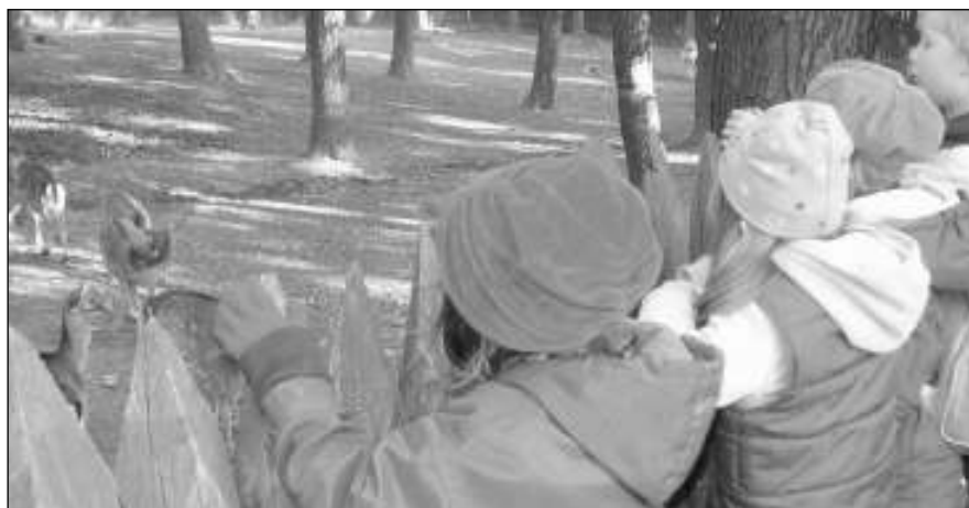
V ZOO. Řevničtí prvňáci v chuchelské mini ZOO obdivovali daňky.

Minulý týden prvňáci pro změnu vyjeli za kulturou, v Muzeu hlavního města Prahy byla přednáška Jak se žije v Mongolsku. „Mám tři pohledy a na jednom je mongolsky napsané moje jméno,“ chlubil se u vlaku Vojta. Lucie PALÍČKOVÁ