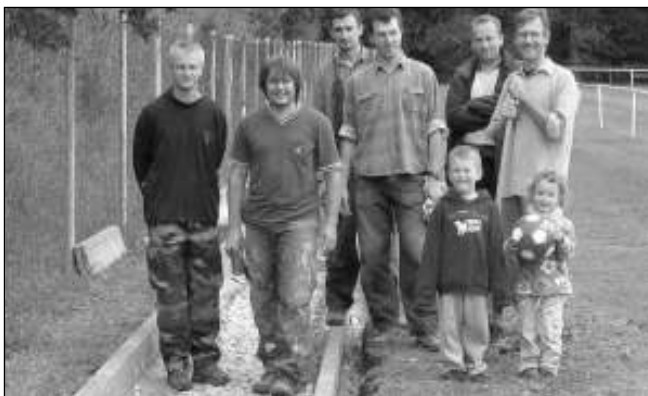
PRACANTI. Liteňští tatínkové na brigádě.

Jak jsme již krátce informovali minule, na liteňském hřišti se konala brigáda. Byly přibetonovány obrubníky k doskočisti a zčásti se podařilo vyčistit okolí sokolovny i fotbalového hřiště od křoví i odpadků. Příjemným zjištěním bylo, že se dobrovolně zapojily i děti, které sbíraly plastové lahve, obaly od čokolád a sušenek, odnášely vykáčené lehčí větve a některé i hrabaly. Při práci u sokolovny se zjistilo, že jedna ze vzrostlých bříz je zetlelá. Z důvodu bezpečnosti osob, které se tu pohybují, a vzhledem k hrozícímu pádu na silnici byla poražena. Nyní se řeší, zda se dřevo využije na výrobu ekologického tepla v moderní měňanské kotelně, nebo zda rodiče uspořádají v Litni čarodějnice.