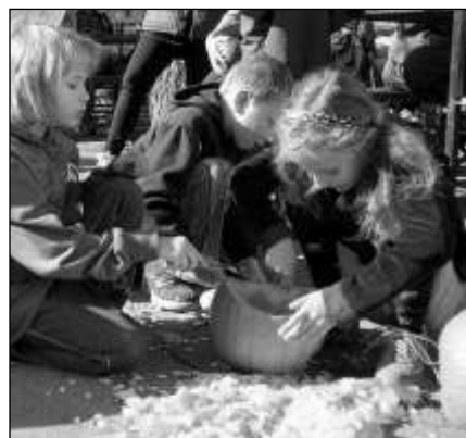
S dýněmi si »vyhráje« nejen dospělí. Na Havelském posvícení v Zadní Třebani se při jejich dlabání vyřádily děti.