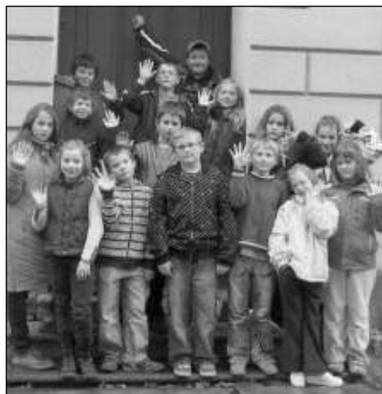
U MUZEA. Liteňští školáci v místního Muzea Svatopluka Čecha.

Poté jsme pokračovali Litní k zámku a Čechovně. Po cestě jsme ve skupinách odpovídali na otázky paní učitelky. Jestlipak byste věděli, kde byla v Litni dříve kovárna, kadeřnictví a holičství, pekárna, hostinec, synagoga, pivovar nebo lihovar? Obyvatelům Litně již několik let není umožněn přístup k zámku, Čechovně a zámeckému parku. Je to velká škoda, neboť historie Litně je bohatá a