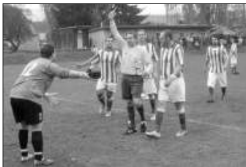
KARTA A - PENALTA. Dramatický průběh mělo utkání letovských fotbalistů s Unionem Cerhovice. Gólman hostů dostal červenou kartu za nastřelení sudího (vlevo), Rosenkranz dvakrát skóroval z penalty.

První poločas byl vyrovnaný, domácí se ujali vedení ve 4. minutě Turkem po rychlé kombinaci. Ve 12. minutě nedůrazný Janouš nechal proniknout útočníka do úniku a bylo vyrovnáno. Hosté strhli vedení na svou stranu v 42. minutě, kdy rohový kop skončil po hrubce Štěpána v brance. O výsledku rozhodla 47. minuta, kdy hosté přidali další gól. Domáci zůstali jak zmrazení a hosté střelili další branky. Lety zkorigovaly skóre Rosenkranzem. Jiří KÁRNÍK