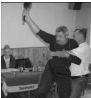
AKČNÍ UTOPENCI. Ve hře Dá si někdo utopence? nechybějí ani akční scény.

Osov - Někde v nebi, přesněji řečeno u Svatopetrské brány, stojí malá hospůdka. Na tom by nebylo nic zvláštního - nebe je obrazem pozemského života a takovýto hospůdek a krčem je tam rozeseť nepočítaně. Avšak v této hospůdce se setkávají významné, méně významné ba i docela nevýznamné osobnosti české historie. Posedávají u piva, vedou řeči jak to tak v hospůdkách bývá a hledí dolů, což je to ten český národ bez nich zase vyvádí. A také si dávají vyhlášené utopence pana hostinského... Zajímá vás, kdo všechno do této hospůdky chodí? A jakápak převratná událost se právě děje dole na zemi? Pak se přijďte podívat na původní komedii se zpěvy Dá si někdo u-