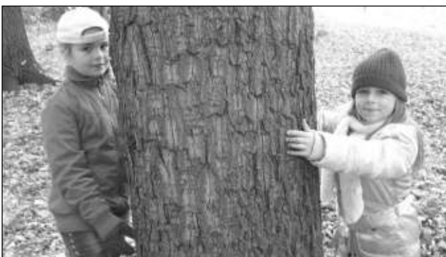
SÍLA OD STROMŮ. Osovští školáci při procházce v lese objímali stromy a čerpali jejich sílu.