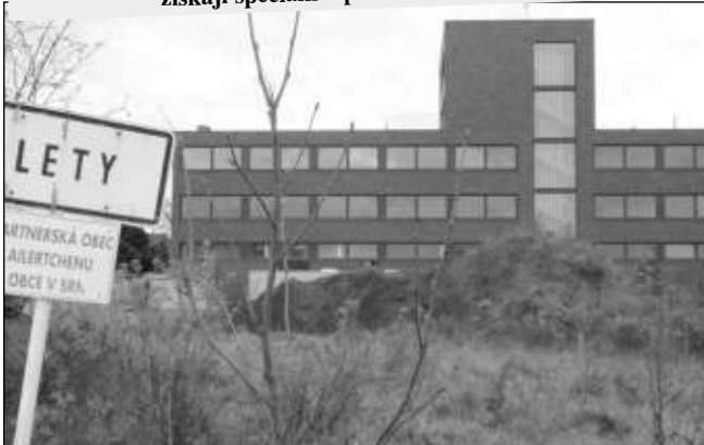
UŽ BRZY. Letovský pivovar je před otevřením.

Víte, proč se letovský pivovar jmenuje MMX? Znáte-li odpověď na tuto otázku, napište nám na adresu redakce (Třeboňská 96, 267 29 Zadní Třeboň, případně frydl@dobnet.cz). Tři nejrychlejší luštitelé získají speciální »pivařské« ceny. (mif)