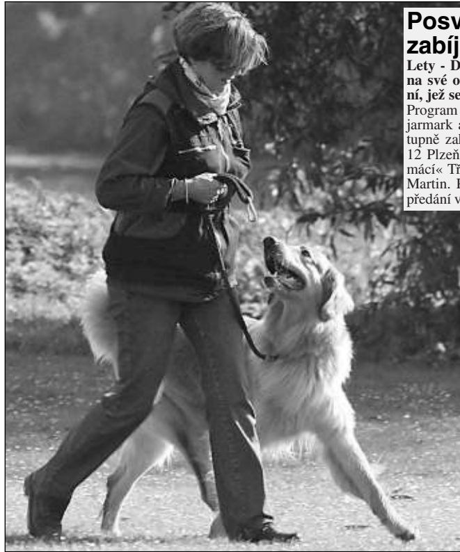
K NOZE! Na letovském cvičáku je živo.