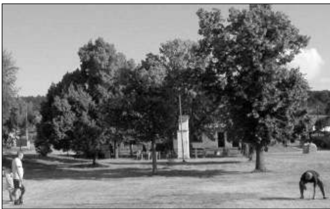
LEČ. Návěs v Leči s dominantou kapličkou posvěcené V. B. Třebízským. V pozadí budova bývalé prodejny.

Hospoda U Povolných byla zrušena v 50. letech - jako trest za neúčast Lečských v JZD. Začátkem 60. let mezi ní a kapličkou postavili místní za podpory liteňského MNV prodejnu a společenskou místnost. Začátkem 21. století se zde scházeli lidé na Letních slavnostech Leče, Vodnickém loučení s létem a nohejbalových turnajích. Dnes je návěs téměř neudržovaná, mnohé památné lípy vzaly za své, na jižní straně návsi je málo využívané nohejbalové hřiště ze 70. let. Kaplička i bývalá prodejny volají po opravě, ale... nejsou lidi a peníze. Josef KOZÁK