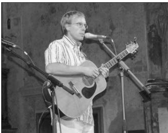
LITEVSKÝ GALAKONCERT. Autor článku na závěrečném gala koncertu v kostele sv. Kateřiny ve Vilniusu.