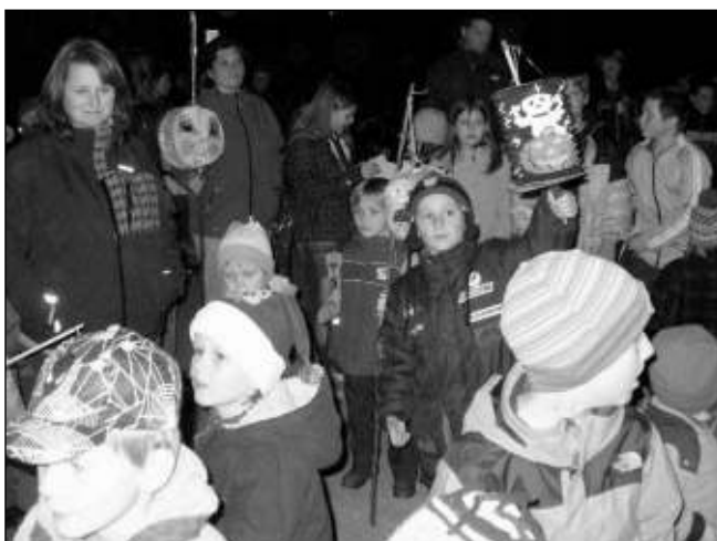
ZA SKŘÍTKEM. Desítky dětí i dospělých se v Zadní Třebaně s lampiony i dalšími světýlky vydaly za skřítkem Panuškou.