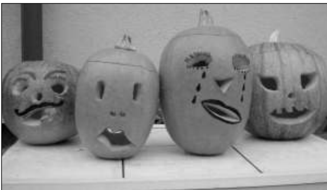
DÝŇOVÁ STRAŠIDLA. Americký svátek Halloween si už nadobro získal místo v našich podzimních zvycích. Takoveto nápadité dýňové hlavy můžete potkat procházkou v Zadní Třebani Pod Chybou.

Postup: Neoloupanou dýňi zbavte semínek, nakrájejte na větší kusy a dejte ji do pekáčku vytřeného rostlinným olejem. Pečte ji v předehřáté troubě při teplotě 160 st. Celsia asi 70 minut. Poté nechte dýňi vychlad-