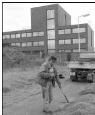
PIVOVAR. Letovský pivovar se chystá na kolaudaci.