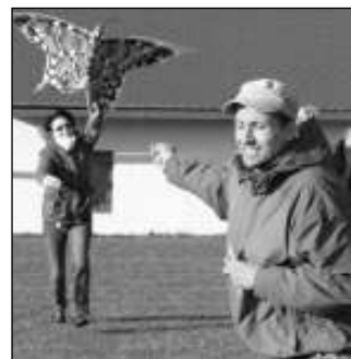
PŘECI VZLÉTLI. I když o vižinské drakiádě příliš nefoukalo, někteří draci vzlétli.

ká pracovní dílna, kde se vyrábělo a za odměnu se rozdávaly drobné odměny. Večer se šla stovka lidí na