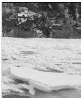
POD KAZÍNEM. Ledové kry zatarasily Berounku.

Poslední den roku 2010 zvedl nahromaděný led hladinu řeky o metr. V obci začal »úřadovat« krizový štáb, padesát lidí se chystalo na evakuaci. Na Nový rok v noci se kry pohnuly. „Voda si prorazila cestu a hladina klesla,“ uvedla mluvčí středočeských hasičů Lenka Kostková.