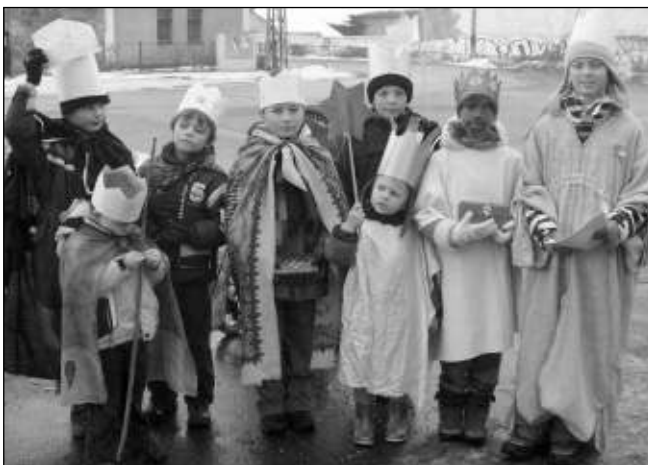
TŘEBANŠTÍ »TŘI« KRÁLOVÉ. Hned několik králů vyrazilo druhou lednovou neděli na obchůzku Zadní Třebaní. Foto NN L. PALÍČKOVÁ

Koledující skupinka obešla několik desítek domů. Jejich obyvatelé otvírali a přispívali do sbírky (vybralo se několik tisíc korun), mnozí nabídli i něco na zahřátí a sladkosti dětem. Také počasí se umoudřilo, nemrzlo a hlavně nepřešlo jako v předchozích dnech. Nepovedlo se jedině - obejít celou ves. Malí králové i muzikanti postupně odcházeli, setmělo se a za-