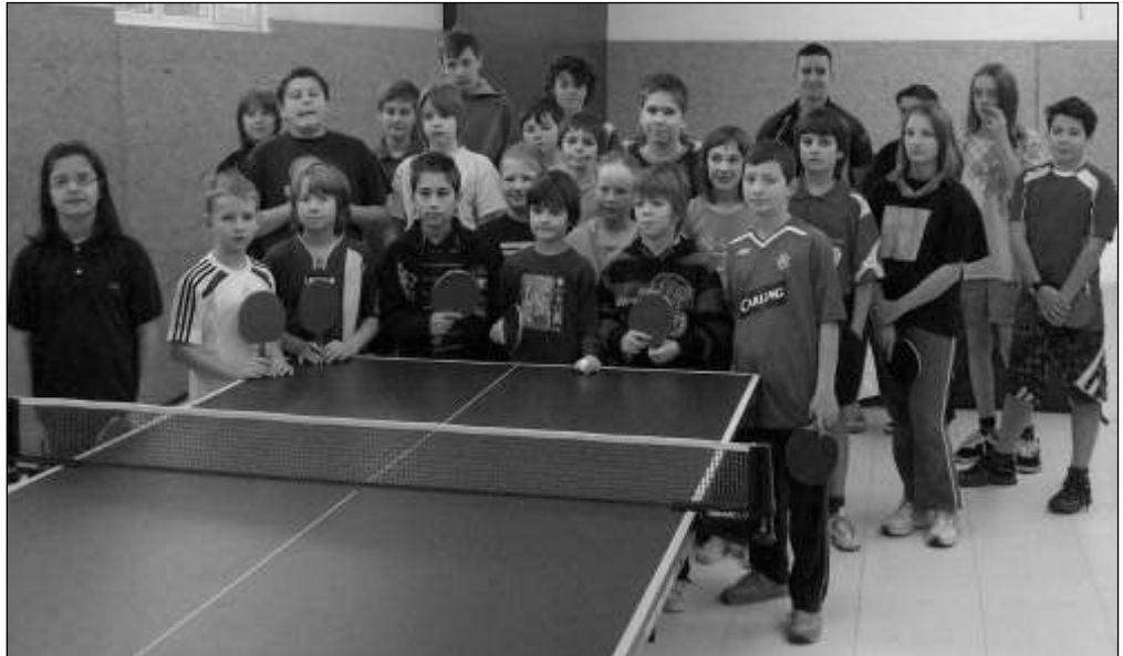
MALÍ TENISTÉ. Účastníci žákovského a dorosteneckého turnaje ve stolním tenisu.