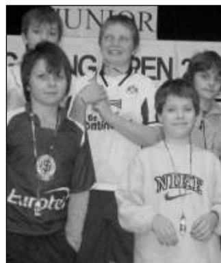
NEJMladší. Část nejmladších účastníků zadno-třebského turnaje ve stolním tenise.

Zadní Třebaň důstojně reprezentovali především sourozenci Martin a Jakub Malý, Matěj Furst, Tomáš Břížďala, Daniel Sedláček a Lukáš Petřík. Na závěr obdržel každý malý vánoční balíček. Jaroslava ZAVADILOVÁ, KČT Zadní Třebaň