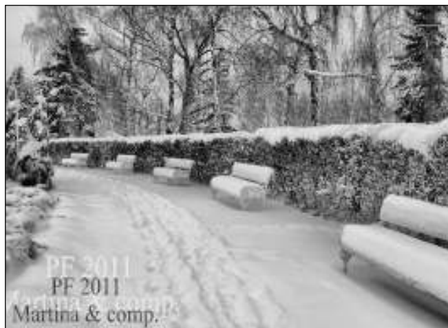
DOSTANE CENU. PF, které vyhrálo soutěž.