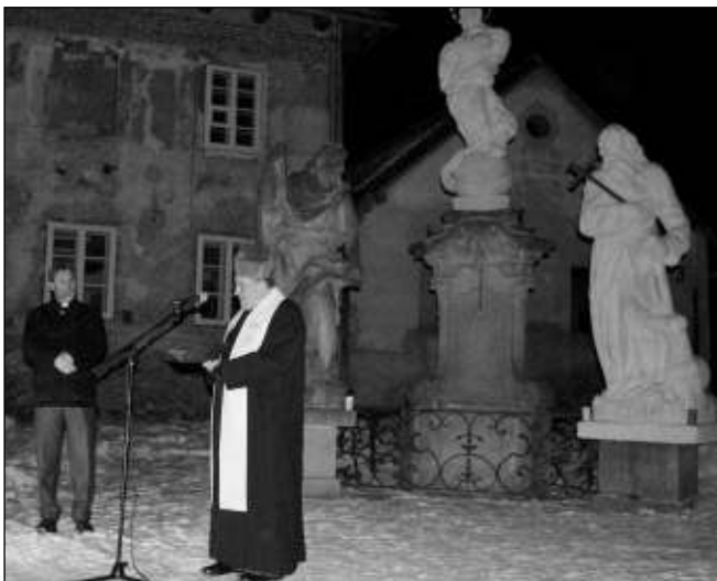
SILVESTROVSKÁ NOC. Obnoveným sochám ve Svatém Janě pod Skalou u silvestrovské noci poželhal arcibiskup Dominik Duka.