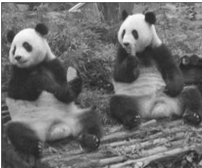
RUŠIT SE NEDALY. Pandy, které Jan Schwippel viděl v parku Sedmi hvězd, se při svačině z klidu vyvést nenechaly.

V ráji malířů, malebném Kuejlinu (má »pouze« sedm set tisíc obyvatel a nejvýznamnějším odvětvím je právě díky jeho úchvatným přírodním scenériím podél řeky Li turismus, pak výroba piva a kondomů – díky kaučukovníku) nás provázela zamračená obloha. Průvodce tvrdil, že máme »neobvyklé štěstí« - vidíme to, co si malíři ke zdejší krajině musí leckdy přidat - kopce »vystupují z