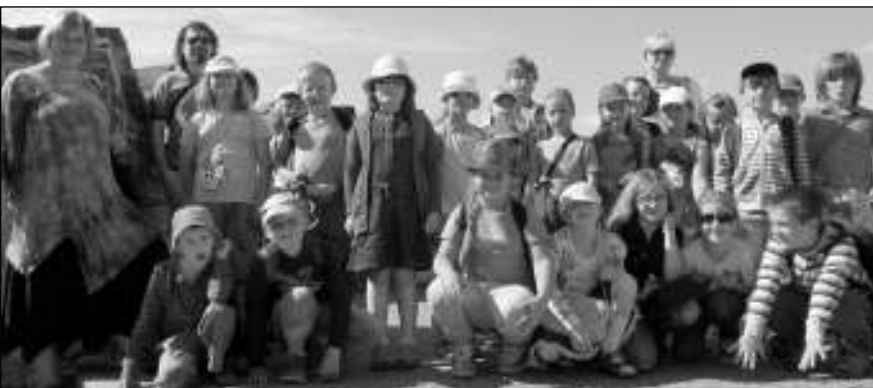
NA HRADĚ. Zadnotřebeňští školáci na Pražském hradě.