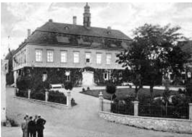
Liteňský zámek na přelomu 20. a 30. let 20. století. Pohlednice putovala vlakem 24. června 1930 z Litně do pražských Hradčan.