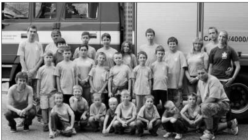
U KOLEGŮ. Výprava mladých řevnických hasičů na výletě u »kolegů« v Tanvaldu.

Po první noci strávené v Kořenově jsme se ráno nasnídali a vydali se vzdělávat do muzea ozubnicové dráhy. Následoval oběd a po poledním klidu jsme vyběhli na branný závod, kde jsme byli prozkoušeni z hasičských a topografických značek, zdravotvědy a šikovnosti. Za odměnu jsme mohli rozpálená těla zchladit v řece Jizeře. V pondělí jsme se vydali do Jablonce nad Nisou na přírodní koupaliště. U vody jsme se všichni jaksepatří vyřádili. Kdyby nepřišla bouřka, byli bychom tam až do večera.