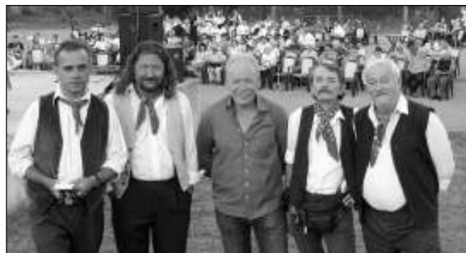
.... a v chorvatských Dolanech.