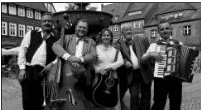
VE SVĚTĚ. Třehusk na náměstí v německém Goslaru...