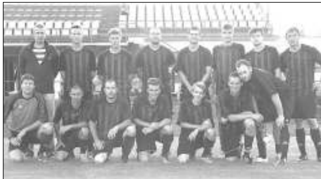
POSLEDNÍ MISTRÁK. A mužstvo Dobřichovic před posledním jarním mistrovským utkáním v Rožmitále pod Třemšínem.