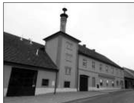
PIVOVAR. Krásně, s citem zrekonstruovaný pivovar v Hostomicích.

Plánů je spousta. V první řadě bych chtěl zprovoznit letní posezení ve dvoře. Plánujeme nocležnu pro pocestné, pěší i cyklisty, a ve vzdálenější budoucnosti nás čeká rekonstrukce patra pivovaru, kde je nádherný, veliký sál a sládkovský byt. A nad tím vším je ještě půda, která si říká o instalaci pokojků... Miloslav FRÝDL