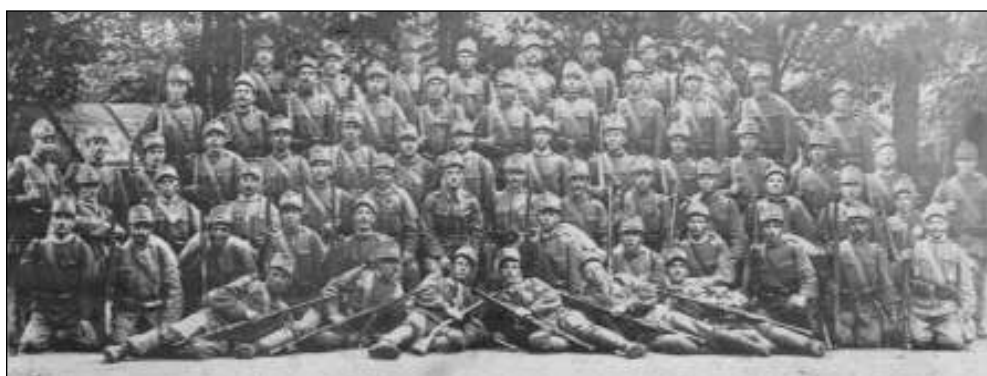
Z BEROUNA. Příslušníci 88. pěšího pluku z Berouna před odjezdem na ruskou frontu.

Jak to v životě bývá, plány jsou jedna věc, ale realita se ubírá jinými cestami. C. a k. armáda pod velením nahoukaného a sebestředného polního zbrojmistra Potioroka dostala v