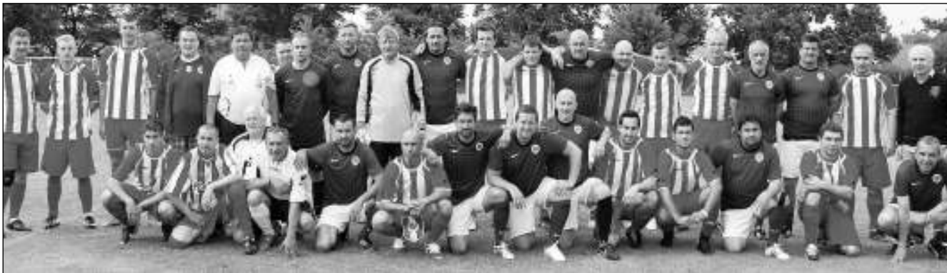
SPOLEČNĚ SE SPARTOU. Společné foto fotbalistů FC Liteň a Staré gardy Sparty Praha.

Aktuální zprávy z Litně, Leče, Bělče, Vlenců a okolí 7/2014 (32)