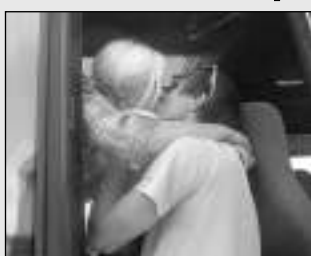
LOUČENÍ. Dojemné scény byly k vidění při odjezdu liténských dětí na tábor Zálesák.

Příměstský tábor pod podobným názvem Zálesáci se konal uplynulý týden v hlásnotřebském Hlásku. Děti se naučily spoustu užitečných věcí - jak se chovat v přírodě, jak rozdělat oheň, poznávaly rostliny a zvířata, učily se orientovat v neznámém prostředí s mapou. Dostaly užitečné ra-