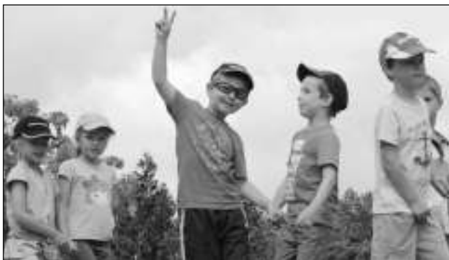
DĚTI NA NÁVŠTĚVĚ. Na ukázkou výcviku psů se k letovským kynologům přišly podívat děti z Letů i Řevnic.

Spoustu akcí mají v uplynulém období za sebou letovští kynologové. V první polovině roku jsme uspořádali troje zkoušky z výkonu. Začátkem května se konal již 15. ročník závodu jednotlivců. Zúčastnilo se ho 22 dvojic, které závodily ve čtyřech kategoriích. Počasí nám moc nepřálo, byla zima a trochu i deštivo. Psům to sice nevadilo, naopak, ti jsou aktivnější, když je chladněji. Zato my jsme byli mokří jako myši a pěkně zmrzlí, hlavně ze stop, které byly tentokrát na Mořince u menhiru. Pěkně to tam foukalo... Kromě počasí se ale závod povedl, pejskaři jsou na mokro zvyklí. Ti nejlepší si odvezli spoustu cen a trofejí a ani ti, co nevyhráli, nešli domů s prázdnou. Díky patří středním sponzorům, tak jako vždycky. Koncem června jsme uspořádali ukázkou výcviku pro děti z mateřských škol. Na hrázi u cvičáku bylo dětí jako smeti, přišly se na nás podívat děti z letovské a řevnické školky i