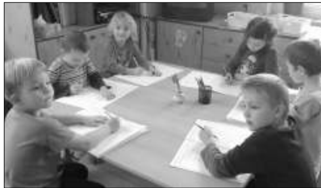
PŘEDŠKOLÁCI. Děti, které se v zadnotřebeňském mateřince, chystají na přestup do »velké« školy.

nejvíce usnadnit přechod do školy, aby byly připravené a na školu se těšily. Pavlína NEPRAŠOVÁ, MŠ Zadní Třebeň