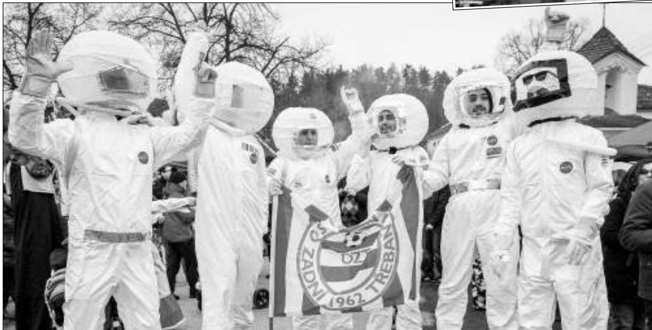
VÍTĚZOVÉ. Nejlepší maska 26. Poberounského masopustu, který se konal 14. 2. v Zadní Třebani: kosmonauti z CHASA. (Viz str. 11)