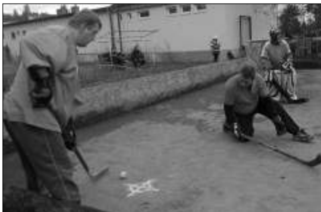
BLÍŽÍ SE FINÁLE. Řevnický Bandy Cup má před sebou poslední kolo základní části, play-off je naplánováno na 28. února.