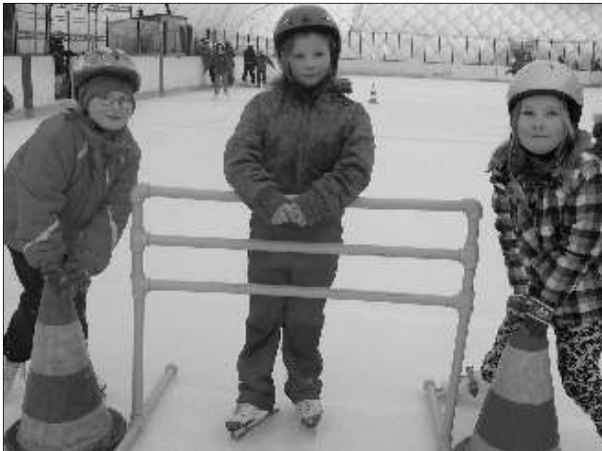
NA LEDĚ. Osovské školáčky na zimním stadionu v Hořovicích.