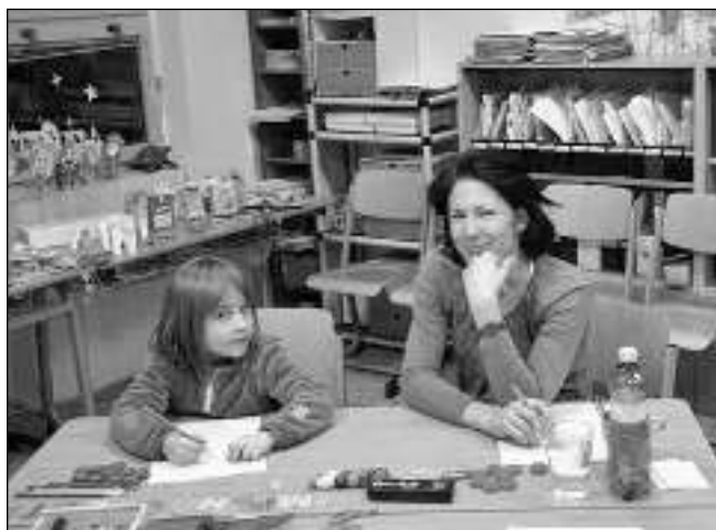
U ZÁPISU. Jedna z řevnických předškoláček u zápisu do první třídy.

Noví adepti vzdělávání měli předvést svoji schopnost se představit, říct, kde bydlí, zazpívat písničku, opakovat verše, předvést jemnou motoriku při navlékání korálků nebo stavbu z kostek podle vzoru. Ukázali nám, že poznají shodné i rozdílné tvary, dokážou zopakovat rytmus slabik i složit z hlásek slovo. Bylo obdivuhodné, jak některé děti i v téměř večerních hodinách zvládly splnit všechny úkoly. Na závěr si vybraly dárek, který pro ně vyrobili jejich starší kamarádi. Děti dělí od ná-