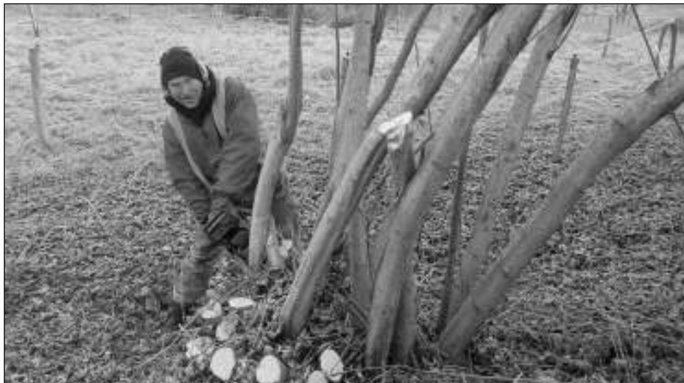
ZIMNÍ ÚKLID. Zaměstnanci městyse Karlštejn čistili v minulých dnech okolí silnice mezi areálem úřadu a řekou Berouňkou. Na louce blíž k mostu by měl časem vzniknout park.

* Zájezd do Divadla Radka Brzobohatého na představení Sodoma Gomora pořádá 10. 3. Městys Karlštejn. Odjezd z centrálního parkoviště je v 17.00, cena včetně dopravy 200 Kč. Akce je určena přednostně obyvatelům Karlštejna, vstupenky si můžete rezervovat i zaplatit na úřadu městyse. Petr RAMPAS