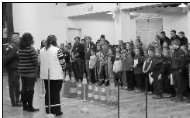
NÁSTUP. Družstva mladých hasičů při slavnostním zahájení Zimních her v Zadní Třebani.