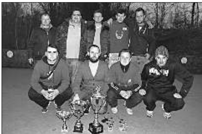
VÍTĚZOVÉ. Vítězové letošního ročníku Revnického Bandy Cupu, družstvo Bája Pic.