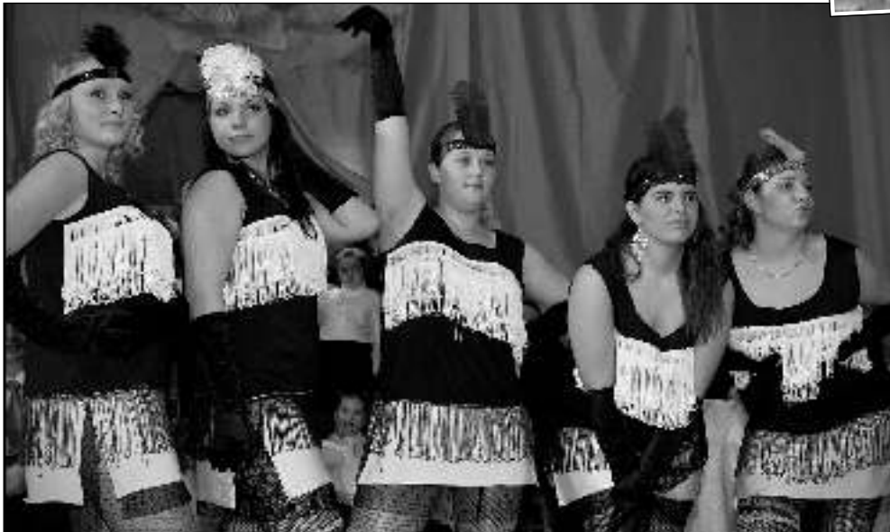
NA PLESE. Členové a členky řevnické taneční skupiny Proměny se na svém sedmém reprezentačním plese, který se konal v pátek 13. února, jakseptatři vyřádili. (Viz strana 4)

Nejvíce peněz na krytí povodňových škod dostane Benešov (6,8 milionu), Lužec nad Vltavou (5,4 milionu), Masojedy (2,6 milionu), Libiš (1,3 milionu) a Nová Ves (milionu). Vědí už Černošičtí, jak s penězi naloží? „Ne, nevíme,“ uvedl starosta města Filip Kořínek. „Máme schodkový rozpočet a spoustu rozjetých akcí. Občas saháme do rozpočtových rezerv, takže oněch čtyři sta tisíc možná »zapojíme« do letošního rozpočtu. Pokud ne, zůstanou na městském účtu a do rozpočtu je zahrneme příští či přes příští rok. Zatím máme větší potřeby v připravených projektech, než je zůstatek na účtu, navíc i úvěrové financování.“ (mif)