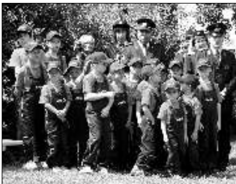
NÁSTUP. Mladí řevniční hasiči na jedné ze svých akcí.

CHCETE-LI SE STÁT MLADÝM HASIČEM A MYSLÍTE TO VÁŽNĚ, MŮŽETE SE PŘIHLÁSIT