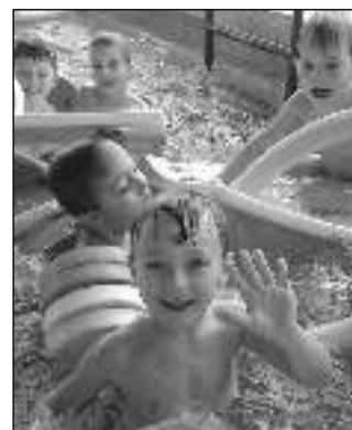
V BAZÉNU. Zadnotřebaňští předškoláci na plavání v Příbrami.

V návaznosti na projektový den má ředitelka další plán. „Ráda bych se s dětmi zúčastnila tradiční literární