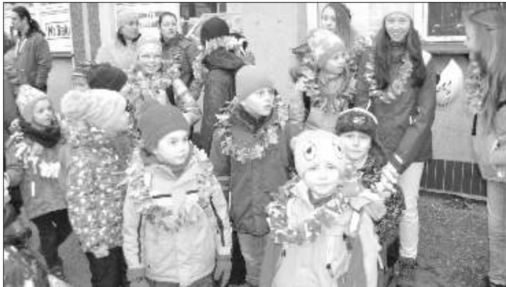
ODJEZD. Děti odjížděly z Litně na hory ozdobené hawajskými květy.