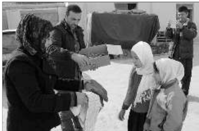
... a afghánské děti při jejich přebírání.