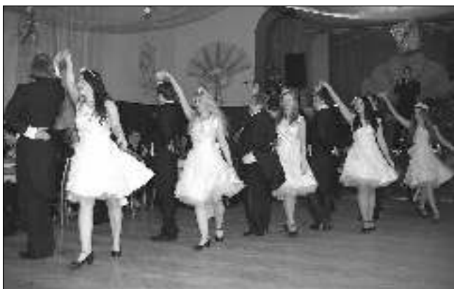
NA PLESE. Jedno z tanečních vystoupení na plesu Proměn.