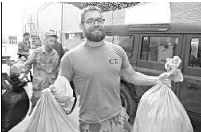
A JE TO TADY. Čeští vojáci při transportu oblečení a bot z Česka...