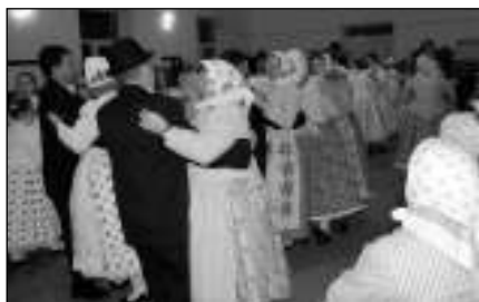
V KOLE. Krajané v rumunském Gerníku na masopustní tancovačce.