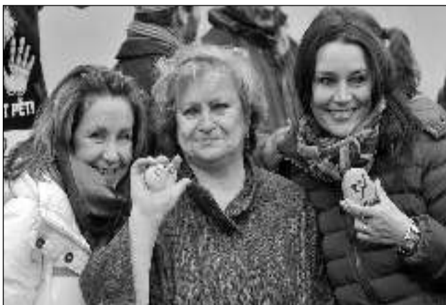
S KAMÍNKY. Patronka černošické haly, světová sportovkyně Věra Čáslavská (uprostřed), se svým základním kamínkem.

„Budoucí sportovní hala pro nás není jen běžnou stavbou, ale hlavně místem, které přinese kvalitní zájem dětem, mládeži a sportovcům, místem, kde se budeme setkávat a kde budeme trávit volný čas,“ uvedl starosta Černošic Filip Kořínek s tím, že slavnostní pokládání základních kamenů se velmi vydařilo. Mělo netradiční formu - každý mohl na kámen, který si přinesl, či který dostal na místě, namalovat nějaký motiv či vzkaz. Kameny byly uloženy do skleněných tubusů, které budou vystaveny v nové hale. „Tuto formu položení základního kamene jsme zvolili proto, abychom poděkovali