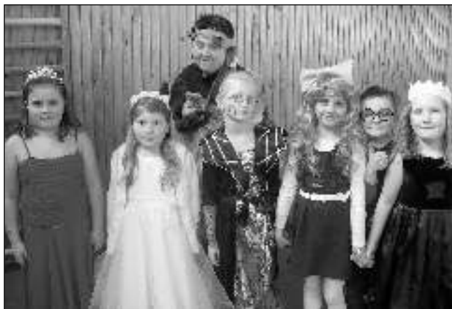
NA KARNEVALE. Osovští školáci na masopustní karneval dorazili v nej-různějších převlecích.

Masopust představoval pro naše předky období hodování a veselí mezi dvěma postními dobami. Během něj se konaly taneční zábavy, zabíjačky i svatby. Děti z Mateřské školy v Osově se v úterý 24. 2. vypravily autobusem na výlet do Čechovy stodoly v Bukové u Příbramě. Tady je uvítal řezník Krkovička, který je provázel masopustními lidovými tradicemi. Všichni si nasadili karnevalové masky a zahráli si na masopustní průvod. Krkovička předvedl, jak se odbývala zabíjačka a co všechno k ní bylo potřeba. Malé cestovatele pak prověřil otázkami, aby zjistil, zda dobře poslouchali. Protože odpovídali správně, odměnil je bonbónem. Pak už se děti přesunuly do dílničky, kde si vyrobily papírovou masku. Caparti odjížděli spokojení a už se těší na další výlet. Eva NÁDVORNIKOVÁ, MŠ Osov