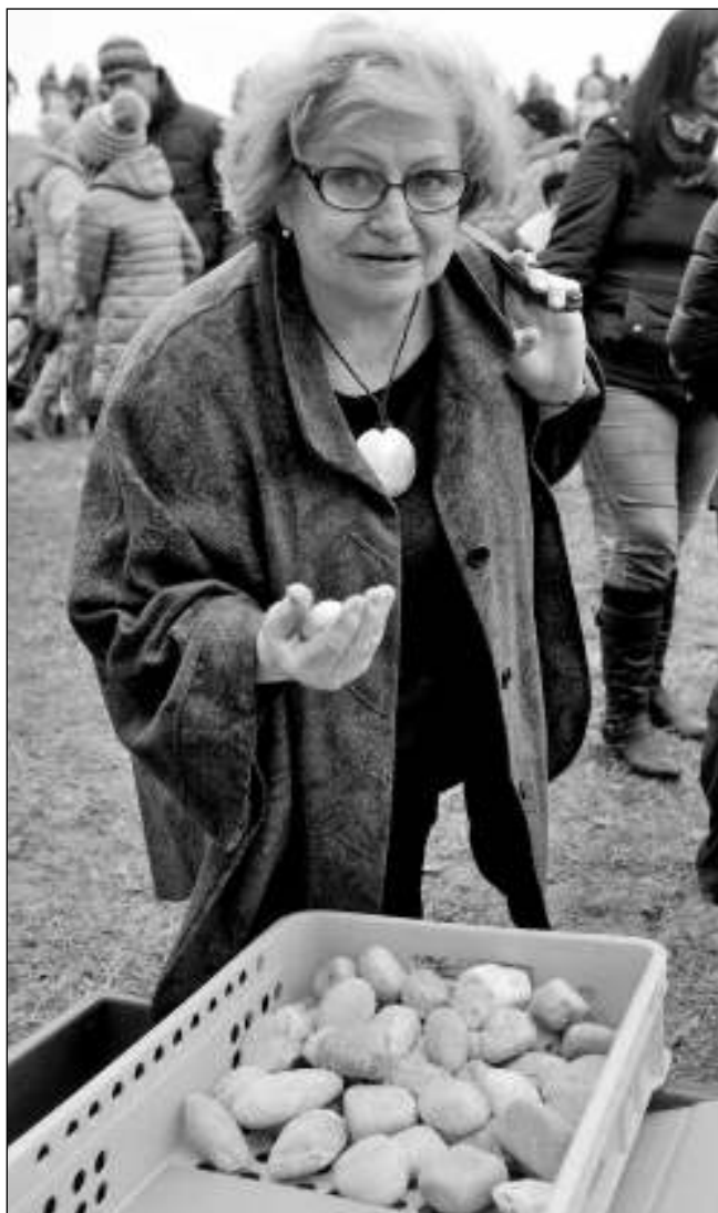
TEN JE MŮJ! Věra Čáslavská vybírá svůj základní kámen.

Kdybyste měla moc soudiček, co byste budoucí hale popřála do vinku? Abý všichni ti, kteří v ní jednou budou sportovat, se cítili dobře a spokojeně. Aby to tu každého bavilo a