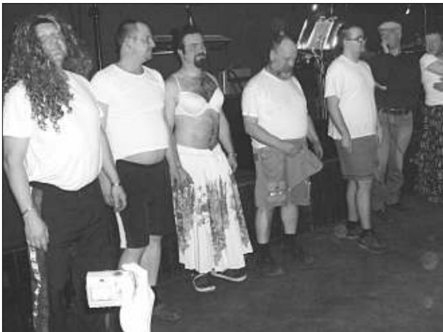
DOŽ. Osovští muži na oslavě Dne osovských žen.