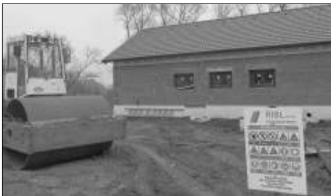
BUDOUCÍ »ČOVKA«. Čistírna odpadních vod v Hlásné Třebani má být do zkušebního provozu uvedena nejpozději 31. srpna.

Zhotovitel žádá o úplnou uzavírku silnice směrem na Mořinu v úseku