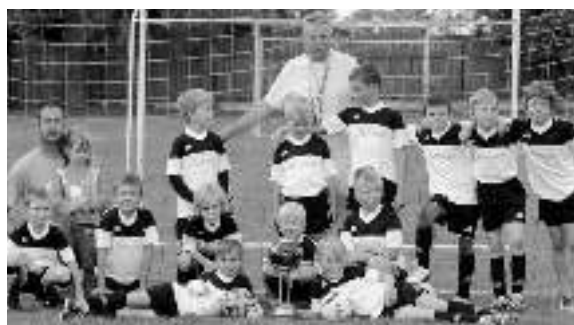
MALÍ VŠERAĐÁCI. Na turnaji bude hrát i mladší příprava Všeradic.