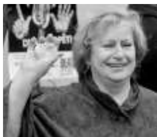
S KAMÍNKEM. Věra Čáslavská při slavnostním pokládání základních kamínků haly.

Já sice v Černošicích trvale bydlím, ale jsem pořád někde pryč, takže jsem původně ani nezaregistrovala, že se tu má nějaká sportovní hala