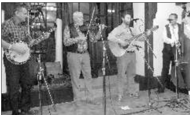
VZPOMÍNKA NA TUČNÉHO. Karlštejnská country kapela Kapičky při vzpomínkovém koncertu v Berouně.