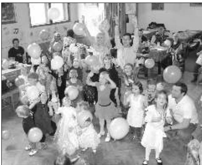
NA KONEC LÉTALY BALÓNKY. V závěru karlštejnského Karnevalu v podhradí dostaly děti balonky.

Karlštejnského Karnevalu v podhradí se v neděli 8. 3. zúčastnilo 130 návštěvníků. Od 14 do 17.00 se tančilo a soutěžilo. Dětské kostýmy byly opravdu překrásné. Diváci se mohli těšit pohledem na tančící rytíře, princezny, včelky, motýly, čarodějky, indiánky, nechyběla úžasná zdravotní sestřička ani perfektní klaun Toník. Hudbu pro tanečníky připravil Viktor Pastorek z Karlštejna, s organizací mu pomáhal Ondra Votruba. Masky se vrhaly do všech soutěží a nikdo neotálel. Děti prolézaly strachovým pytlíkem, přenášely balonky slalomovou dráhou a soutěžily ve zpěvu. Některé úkoly nebyly jednoduché, například najít mezi padesáti rozházenými botičkami ten správný pár, byla náročná práce. Naše děti se ale vyznají, a tak nepořádek zorganizovaly a společně všechny páry poskládaly. Organizátoři z karlštejnského pracoviště Domečku Hořovice nezapomněli ani na rodiče. Ti soutěžili v luštění zakódovaných názvů měst. Maminky a tatínkové si