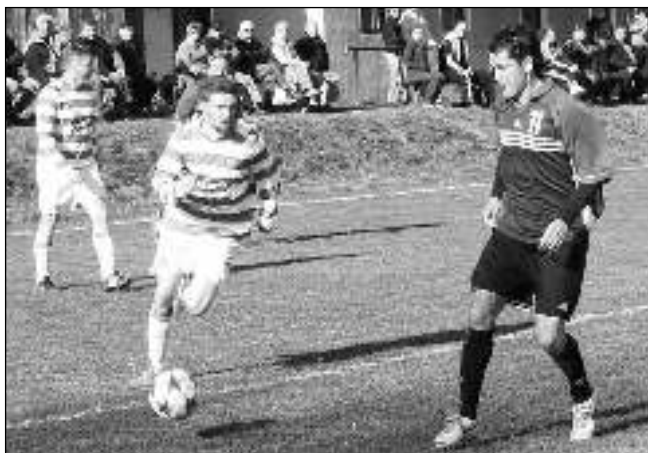
BODY ZŮSTALY DOMA. V prvním jarním mistráku si Lety překvapivě porádily s favorizovanou Lhotou 4:3.