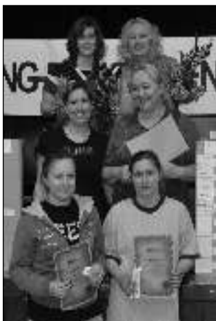
VÍTĚZKY A VÍTĚZOVÉ. Dvojice, které na turnaji triumfovaly ve čtyřhře žen a čtyřhře mužů.