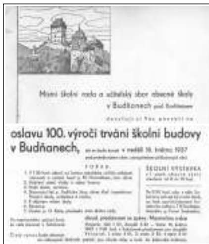
STO LET. Pozvánka na 100. výročí školy v Budňanech.

1807 jsou Katalogy ve školním archivu uloženy. Školní obec tvořily obce Budňany, Poučnick, Klučice, Přední Třebaň, Malá Mořina, Velká Mořina