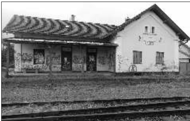
UKLIDÍ NÁDRAŽÍ. Okolí nádraží v Litni budou zkulturovat účastníci jarní brigády 11. dubna.

Místní dráha Zadní Třeboň - Lochovice byla postavena v letech 1900-1901. Cílem dráhy bylo hlavně využití pro hospodářskou vlakovou dopravu - cukrové řepy, brambor, dřeva