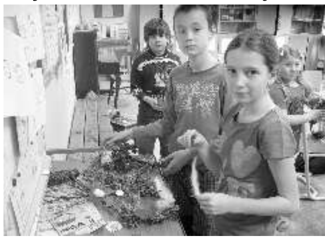
Osovské děti vyráběly velikonoční dekorace.

Velikonoce se rychle blíží, a proto se děti ze všech tříd ZŠ Osov v pondělí 23. března pustily do příprav na tradiční Velikonoční jarmark. Vyráběly se věnce, závěsy, slepičky, pletené klíčky, vrkoče a další pěkné velikonoční dekorace. Pomoci školákům přišla také jedna maminka, která na žádání naší dílně nechyběla... Všechny výrobky našich dětí se každoročně prodávají následující den na Velikonočním jarmarku. Výtěžek jarmarku je použit na vybavení školy. Soňa KOCMANOVÁ, ZŠ Osov