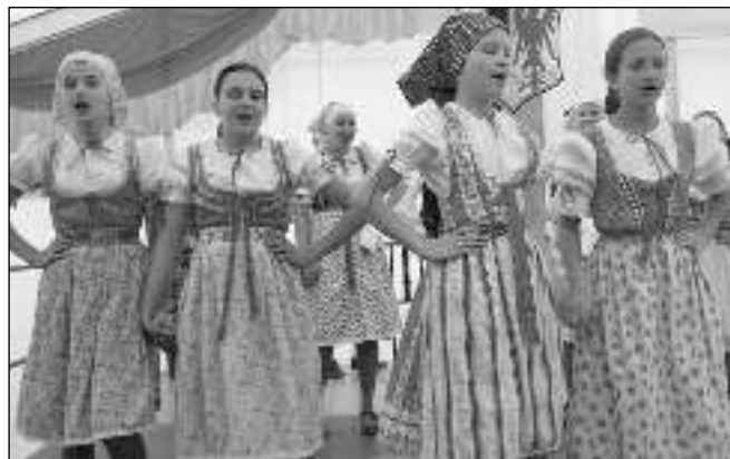
Z MARIÁNSKÝCH LÁZNÍ. Na folklorní festival Staročeské máje přijede také soubor Marjánek z Mariánských Lázní.

lovka Jirkovák a mnohé další. Chybět ale samozřejmě nebudou ani domácí účinkující: Klíček, Notičky, Proměny, Třeňusk, Pramínek, Kvítko, děti ze škol, školek či zájmových skupin. Miloslav FRÝDL