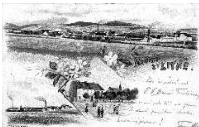
Litografická reprodukce zachycuje Liteň na přelomu 19. a 20. století. Lukáš MÜNZZBERGER

Se zajímavými záběry Litně vás prostřednictvím své sbírky starých pohlednic seznamuje obyvatel městyse, sazeč a dobrovolný hasič Lukáš MÜNZZBERGER.