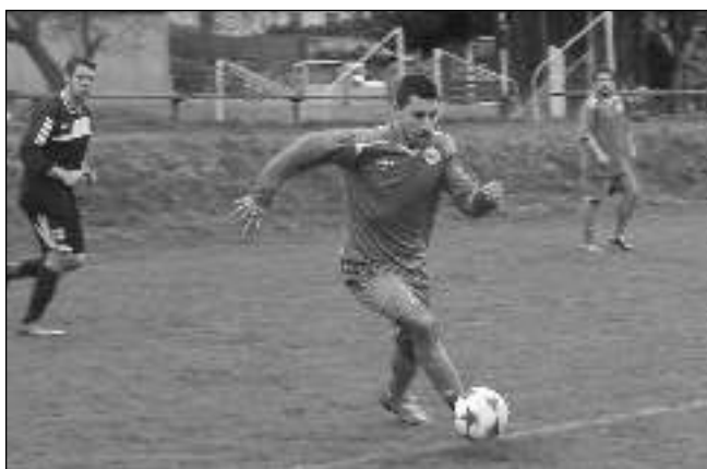
NA ZAVIDOV NESTAČILI. Letovští fotbalisté v dalším mistráku prohráli poslední březnovou neděli doma s FC Zavidov 0:1.