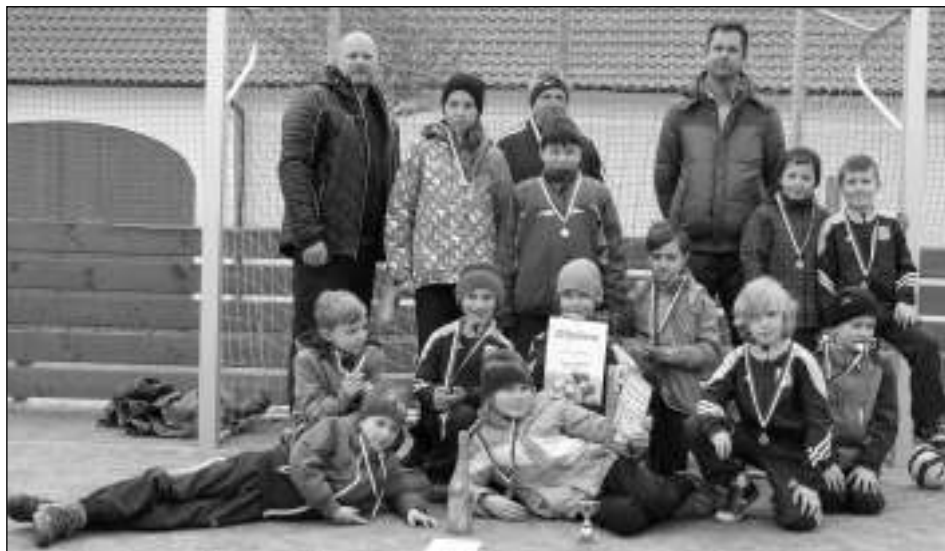
BRONZ ZŮSTAL DOMA. Přípravka Všetradic, která na domácím turnaji poslední březnový víkend vybojovala bronzové medaile.