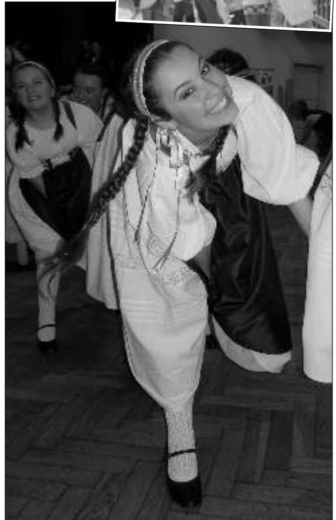
NA PLESE. Českomoravský ples pořádala poslední březnovou sobotu v Zadní Třebani řevnická lidová muzika Notičky. Dobře se bavili návštěvníci i samotní členové souboru.

obvodního oddělení v Karlštejně. Zatím poslední případ se stal 24. 3. v Hlásné Třebani. „Neznámý zloděj rozbil sklo levých předních dveří, ze sedadla řidiče ukradl textilní tašku na doklady a poté utekl,“ popisuje událost velitelka karlštejnských policistů Hedvika Šmidová a vypočítává, o co všechno majitel auta přišel: „Kromě dokladů byl v tašce klíč od soukromého vozu oznamovatele zn. Wolkswagen, svazek asi dvaceti klíčů od bytu se vstupním čipem do panelového domu a firemní razítko.“ Škoda je bezmála deset tisíc korun. Zloděje ale lákají nejen auta. Z garáže v Radotínské ulici v Černošicích neznámý chmaták ukradl dvě kola. Policisté zjistili stopy vedoucí k lávce do Lipenců. Miloslav FRÝDL