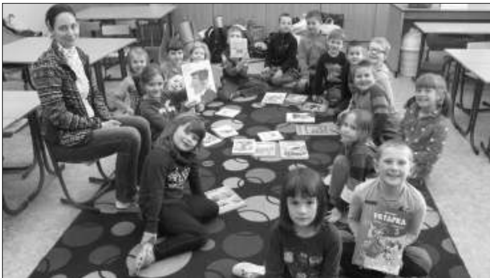
NOC S ANDERSENEM. Liteňské děti při nocování ve své škole.