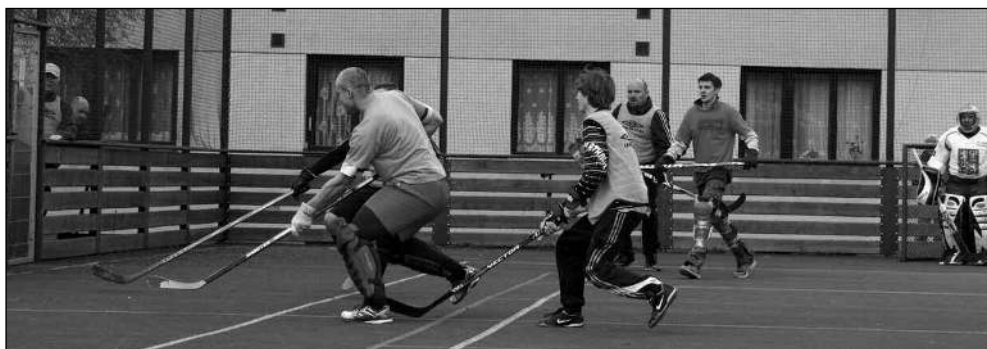
KAŽDÝ S KAŽDÝM. Na svinářských kurtech se o Velikonocích hrál turnaj v hokejbalu.

V zápase plném nepřesností měli více ze hry hosté. (mif)