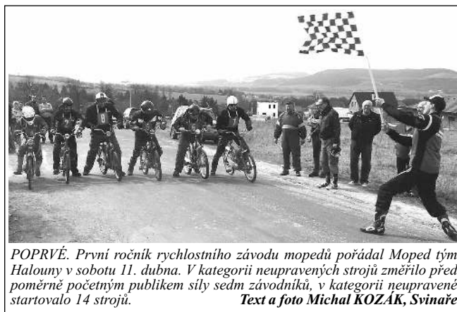
POPRVÉ. První ročník rychlostního závodu mopedů pořádal Moped tým Halouny v sobotu 11. dubna. V kategorii neupravených strojů změřilo před poměrně početným publikem síly sedm závodníků, v kategorii neupravené startovalo 14 strojů.

VŠERADICE, okresní přebor Všeradice - Loděnice B 0:2