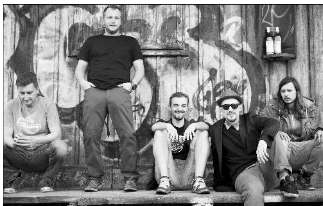
SCB. Kapela SCB/Space Cripple Bastards.

14. 4. a 16. 4. 17.30 PÍSEŇ MOŘE 14. 4. 20.00 SAMBA 15. 4. 17.30 RYCHLE A ZBĚSILE 7 15. 4. 20.00 DÍRA U HANUŠOVIC 16. 4. a 29. 4. 20.00 (St 17.30) NOČNÍ BĚŽEC 17. 4., 18. 4., 24. 4., 25. 4. 17.30 (So 16.00) OVEČKA SHAUN VE FILMU 17. 4. a 23. 4. 20.00 (Čt 17.30) KRÁLOVA ZAHRADNICE 18., 22. a 28. 4. 17.30 ČAROVNÝ LES 18. 4. 20.00 POŘÁD JSEM TO JÁ 21. 4. 17.30 CESTA NADĚJE 21. 4. 20.00 DIPLOMACIE 22. 4. 10.00 LOVCI A OBĚTI 22. 4. a 29. 4. 20.00 PESTROBARVEC PETRKLÍČOVÝ 23. 4. a 25. 4. 20.00 Š TVÁŘÍ ANDĚLA 24. 4. 20.00 PADESÁT ODSTINŮ SĚDI 25. 4. 17.30 CHAPPIE