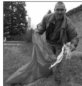
* Odpačky kolem hlavní silnice v Letech sbírali v minulých dnech zaměstnanci místního obecního úřadu. V sobotu 18. 4. pořádá radnice úklid Letů. (bt)

* Vandalové řádili 4. 4. před hřbitovem v Karlíku - poškodili veřejný majetek v hodnotě převyšující 5.000 korun. Případ vyšetřují řevničtí »státní« policisté. (duš)