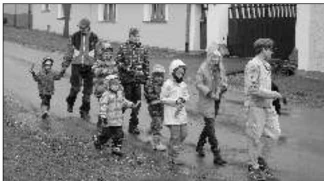
POČASÍ ŘEHTÁČE NEODRADILO. Jako každý rok na Velikonoce, odletěly na Zelený čtvrtek zvony do Říma a u kapličky v Korně se sešly děti, aby je nahradily řehtačkami. Vesnici od Zeleného čtvrtka do Bílé soboty obešly celkem osmkrát. I když počasí připomínalo spíš Vánoce, děti to neodradilo. Text a foto Kateřina JÍCHOVÁ, Korno

Matouš MARTINEC, Dobřichovice Foto Adéla GEMPERLOVÁ