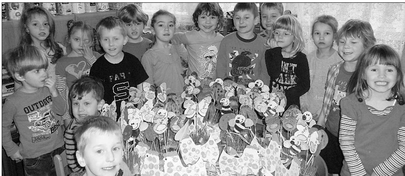
VÍTALY JARO. Děti z MŠ Všeradice se rozloučily s dlouhou vládou zimy a přivítaly nastupující jarní období.