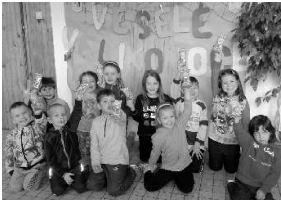
NAŠLY POKLAD. Osovské děti při Putování za velikonočním zajícem.