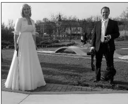
NEVĚSTA HRÁLA GOLF. Svatbu oslavil v sobotu 11. 4. ve všeradickém Zámeckém dvoře pár ze Žebřáku. Novomanželé si po obřadu vyrazili zahrát minigolf.

Měsíc duben vstupuje do své druhé poloviny a jarní počasí k nám obrátilo svoji vlídnější tvář. Pučící příroda si zasluhuje naši plnou pozornost, a to nejen na vlastních zahrádkách. Příkladem nám mohou být děti, které pod vedením svých maminek v sobotu 4. dubna vysbíraly odpadky po Všeradicích. Jsem přesvědčen, že neuklízely nepořádek po sobě, ale právě po nás, dospělých či dospívajících, kterým je jedno, kde co zahodí nebo jim vypadne z rukou. Jistě dětský úklid nemůže plně suplovat potřebný úklid obce, ale je to důvod k zamýšlení o tom, jaký svým dětem dáváme příklad, když po nás musí uklízet. Proto chci zúčástněným dětem i maminkám poděkovat za jejich práci a vzorný příklad toho, jak se máme ke svému okolí stavět. Bohumil STIBAL, Všeradice