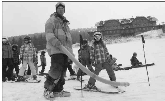
NA HORÁCH. Jako každý konec března, i ten letošní strávily děti ze ZŠ Karlštejn týden školy v přírodě na vrcholcích Krkonoš, v horském hotelu Štumpovka. Počasí bylo skvělé, a tak si mohly na zasnežených a prosluněných svazích užívat všech zimních radovánek. Text a foto Jiřina JANOVSÁ, ZŠ Karlštejn

Zdeněk BENEŠ, VSV Karlštejn Foto Jarmila KOZOVÁ