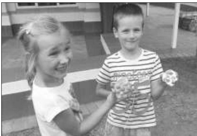
POČESKU. Krajané si v Jihoafrické republice, osm a půl tisíce kilometrů od domova, připravili pravou českou oslavu Velikonoc.

Skupina Čechů žijících v našem okolí se neustále rozrůstá, proto jsme se rozhodli poněkud v předstihu uspořádat především pro naše děti velikonoční odpoledne s připomenutím českých tradic. Zároveň to byla krásná příležitost k neformálnímu setkání, pohovoření si v mateřském jazyce a posílení pocitu, že my, Češi, přece jen umíme táhnout za jeden provaz, když opravdu něco chceme. Děti měly nezapomenutelné zážitky ze zdobení a konzumování perníkových vajíček, malování vyfouknu-