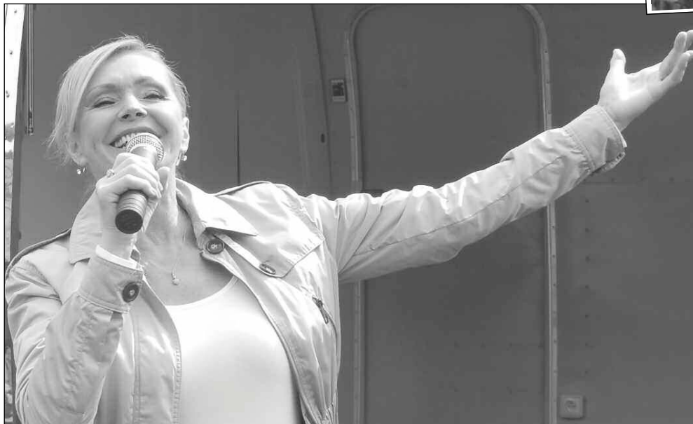
HELENKA ZPÍVALA V KARLŠTEJNĚ. Slavnosti Morany, které se konaly 11. 4. v Karlštejně, se zúčastnila populární zpěvačka Helena Vondráčková. Na louce pod mostem zapěla několik svých hitů. (Viz str. 11)

Chvilí jsem zvažoval cestu do Santiaga di Compostella. Tato pouť ale pro mě nemá dostatečný duchovní rozměr, navíc ji považuji za lehce zprofanovanou. (Dokončení na str. 3)