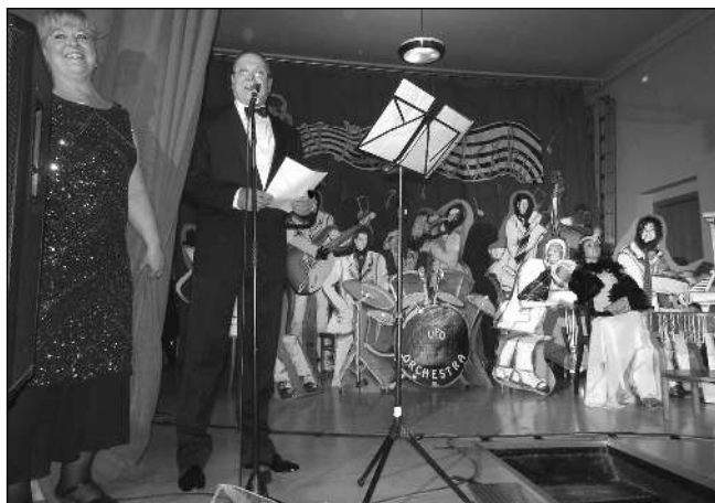
HRÁL VPO. Ples tanečního souboru Klíček se konal 11. dubna v Řevnicích. Organizátoři přišli se zajímavým experimentem - namísto »živé« kapely návštěvníkům vyhrával Velký papírový orchestr.

* Rodinný dům v Srbsku byl vykraden 8. 4. Neznámý zloděj vše prohledal, podlahu posypal kořením a odcizil zlaté šperky, peníze a jízdní horské kolo. Majitel má škodu 312.000 Kč. Kateřina PRŮŠOVÁ