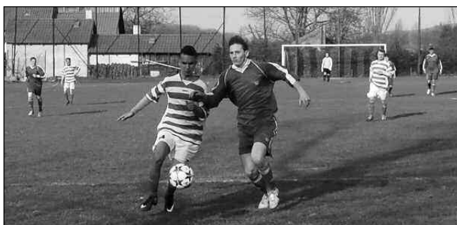
PROHRÁLI DOMA. Všeradice na svém hřišti v sobotu 11. dubna podlehly B-týmu Loděnic 0:2.