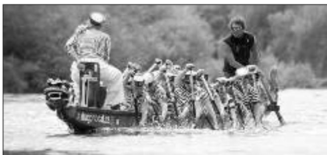
S DRAKEM NA PŘÍDI. Závodů dračích lodí se konaly druhou květnovou sobotu na Berounce v Dobřichovicích.

Domáci chtěli hostům z Čisovic oplatit vysokou porážku 0:4 z podzimu. Jenže na začátku zaspali a vedení se ujali gólem hosté. Dobřichovice pak sice soupeře zatlačily, ale trvalo 20 minut, než se jim podařilo vyrovnat. V závěru poločasu se ujaly vedení a po změně stran dění na hřišti zcela ovládly. Když Smiovský zvyšoval na 3:1, zdálo se, že je rozhodnuto. Stačilo však drobné nedorozumění v obraně a bylo zle. Gólman Friš se srazil s protihráčem a byla z toho penalta! Hosté v 80. minutě snížili a hrozilo pořádné drama. Naštěstí Větrovec v 83. minutě nádhernou střelou stanovil konečné skóre. (oma) Tuchoměřice - Dobřichovice 1:1 Branka: Zamrazil