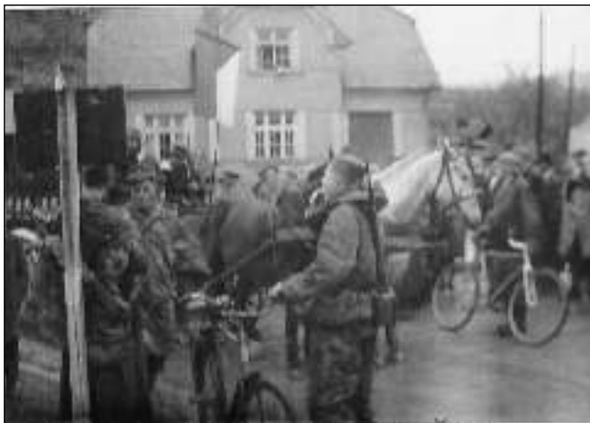
NA POMOC PRAZE. Vlasovci se cestou na pomoc Pražskému povstání zastavili 7. 5. 1945 v Zadní Třebani.