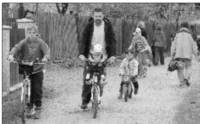
NA TRASE. Malí i velcí návštěvníci prvomájového Pohádkového lesa.

Ačkoliv si české i norské předpovědi počasí plně dešťových mraků pěkně pohrály s nervy organizačního týmu, nakonec nám svatý Petr přál. Pirátsky laděnou akci si nenechalo ujít bezmála 400 dětí a stejný počet dospělých. Účastníci museli projít devíti ostrovy, na každém z nich splnit úkol a získat symbol, který byl potřeba pro rozluštění tajného hesla k pirátskému pokladu na konci cesty. Tam čekal sám Neptun se dvěma mořskými pannami a bedlivě střežil truhlu se zlatými mincemi, které by-