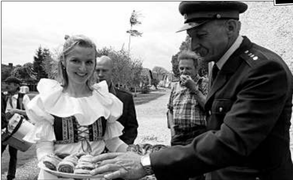
DOBROTY POD MÁJKOU. Na čtyřech místech našeho kraje už se v uplynulých vikendech konal folklorní festival Staročeské máje. Ve vinařích mohli účastníci průvodu ochutnat rozličné dobroty.