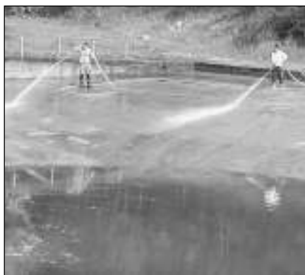
ČISTILI NÁDRŽ. Všeradičtí hasiči při čištění požární nádrže.