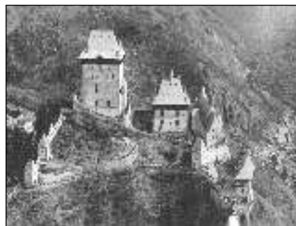
Z NEBE. Hrad Karlštejn na leteckém snímku z roku 1921.

Četnická stanice byla zřízena r. 1906 a jest o 3 mužích, v době letní o 4 mužích. Obvod tvoří Budňany s Karlštejnem, Poučnick, Klučice, Srbsko až ke Kačáku, Hlásná Třebaň, Mořina, Mořinka až ke Karlíku. O zdraví lidu pečují obvodní lékař z Mořiny. V místě je i zvěrolékař. Úkoly peněžního ústavu plní Spořitelna i záložní spolek pro Budňany a okolí