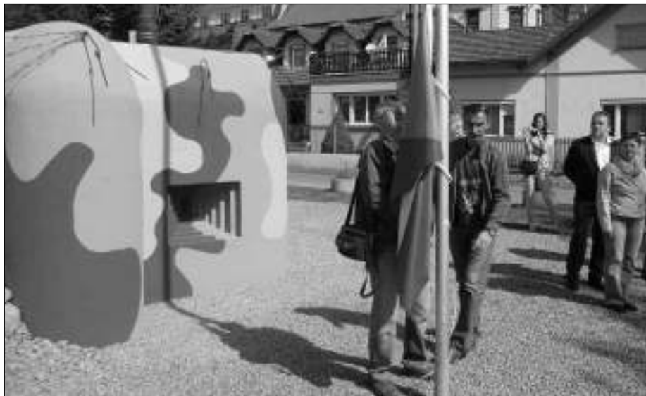
OTEVŘENO. Novou turistickou atrakci získal Karlštejn. V pátek 8. 5. tu bylo v krásně zrekonstruovaném předválečném bunkru poblíž parkoviště slavnostně otevřeno Museum lehkého opevnění.

Po příchodu průvodu zdravotní vyhlášení obce Srbsko