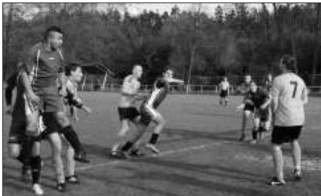
TĚSNÁ PROHRA. Smolný zápas sehrál zadnořebaňský Ostrovan na svém hřišti s ČL Beroun. Hosté si odvezli těsné vítězství 1:0.

* 3. Dobřichovický kros půlmaraton se poběží 16. 5. Start je v areálu zámku Dobřichovice; v 10.00 dětský závod na 1 km, půlmaraton a závod na 10 km v 10.45. Prezence začíná v 9.30. Andrea KUDRNOVÁ * Mistrovský turnaj mladších přípravek se uskuteční 16. 5. od 9.00 na hřišti ve Všeradicích. (ka)