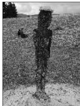
ČARODĚJNICE. Hořící vatry ve Svinářích i Řevnicích a ohořelá postava ve Lhotce.