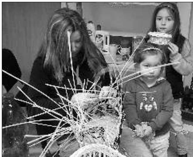
PLETLY KOŠÍKY. Maminky s dětmi se v klubovně karlštejnského Domečku učily plést košíky.

Tvořit se začalo v devět hodin ráno, výtvarná činnost oslovila především děvčata. Kurz měl za úkol ukázat,