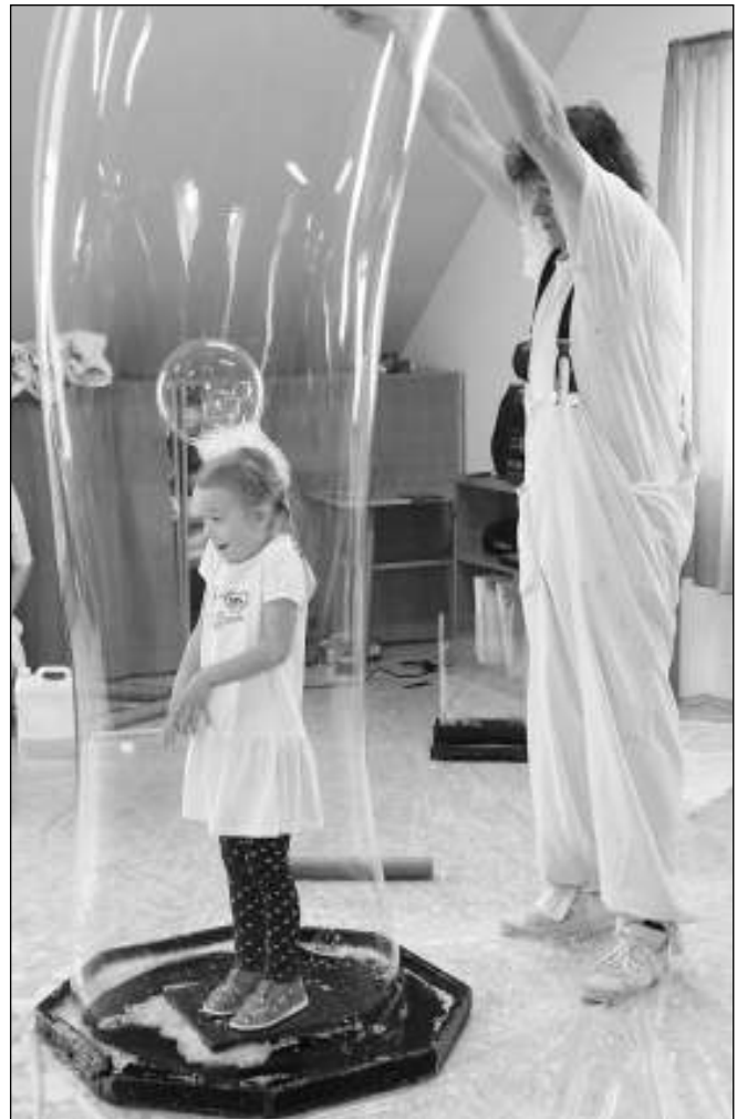
V BUBLINĚ. Jedno z liteňských dětí na bublinové show klauna Václava Strassera.

ních představitelů rozesmály snad každého. Mohli jsme zhlédnout bubliny všech tvarů a velikostí. Děti byly nadšené a do bubliny chtěly všechny. Že to nejde? Omyl. Pár šťastlivců bylo do obrovské bubliny uzavřeno. Šlo zkrátka o představení, na které se nezapomíná. Děkujeme ředitelce školky J. Čampulové za pozvání. Dagmar KARLOVÁ, ZŠ Liteň