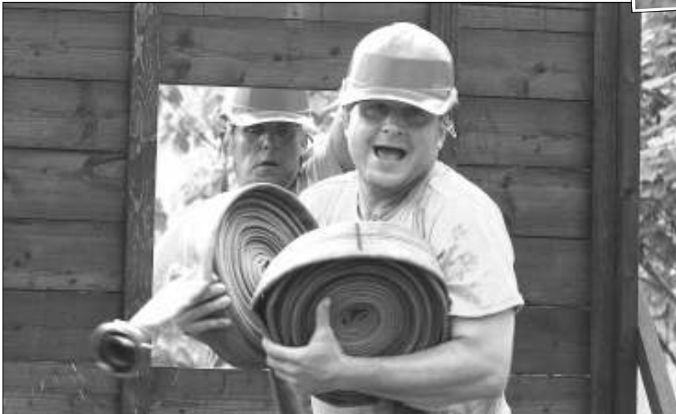
VELKOLEPÉ OSLAVY. Sto dvacet let trvání oslavil 13. června Sbor dobrovolných hasičů ve Svinářích. Součástí velké akce byla i netradiční soutěž »požárnických« družstev z okolí. (Viz strana 11)