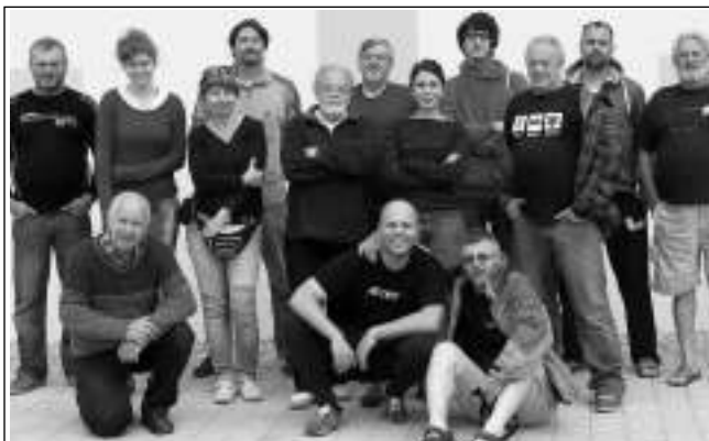
SYMPOZIUM SKONČILO. Nádhernou vernisáží dne 20. 6. vyvrcholil desátý ročník mezinárodního art symposia, jehož se ve Všeradicích účastnilo 14 umělců ze třech států. Letošní ročník byl obohacen o přítomnost 4 sochařů, kteří vytvořili krásné plastiky ze starých kaštanů, které by jinak skončily jako palivo. Vernisáže se zúčastnilo asi 70 návštěvníků. Díla vytvořená na sympoziu můžete ve všeradické galerii zhlédnout do 31. srpna. Bohumil STIBAL, Všeradice

Jak jistě většina obyvatel Zadní Třebaně zaregistrovala, zároveň s kanalizací se de facto v totožných lokalitách buduje i vodovodní řád. Děje se tak díky dotaci, o kterou požádalo minulý zastupitelstvo. Spoluúčast obce je 40 %, tzn. asi 9 milionů Kč. Protože se dotace týká jen hlavního vodovodního řádu, každý zájemce o připojení na vodovod zaplatí za samostatně vedenou přípojku 25 000 Kč, v případě připojení vodovodní přípojky do souběžného výkopu kanalizace bude cena 20 000 Kč. Připojení na kanalizaci nebude zpoplatněno. Kolaudace vodovodu je plánována na leden 2016. V této souvislosti firmy, které budují kanalizaci, rep. vodovod, oznamují, že nyní nenabízejí výkopové práce na soukromých částech kanalizačních a vodovodních přípojek. Tyto práce budou nabízet až v listopadu. Dřívější zahájení prací nedoporučují. OU Zadní Třeboň zároveň upozorňuje, že pracovní skupiny nabízející nyní výkopové práce na soukromých pozemcích, nemají s výše uvedenými firmami nic společného. Zadní Třeboň byla úspěšná i se žádostí o dotaci na projekt Zkvalitnění nakládání s odpady. Konkrétně se jedná o podporu na nákup svozové techniky a kontejnerů pro likvidaci biologicky rozložitelného odpadu. V této době je vyhlášeno výběrové řízení na dodavatele. Proto ještě nelze přesně uvést, kdy bude technika zakoupena. Markéta SIMANOVÁ, starostka Zadní Třebaně