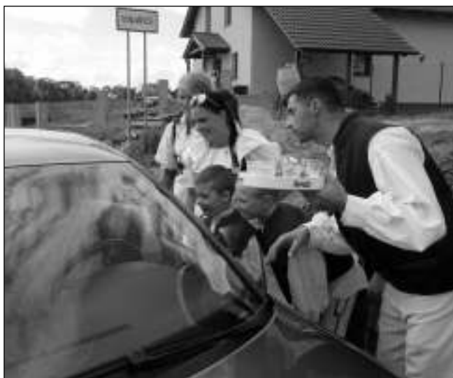
DÁTE SI S NÁMI? Krojovaní účastníci Staročeských májů vítají jednoho z řidičů ve Vinařicích.

Celá situace mi začala připadat čím dál tím méně vtipnou, a to ani nemluví o tom, jak celou situaci pro-