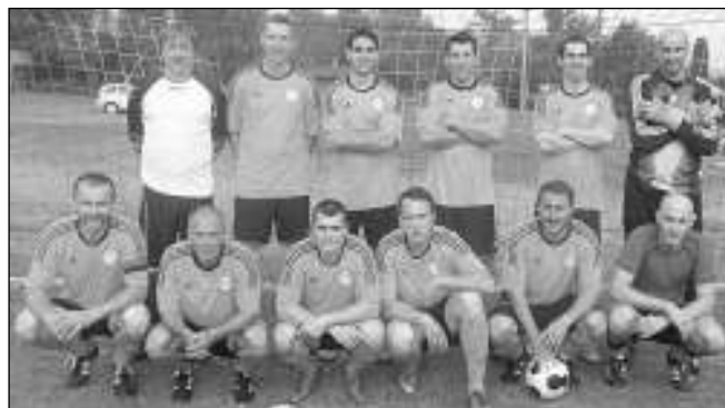
SPADLI. Ostrovan Zadní Třebaň sice v posledním mistráku remizoval, ale od sestupu z okresního přeboru ho to nezachránilo.