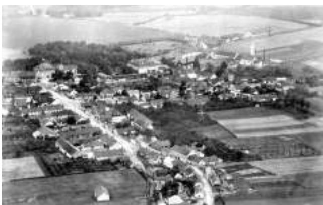
Pohlednice s unikátním leteckým snímkem zachycující podobu Litně za první republiky. Pohlednici vydal Klub československých turistů.