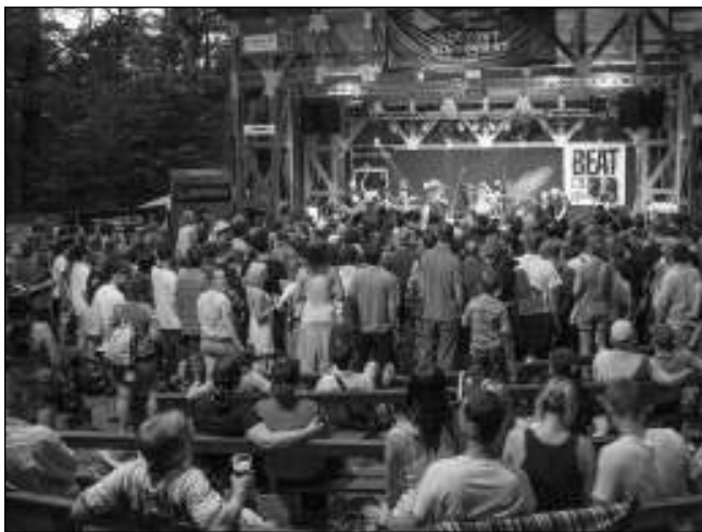
PLNO. Zaplněné hlediště řevnického Lesního divadla při festivalu Rockový Slunovrat.