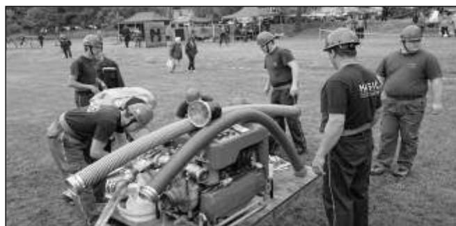
V CHYŇAVĚ. Liteňští hasiči na okresní soutěži v Chyňavě skončili čtvrtí.