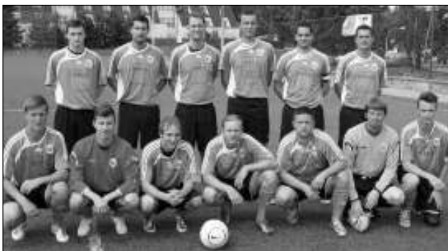
ZACHRÁNILI SE. Tým FK Lety před posledním jarním mistrákem na hřišti SK Benešov.

Po dvou letech se bohužel zadnotřebaňský Ostrovan loučí s okresním přeborem. Skončil beznadějně poslední se ziskem pouhých dvanácti bodů. Bilance tři výhry, tři remízy a dvacet porážek při skóre 32:101 je žalostná. Mužstvo sice nastoupilo na jaře s odhodláním zachránit se v soutěži, první zápasy ale smolně prohrálo o gól a pak už to šlo z kopce. Katastrofální byla účast na utkáních, byl zážrak, že se tým dokázal sejít alespoň v jedenácti lidech. Nejlepším střelcem byl Bacílek se šesti brankami, následovně dalším matadorem Procházkou (5). Budoucnost týmu dospělých je nejistá, zda se objeví v okresních soutěžích se rozhodne v příštích dnech. Jisté ale je, že na Ostrově budou hrát okresní přebor starší žáci a svou soutěž také stará garda. Jiří PETŘÍŠ