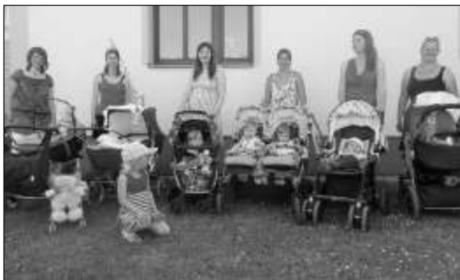
DO PRŮVODU S KOČÁRKY. Účastnice (a malí účastníci) korenských kočárkových májů.