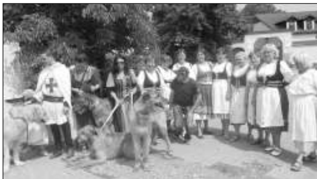
ČEKÁNÍ NA KRÁLE. Obyvatelé Hlásné Třebaně očekávají na návsi příchod Královského průvodu.

Za velkého pokřiku a provolávání slávy se průvod vydal dále, směr Karlštejn. Na císaře i celý průvod ale čekalo ještě jedno překvapení. Na