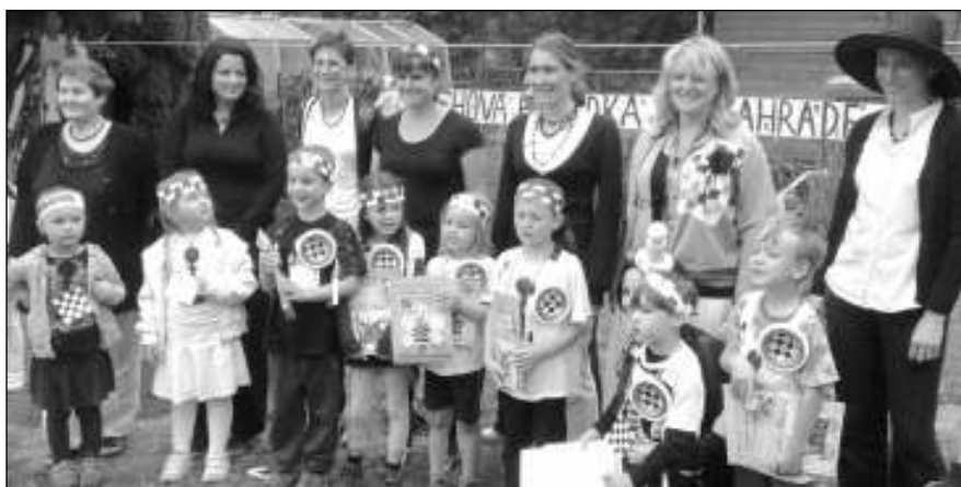
ČERNOBÍLÉ LOUČENÍ. Rodiče a děti na zahradní slavnosti ve školce.