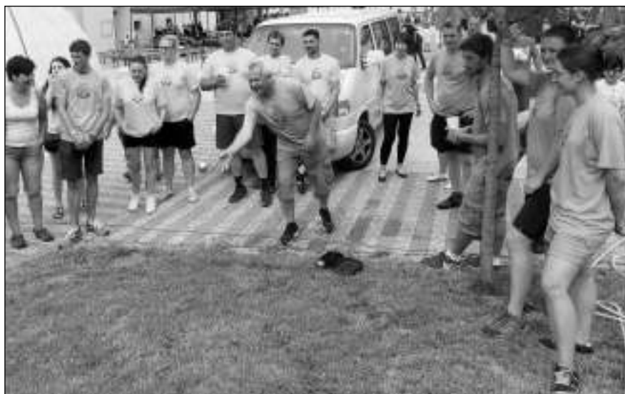
ŠŮP TAM S NÍ. Jednu z disciplín neváženého klání obcí Všeradice, Vinařice a Podbrdy sdružených ve Všeradově zemi byl hod petanqueovou koulí na cíl