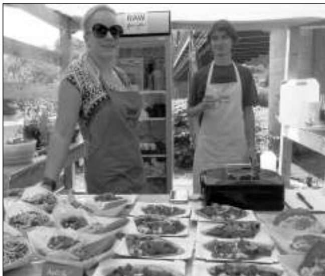
SAMÉ DOBROTY. Na dobříchovickém festivalu Všechny chutě světa si čitelé dobrého jídla opravdu přišli na své.

Doprovodný program, který se zaměřuje na celou rodinu, byl rozdělen do dvou částí. Pro aktivnější skupinu byly připraveny atrakce jako třeba lezecká stěna, bungee ranning, hou-