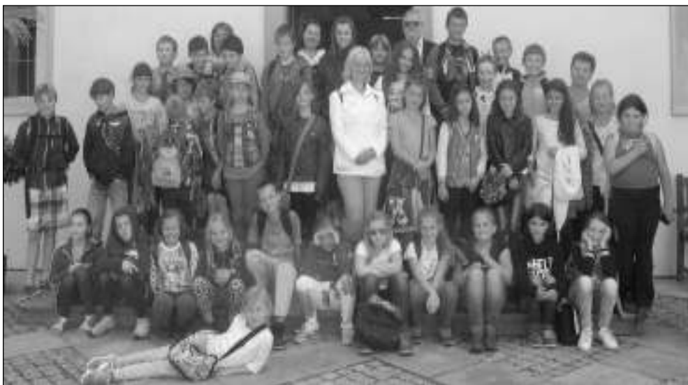
V SENÁTU. Osovští školáci navštívili na pozvání Jiřího Oberfalzera sídlo Senátu.