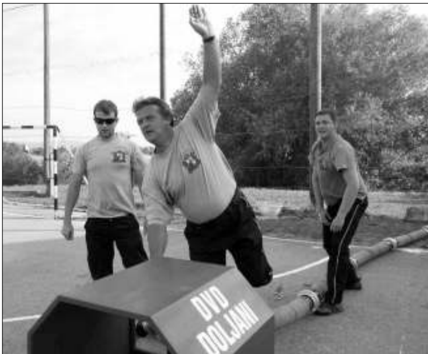
V CHORVATSKU. Všeradičtí hasiči na závodech v chorvatských Dolanech.