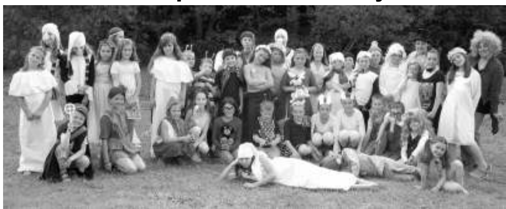
NA TÁBOŘE. Osovské děti na Zbizožském potoce.