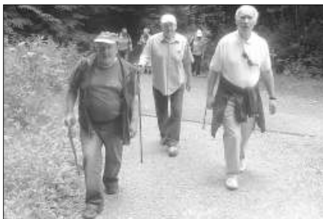
CESTOU DO SRBSKA. Členové Klubu přátel Karlštejna podnikli v červnu pěší výlet do Srbska.

V plánu práce KPK je kromě jiného spolupráce s Městyssem Karlštejn. Na základě toho bylo na výborové schůzi spolku v květnu dohodnuto zaslat dopis zastupitelům týkající se obnovy či údržby dvou cest v Karlštejně. Jednak je to pátá komunikace procházející obcí, jednak prodloužení komunikace ke hřbitovu, v níž se spolek angažoval již dříve. V dopisu jsme nabídli pomoc - bude-li zájem ze strany městyse a budeme-li našimi kapacitami dostatečně možní. Požádali jsme městys o písemnou odpověď na náš dopis z května 2015, ale odpověď zatím nedošla žádná. V květnu jsme organizovali zájezd s