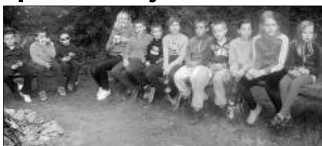
U OHNĚ. Karlštejnští školáci poslouchají písničky v podání country kapely Kapičky.