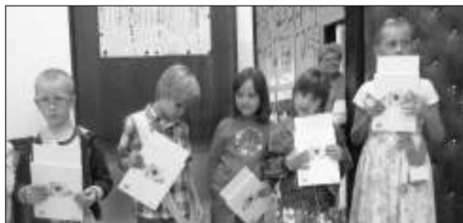
NASHLEDANOU. V závěru června se v zadnotřebské málotřídce rozloučili s odcházejícími čtvrtáky.