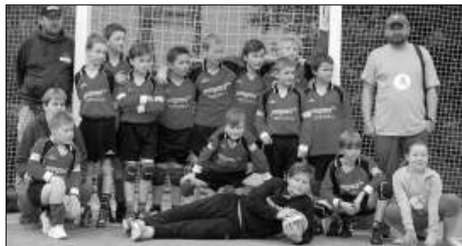
V MOSTĚ. Řevnická výprava na házenkářském Poháru ČR mladších žáků v Mostě.

Řevnice - Plzeň Újezd 5:10 Svinov - Řevnice 11:9 Humpolec - Řevnice 11:7 Řevnice - Krčín 10:13