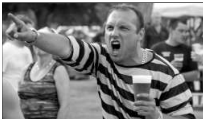
HOBLUJ! Jeden z rozvášněných diváků na hudebním festivalu Karlštejský mazec.

Od 13.00 začaly znít první tóny tohoto ročníku, hrají Sam-Ou-Hell, následují Tyvole, Metallica revival, Gregor Samsa, Slapdash Rockabilly. Najednou se na jevišti i v hledišti objevují vosy, Vosí hnízdo začíná a následuje Pumpa, večer uzavírá Bu-gr. Festivalem bravurně provázela Pa-