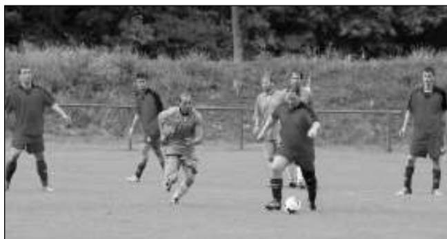
ZÁVĚREČNÁ VÝHRA. V posledního jarním mistrovském utkání porazili Karlštejnstí Chodouň 5:1.