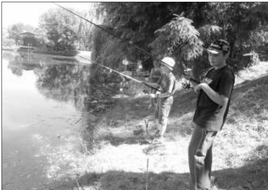
U RYBNÍKA. Závody malých rybářů se konaly u rybníka Palivčák.