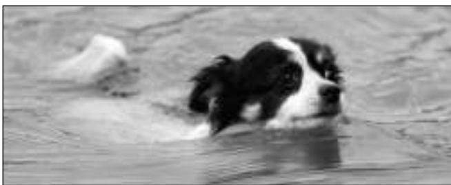
V BEROUNCE. Jeden z psích frekventantů kurzů na letovském cvičáku při osvěžující koupeli v Berounce.