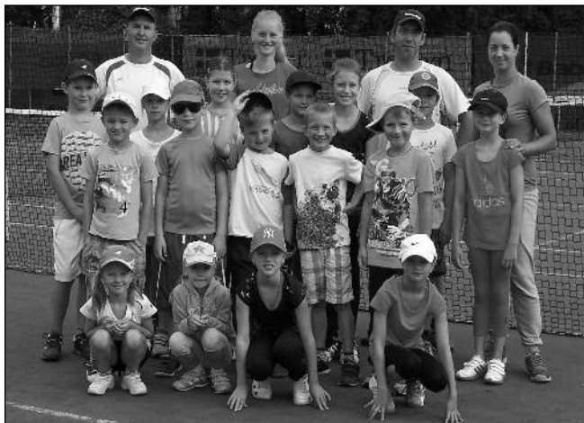
V KEMPU. Účastníci tenisového kempu Sportclubu Řevnice, který se konal poslední červencový týden.

ku. Během léta si povrch s umělou antukou zkoušejí nejmenší tenisté na kempech, které pro ně Sportclub jako každoročně připravil. (js)