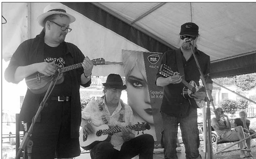
ZAHRÁLI NA »KYTARKY«. Ukulelisté koncertovali mimo jiné na karlštejnském náměstí.