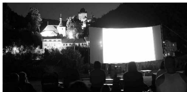
VIDĚLI I HRAD. Diváci v karlštejnském letním kině mohli sledovat představení i nasvícený hrad s kostelem.