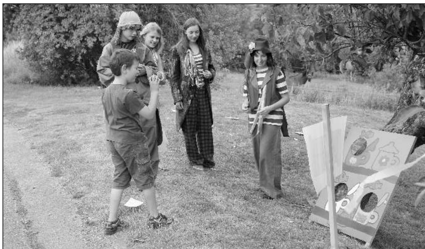
OSKAROVA NOC. Jedno ze zastavení karlštejnské pohádkové trasy.