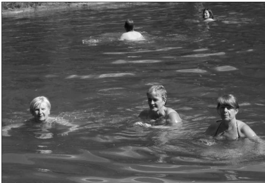
VE VODĚ. Osovecké ženy, které se přišly v parném odpoledni osvěžit na koupališti.

Osovsko je na první pohled zajímavé důmyslným systémem okrasných alejí, tvořených převážně jírovcí a lipami. Nejmohutnější je alej Osov – Skřípel. Při důkladném zkoumání leteckých map lze ale objevit i promyšlené uspořádání významných staveb a dvorů. Pokud spojíme dvory Skřípel a Nové Dvory pomyslnou úsečkou a vytvoříme pomyslnou kružnici o tomto poloměru se středem v Nových Dvorech, na jejím obvodu budou dvory Všeradice, Osov, Vižina a Lážovice. Spojováním těchto dvorů lze vytvořit tři shodné rovnostranné trojúhelníky: Skřípel - Nové Dvory - Osov, Skřípel - Nové Dvory - Lážovice, Nové Dvory - Všeradice - Vižina. Další zajímavostí je uspořádání významných staveb okolo osovského zámku: spojíme-li zámek a dvůr Osov pomyslnou úsečkou a vytvoříme kružnici o tomto poloměru se středem v zámku, na obvodu kružnice bude schwarzenberská sýpka, kaplička v Osovci a křížek v klíčové aleji. Pokud vzdálenost zámek Osov - dvůr Osov zdvojnásobíme a vytvoříme kružnici se středem - zámku, na obvodu budou dvory Skřípel a Lážovice. Z důvodu zachování autentičnosti této výjimečné oblasti se Osovsko stalo roku 1996 chráněným územím a krajinnou památkovou zónou. Pavčina ČABOUNOVÁ, Osov