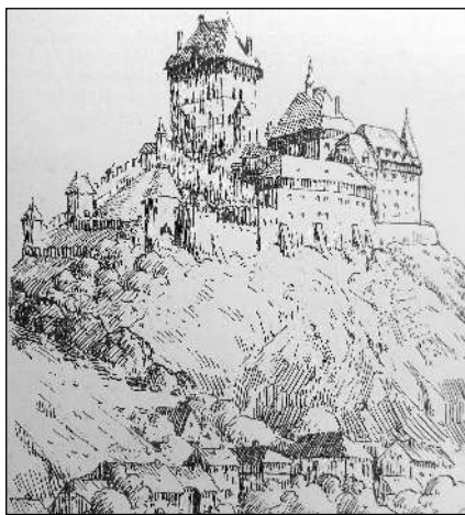
KARLŮV HRAD. Karlštejn s podhradím na dobové kresbě.