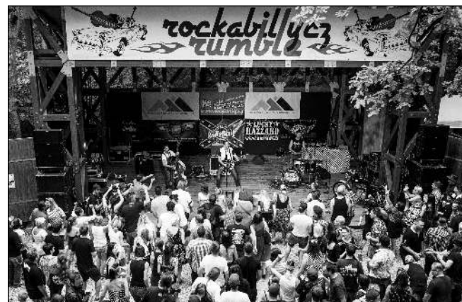
STOVKY LIDÍ V LESE. Již potřetí se 1. srpna rozezněl řevnickým Lesním divadlem rock 'n' roll a rockabilly. Branami areálu prošlo přes 500 diváků. Kromě českých kapel zahrály i dvě zahraniční.

Ateliér Rusalka navštěvují děti od pěti do sedmnácti let. Hravým a kreativním způsobem se seznamujeme s různými výtvarnými technikami, styly a výtvarníky v dané době. Co vás na práci s nimi nejvíce baví?