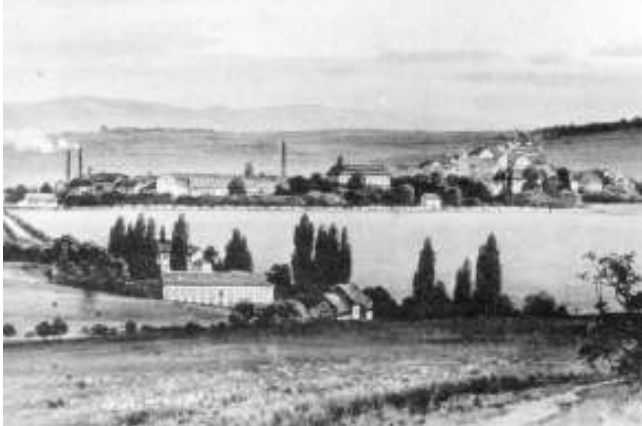
Pohlednice zasláná roku 1946 zachycuje mnohem starší pohled na Liteň od Karlštejna, a to v době Václava Beneše Třebízského (1875).