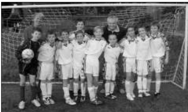
SPOLU. Společné fotbalové družstvo mladších žáků FK Liteň a Ostrovan Zadní Třebaně.

tytu Liteň za finanční podporu a technickou pomoc při sekání hřiště.