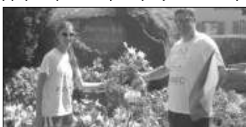
V KOSTNICI. Dva členové cyklistické družiny u Husova kamene v Kostnici.

jižního Německa přes St-raubing a Mnichov, navštívili slavný pohádkový zámek Neuschwanstein a přeplavili Bodamské jezero, abychom 6. 7. splnili cíl a uctili památku Mistra Jana. Navštívili jsme muzeum Husův dům, v němž prý byl český kazatel ubytován, a zastavili se u místa jeho upálení - tehdy leželo za hradbami Kostnice, dnes tu je Husův kámen. V recepci muzea nás paní velmi mile přivítala český. Nás i spoustu českých cyklistů a jiných turistů z Čech, kteří měli podobný nápad jako Michal. Byli