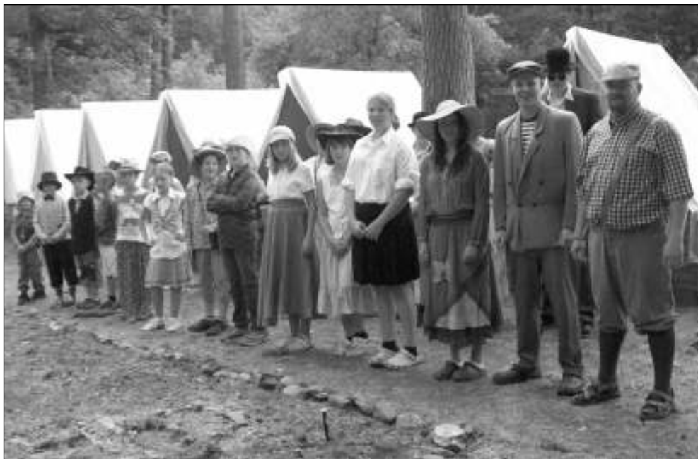
MEZI STANY. Liteňští Zálesáci na táboře v údolí Javornice.