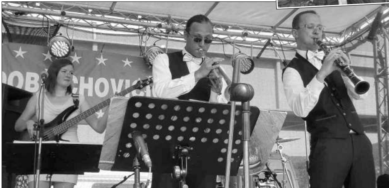
JAZZMANI U BEROUNKY. Přehlídka dixielandových kapel se konala na břehu řeky v Dobříchovicích. (Viz strana 4)