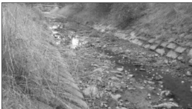
VODA ZMIZELA. Vyschlé koryto Svinařského potoka v Zadní Třebani.

„Zalévání z vlastních studní je zatím možné,“ dodal rychtář Dobřichovic. O vodu se bojí prakticky všude po okolí, Řevnice nevyjímaje: „U nás není ani tak problém se zdroji vody, ty jsou dostatečně kapacitní a kvalitní, ale s nárazovostí odběru zejména o víkendech, kdy dorazí chatáři, zalévají se zahrádky, čistí a doplňují bazény atd. Mnohdy se tak vodojem vyprazdňuje o víkend velmi rychle,“ sdělil starosta Řevnic Tomáš Smrčka. Městský úřad proto 10. 8. uveřejnil výzvu, v níž i s ohledem na nepříliš pozitivní předpověď vyhlásil do odvolání zákaz napouštění bazénů a akumulčních nádrží, zalévání zeleně a mytí automobilů. „Zabýváme se zpřístupněním dlouhá léta nevyužívaného zdroje a vodojemu v Selci pro občany na odběr vody k zalévání,“ uvedl Smrčka s tím, že město už vodu odtud k zalévání nově vyzávené zeleně a kropaní ulic využívá. „Zdroj je totiž i nyní poměrně