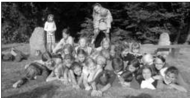
V PŘÍRODĚ. Děti z Klíčku na soustředění.

Děti si hrály na krále Artuše a během celého pobytu plnily různé úkoly. Hra skončila typicky pro Klíček - tancem na plese.