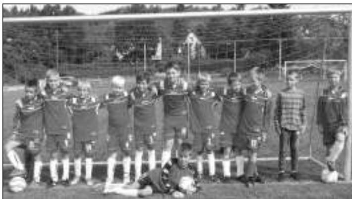
PŘÍPRAVKA. Řevnická starší příprava naopak tentýž den prohrála s Černolicemi 4:16. Kluci ale bojovali, co to šlo - byl to jejich vůbec první »opravdový« zápas.