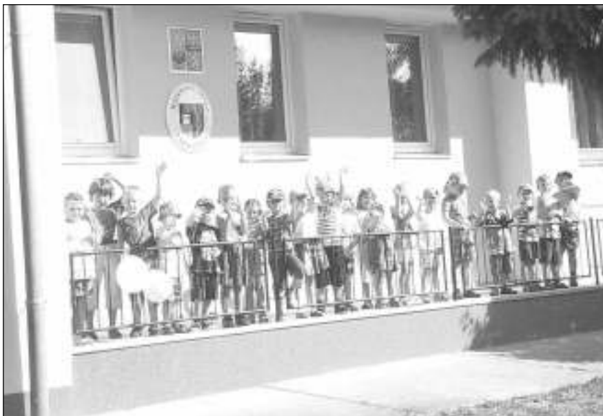
VE ŠKOLCE. Děti u »nové« školky ve Všeradicích.

11.00 – HORKÁ JEHLA, country kapela 12.00 – Zahájení kuchařských slavností 12.10 – Kejklíř PUPA 12.40 – ALOTRIUM, šermířská skupina 12.55 – NOC S ANDERSENEM – krajanské divadlo z chorvatské obce Dolany 13.40 – Soutěž pro děti 14.00 – Kejklíř PUPA 14.30 – ALOTRIUM, šermířská skupina 14.45 – Soutěž pro dospělé 15.00 – Kejklíř PUPA 15.35 – ALOTRIUM, šermířská skupina 15.50 – Vyhlášení výsledků kuchařské soutěže + losování diváckých vstupenek 16.30 – HOLUBIČKA – krajanský folklorní soubor z chorvatského města Daruvar 17.05 – TŘEHUSK, staropražská kapela 17.30 – Křest knihy M. Hrubéšové + CD Když jsem přišel do Všeradic 17.45 – TŘEHUSK, staropražská kapela 18.10 – Taneční skupina Jakuba Suchého 18.30 – VOJTA LAVIČKA Band