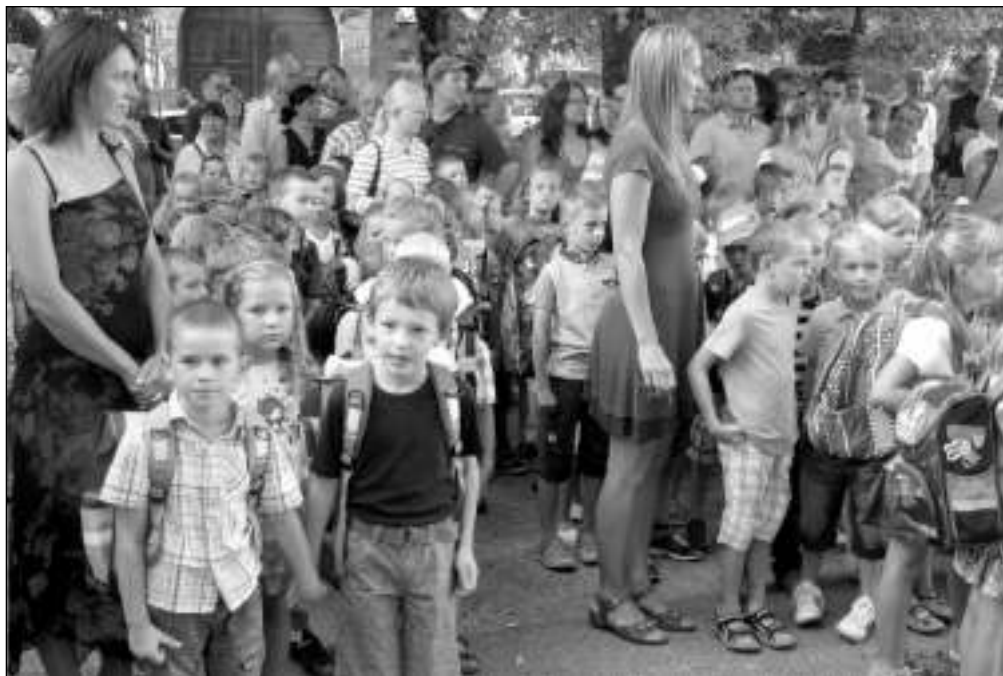
A JDE SE NA TO. Liteňští školáci při zahájení nového školního roku.

Marcela MOUREČKOVÁ, Liteňský pupík, Litěň