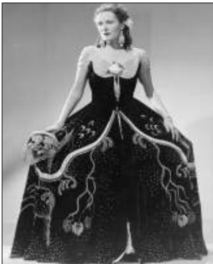
TRAVIATA. Jarmila Novotná v kostýmu z opery La Traviata.

Kostýmy, v nichž Jarmila Novotná šestnáct let excelovala při svých vystoupeních na prknech Metropolitní opery i dalších operních domů, jsou řazeny v časové posloupnosti a doplňují je informace o jejich původu, biografická data i údaje o místech zpěvaččina působení. Kontext a dobové souvislosti jejího života a tvorby přiblíží přehledný životopis, který doplní výběr původních snímků. Expozice je dále ozvláštněna výběrem předmětů z muzejní sbírky, kterou shromažďuje a o níž pečuje Zámek Liteň. Nabídne třeba ukázky korespondence Novotné, jako je děkovní dopis od prezidenta Beneše, dopis od prezidenta Eisenhowera nebo manželky prezidenta Roosevelta Eleanor, dále výběr rekvizit Jarmily Novotné, které byly součástí role Prinz Orlofský v Netopýru, programy k filmům, v nichž si zahrála (Požár v opeře, Frasquita, Kozák a slavík), ale také předměty vázící se k působení rodu Daubků v Litni (bronzová pečeť, ex libris G. A. Daubka). Součástí výstavy, jež se koná ve spolupráci s Metropolitní operou v New Yorku, Národní galerií v Praze a Obecním domem jsou komentované prohlídky a další komponované programy. Záštitu nad letošním ročníkem Festivalu Jarmily Novotné převzaly Ministerstvo kultury a Americká ambasáda v České republice. Tomáš HROMÁDKA, Řevnice