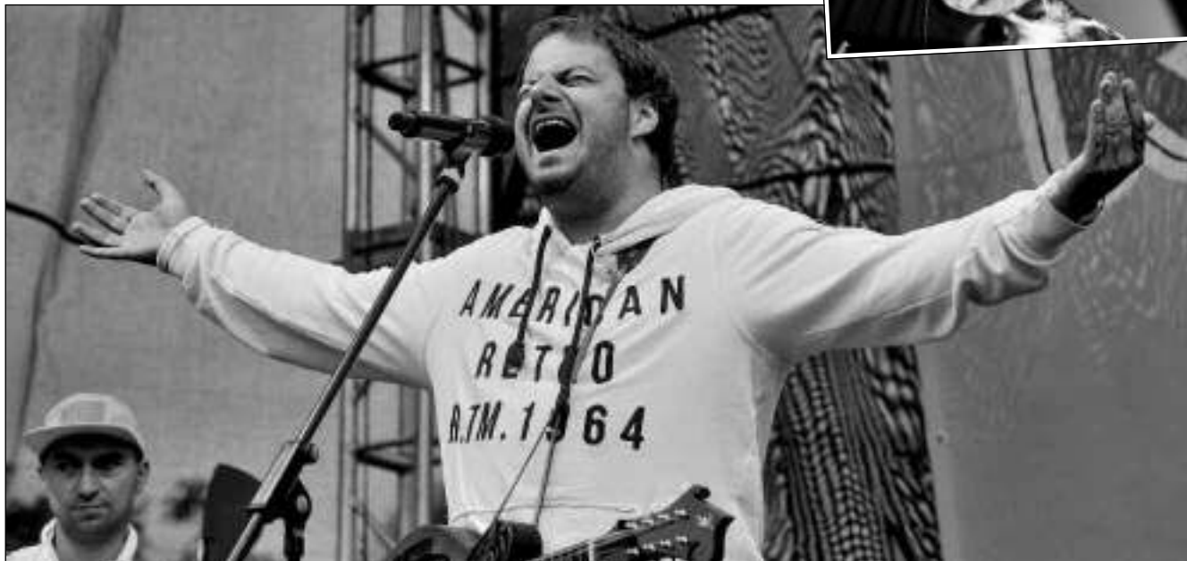
XINDL V ČERNOŠICÍCH. Kapela Chinaski, Michal Hružka či Xindl X zahráli a zaspívali na velkém koncertu v Černošicích. (Viz strana 4)