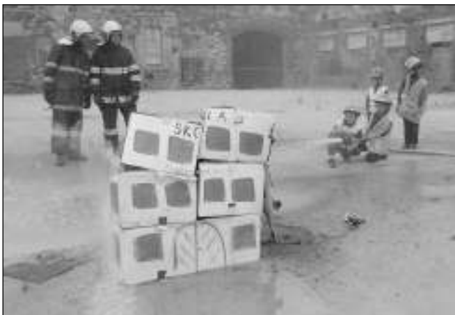
HASILÍ ŠKOLU. Nejmenší liteňští hasiči při ukázce hašení požáru papíro- vé »školy«.