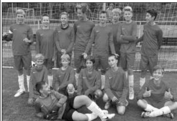
ŽÁCI. Spojené družstvo starších žáků Řevnic a Černolic, které v sobotu 5. září porazilo Dobříč rekordním rozdílem 21:1. Hráči podali skvělý výkon a zaslouží si gratulaci.