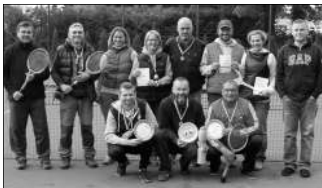
TENISTÉ. Část účastníků svinařského turnaje.

Když jsme se letos v květnu na kurtech sešli, během pár minut se přihlásilo jedenáct dvojic, které se chtěly turnaje zúčastnit. Systémem každý s každým na dva vítězné sety se pak hrálo od května do konce prázdnin. Myslím, že mohu za všechny účastníky říct, že jsme si turnaj užili, skvěle si zahráli, zapotili se, zasmáli se a leckdy si i pěkně pocuchali nervy. Mínlou nedělí jsme se dočkali slavnostního vyhlášení vítězů. Zlatou medaili a originální putovní po-