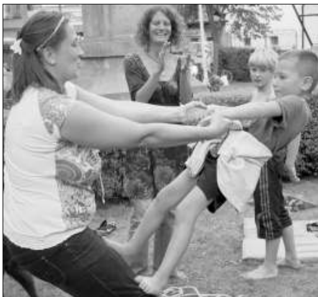
NA NÁMĚSTÍ. Na řevnickém náměstí si malí i velcí mohli vyzkoušet nej-různější aktivity.

Bylo toho opravdu hodně, co lidé zblízka i zdaleka umějí a co přišli 5. září na řevnické náměstí předvést. Kdyby někdo i přes ten obrovský výběr přeci jen fyzicky či duševně strádal, mohl si zajít do některé z místních restaurací na »hravě a zdravě« menu nebo si zahrát velkou rodinnou hru, během níž soutěžní týmy navštívily různé sportovní a kulturní organizace. Tam musely pro zí-