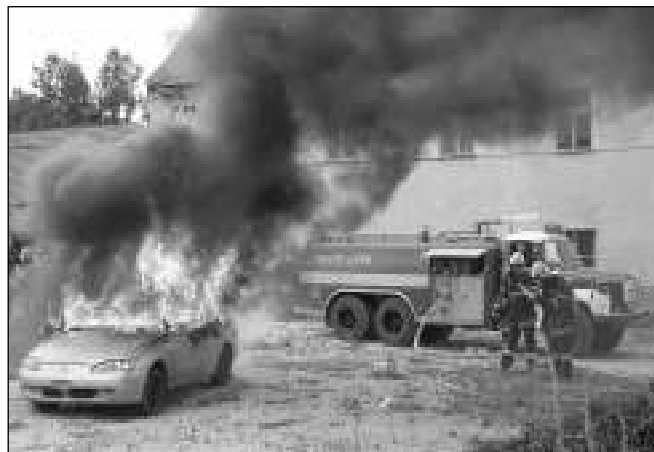
HASILÍ AUTO. Dospělí liteňští hasiči divákům předvedli zásah u hořícího automobilu.