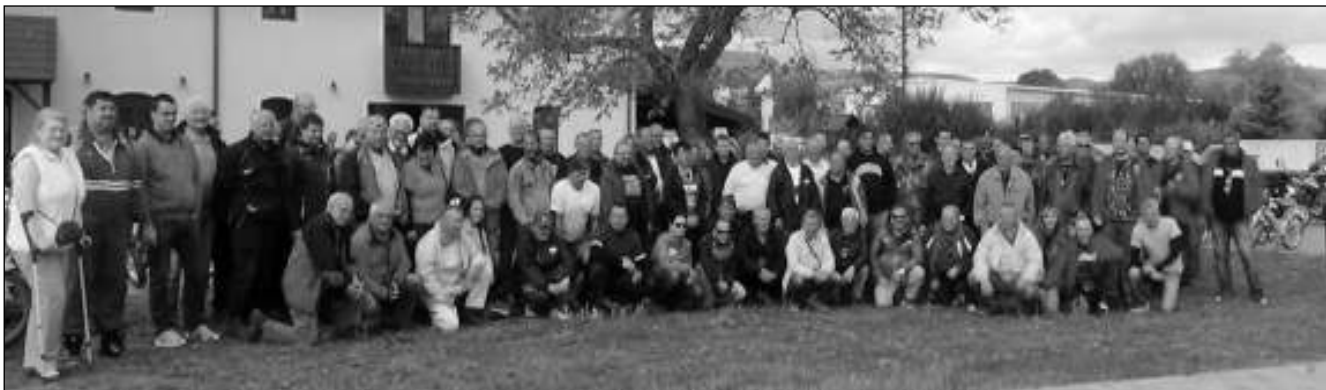
HLAVA NA HLAVĚ. Sto sedm jezdců se zaregistrovalo na jubilejní spanilou jízdu pořádanou svinařskými mopedáky.