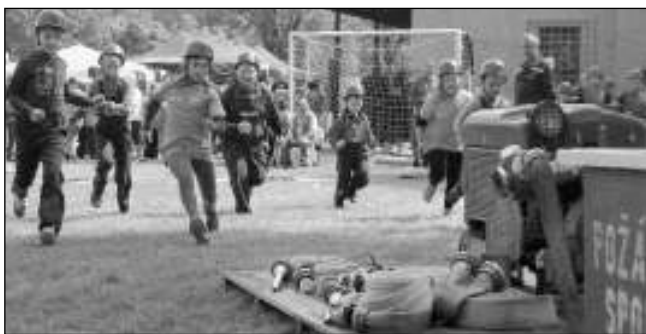
ÚTOK. Cvičení hlásnotřebaňských Plamíneků.