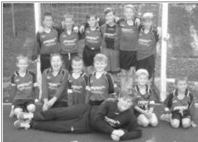
HÁZENKÁŘŮM SE DAŘILO. V sobotu 19. září přivítali řevničtí »národní« házenkáři na domácím hřišti Čakovice. Mladší koeduci (na snímku) vyhráli 16:5 a 12:3. Posilou jim byli mladší žáci z přípravky Čenda, Martinek a Oliver. Starší žáci vyhráli 15:6 a muži 16:12. Mladším žákům byly předány stříbrné medaile za druhé místo, které vybojovali v sezoně 2014/2015. V neděli 20. 9. zvítězili mladší žáci na turnaji v Podlázkách. Bakov porazili 18:3 a Podlázky 18:10. Doufáme, že letošní sezona bude stejně úspěšná, jako ta loňská. Text a foto Štěpánka JANDUSOVÁ, Řevnice

Domáci po dvaceti minutách vedli už 2:0, Čermák stihl jen snížit. (Mák)