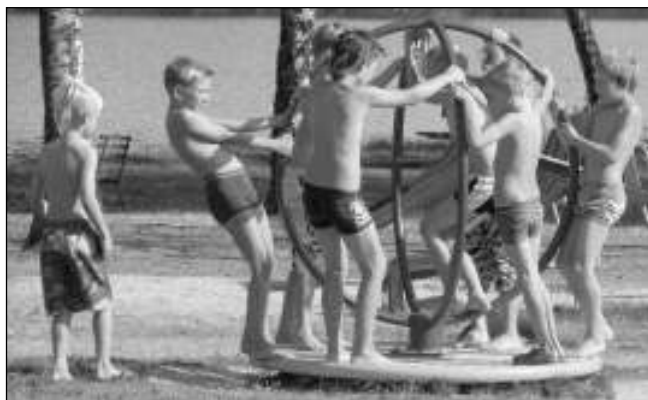
U RYBNÍKA. Výletem k rybníku Babylon si zadnotřebaňští školáci prodloužili prázdniny.

V zadnotřebaňské škole se už pomalu stává tradicí, že děti z kraje školního roku vyjedou na sblížovací pobyt. Letos jsme vyrazili 12. a vrátili se 17. září. Pěkné počasí si prý paní učitelky objednaly a musím potvrdit, že jejich objednávka byla do puntíku splněna. V Peci pod Čerchovem nás přivítal útulný hotel Lesana, děti si ubytování i stravu pochvalovaly. Paní učitelky s paní vychovatelkou se snažily udělat z dětí dobrou partu. Vždyť mezi naše »starousedlíky« dorazili noví prvňáčci a dva chlapečci nám přešli do 3. ročníku z jiných škol. Děti se zabývaly různými činnostmi, které posilují kolektivního ducha - přesně podle motto naší školy: Všichni jsme na jedné lodi. Kromě her jsme se seznámili s chodskými tradicemi: keramikou, kroji i