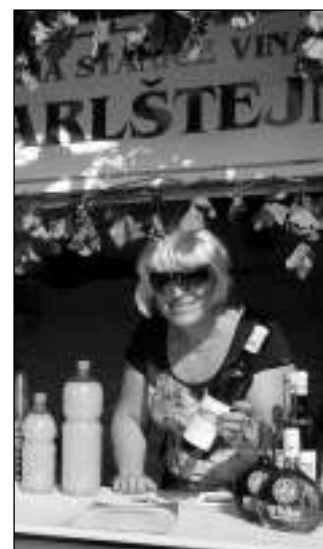
NA TRZÍCH. Stánek karlštejnských vinařů na hrnčírských trzích, které se konaly v polovině září v Berouně.