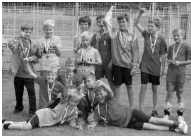
VÍTĚZOVÉ. Přípravka Letů, která na karlštejnském turnaji obsadila první a třetí místo.