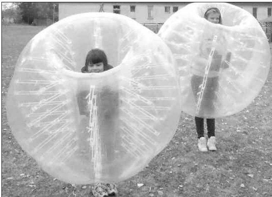
BUMPERBALLS. Hlavní atrakce posvícenského odpoledne v Osově.