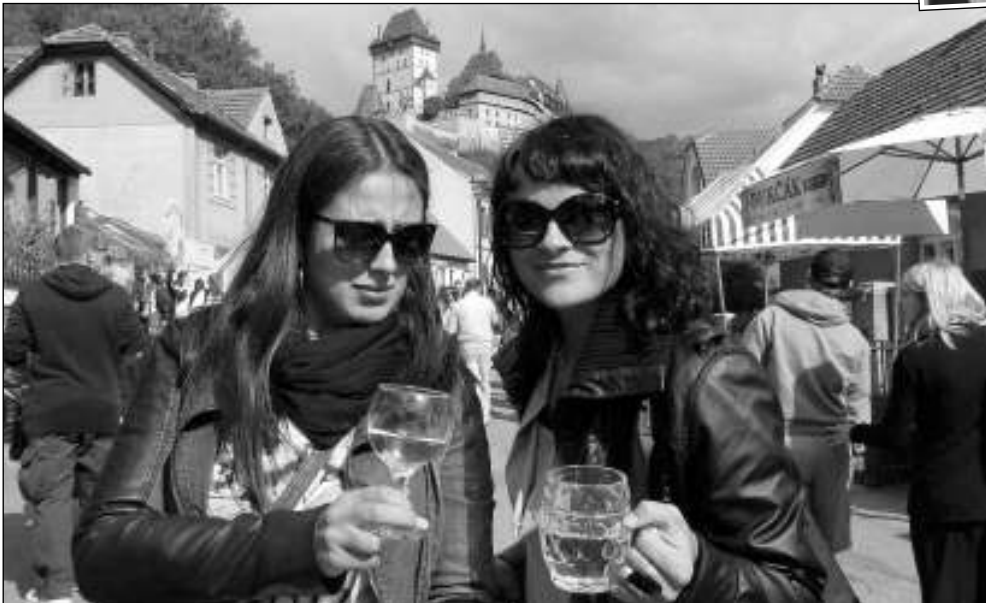
NA VINOBRANÍ. Tisíce návštěvníků dorazily poslední zářijový víkend na Karlštejnské vinobraní. Burčák tek l proudem, víno se pilo z pohárů i sklenic. (Viz strana 7)

29. září 2015 - 19 (657) Cena výtisku 7 Kč