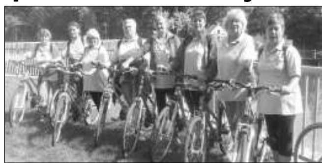
CYKLISTKY. Holky v rozpuku na cyklistickém výletě.

Po tomto neskutečném výkonu jsme potřebovaly trochu relax, a tak přišel na paškál bazén a vířivka.