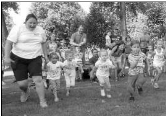
TEĎ! Start jedné z dětských kategorií letošního závodu Karlštejnská devítka v místním kempu.

Dopoledne byl kemp plný povzbuzujících rodičů, kteří přivedli své ratolesti závodit. Někteří se sami běhu zúčastnili, což naplňuje cíl akce: Táta, máma, děti na jednom místě při společné aktivitě a vzájemné podpo-