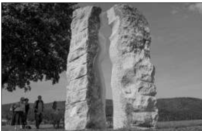
NOVÉ SOCHY. Originální sochořadí mezi Dobřichovicemi a Karlíkem se rozrostlo o nová díla.

Dobřichovické Sochařské symposium je prestižní akcí, která je mezi sochaři velmi uznávaná. Sdružení sochařského symposia společně s