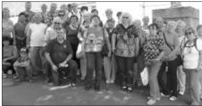
V CHAMU. Zadnotřebaňští zahrádkáři na zájezdu.

Vyjždělo se ráno v 7 hodin a přes Řevnice, Svinaře, Skuhrov i Liten jsme mířili na dálnici směr Plzeň. Na hradě a zámku Klenová nás milá průvodkyně seznámila s historií i současností objektu, kde se nachází část výstavy z klatovské galerie U Bílého jednorožce. Z terasy hradu jsme se pokochali nádherným výhledem do okolí Janovic nad Úhlavou. Dále nás čekala návštěva Zmrzlin-kárny v Janovicích, kde měli otevře-no pouze kvůli nám. Pochutnali jsme si na výborné domácí zmrzlíně se šlehačkou a čokoládovou polevou. Padl návrh, že bychom v tomto duchu mohli pokračovat na každém