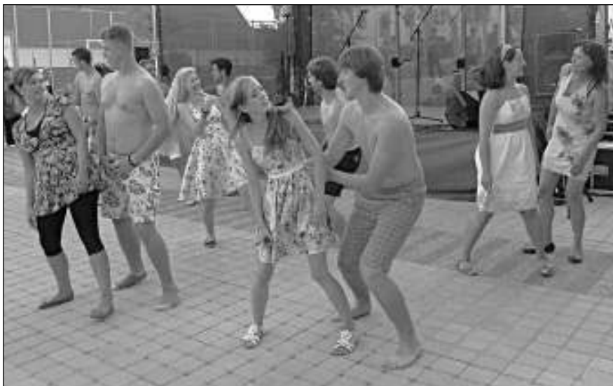
MAMMA MIA. Taneční skupina Jakuba Suchého pobavila návštěvníky kuchařských slavností vystoupením s názvem Mamma Mia.