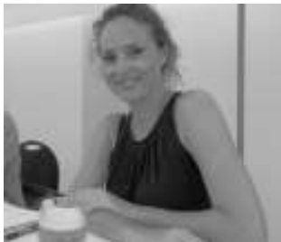
AUTORKA. Markéta Hrubešová ve Všeradicích.

Všeradice - Velké ovace publika si na kuchařských slavnostech ve Všeradicích vysloužila známá herečka Markéta HRUBEŠOVÁ. Důvod? Pokřtila tu svoji kuchařskou knihu sestavenou z receptů nejslavnější české kuchařky, všeradické rodačky M. D. Rettigové. Na váš podpis do knihy Markéta vaří Rettigovou se stála dlouhá fronta. Měla jste velkou radost? Celý den byl opravdu krásný. Kuchařku jsme pokřtili během tradičního Vaření se zámeckou paní 19. 9. ve Všeradicích. Bylo skvělé počasí,