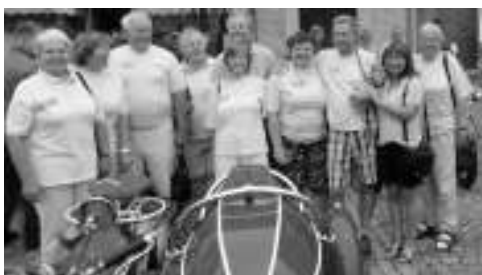
Mopedáci v Krásné Lípě.