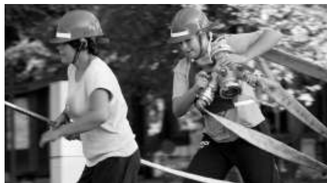
V KEMPU. Řevničtí starší žákyně na hasičských závodech v karlštejnském kempu.

najde nový vedoucí, jenž děti povede dál. Lucie BOXANOVÁ, Svináře