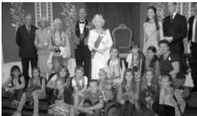
V KRÁLOVSKÉ SPOLEČNOSTI. Osovští školáci v londýnském muzeu voskových figurin.

Někteří již poněkolkáté, a tak se těšili na své kamarády. Jiní však letos přišli vůbec poprvé - bylo jich 19 a jsou to naši PRVNÁČCI! Paní ředitelka je přivítala a popřála jim hodně úspěchů při zvládání písmenek i číslic, třídní učitelka zase předala dětem knížku říkanek jako vzpomínku na první školní den.