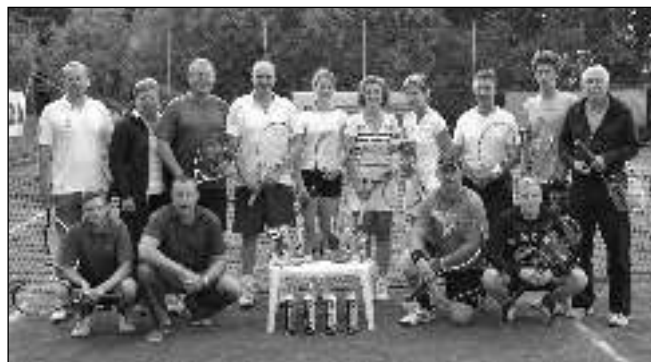
NA KURTU. Účastníci liteňského tenisového turnaje.

Sešli jsme se v počtu 6 párů, což je na jeden kurt ideální počet hráčů. I počasí vyslyšelo naše přání a po celý den bylo opravdu nádherné. Všichni se snažili na dvorci nechat vše, i když to občas tenisové opravdu nevypadalo a někteří hráči dokonce