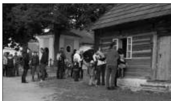
NA NÁVSI. Účastníci pochodu si prohlédli roubenou chalupu i kapličku na vinařické návsi.

V pondělí na svatého Václava za krásného počasí se konal již třetí ročník Pochodu Všeradovou Zemí. Tentokrát jej pořádala obec Vinařice. Připraveny byly dvě trasy - 5 kilometrů pro rodiny s dětmi a 9 km pro náročnější turisty. Obě vedly krásným okolím naší obce a končily v lesním areálu Višňovka, kde jsme připravili pro děti řadu atrakcí s ohňáčkem a opékáním buřtů. Děkuji za organizátory všem účastníkům - a letos se jich sešlo na sto! Mohli jsme si spolu s našimi dětmi užít krásný den v přírodě a už se těšíme na další ročník pochodu. Radek FLOREK, Vinařice