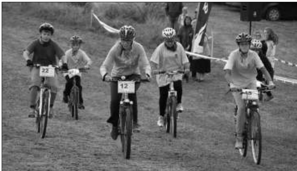
NA TRATI. Účastníci letošního dětského cyklomaratonu.