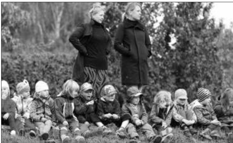
NA HRÁZI. Předškoláčky s doprovodem sledují ukázkou výcviku psů.

V sobotu 26. září se v Letech konal 8. ročník Podzimního obranářského závodu. Byla to jedna z nejlepších akcí, kterou místní kynologové uspořádali. Závodit přijelo 37 závodníků v šesti kategoriích, což je velmi slušné. Sluníčko sice moc nesvítilo, skoro celý den bylo pod mrakem a trochu foukalo, ale nezmokli jsme. Pro závodění se psy ideální počasí! Celý den bylo na co se dívat. Psovodi se svými psy předváděli v jednotlivých kategoriích podle obtížnosti sestavy cviků v poslušnosti i výkony v atraktivní disciplíně obrana. V obtížnějších kategoriích závodili hlavně němečtí ovčáci, ale také dobrman, rotvajleři, belgický ovčák malinois. Pěkné výkony předváděly border colie, holandský ovčák a dokonce i labradorský retrív. V nejnižší kategorii byla plejáda ras nejšířší. K vidění byl výkon amerického stafordšírského teriéra, cane corsa, maďarského ohaře, parson russela teriéra a dokonce i čivavy. Ze 37 závodících dvojic bylo 17 z naší organiza-