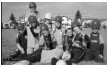
V OLEŠNĚ. Malí hlásnotřebaňští hasiči na závodech v Olešné.

Náš sbor postavil dvě družstva mladších žáků a dívčí dorostenecké družstvo. Naši nejmenší měli čas 34 a 38 minut - po součtu trestných bodů a časů obsadila družstva mladších z Hlásné Třebaně v konkurenci třiceti celků 11. a 13. místo v běhu požárnícké všestrannosti. Po pauze čekala mladší družstvo ještě štafeta požárních dvojic. Ta se počítá do jarního kola hry Plamen, takže si na výsled-