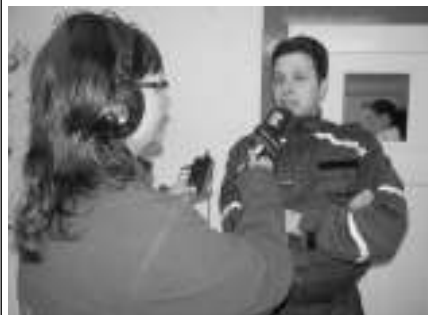
V HLÁSNÉ. Loni Český rozhlas natáčel u hasičů v Hlásné Třebani.

Vybavení a výstroj za celkem 300 tisíc korun čeká na dobrovolné hasiče, kteří se umístí na prvních třech místech v republikovém finále soutěže Českého rozhlasu (ČRo) Dobráci roku. O vítězných týmech hasičů z jednotlivých regionů budou rozhodovat hlasy obyvatel měst a obcí.