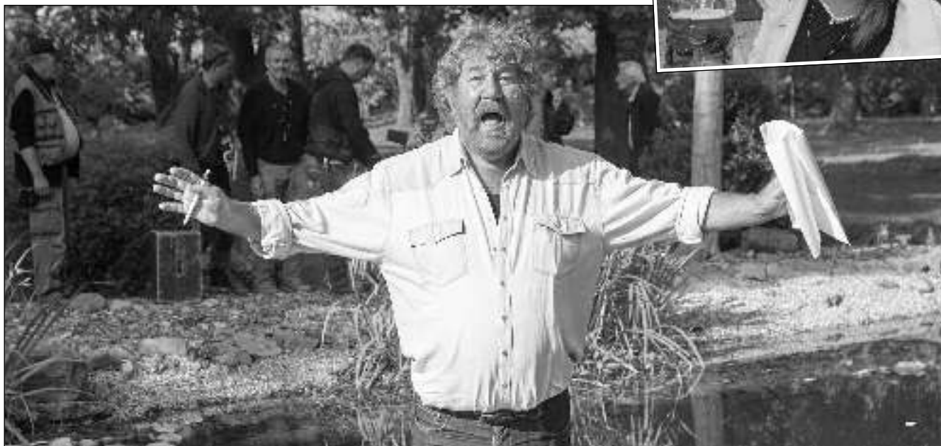
NATÁČEL V LITNI, TEĎ JE V ŘEVNICÍCH. Režisér Zdeněk Troška natáčí v našem kraji nový rodinný film Strašidla . (Viz strana 7)