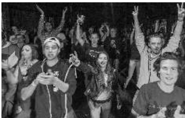
Návštěvníci podzimního Rockového Slunovratu.