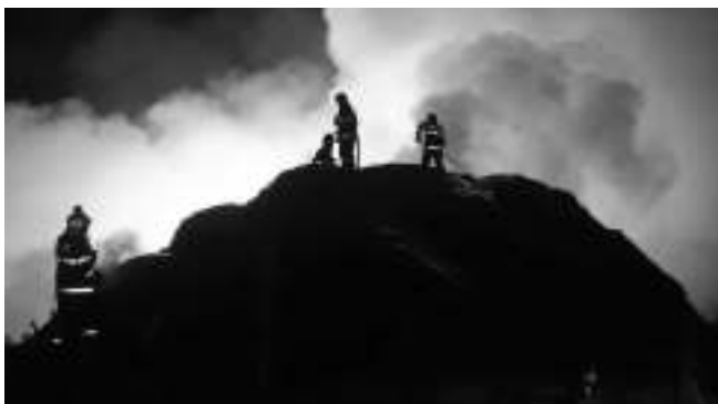
U OHNĚ. Hasiči likvidují požár stohu ve Vižině.

ŠKODA BYLA VYČÍSLENA NA PŮL MILIONU KORUN, UCHRÁNĚNÉ HODNOTY NA OSM MILIONŮ