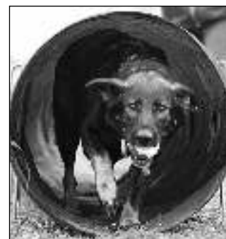
PŘINES! Psi dětem předvedli, co doveďou.