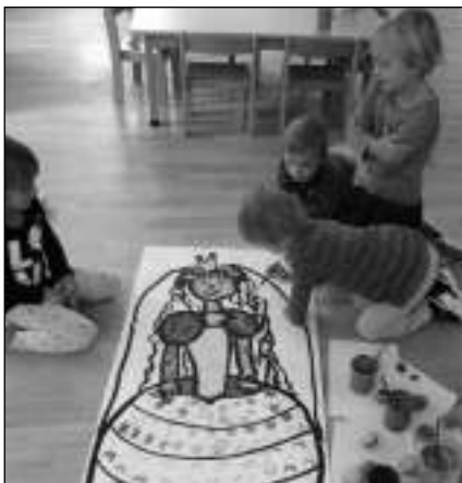
ZDOBILI PRINCEZNY. Zadnotřebaňské děti při zdobení princezny.