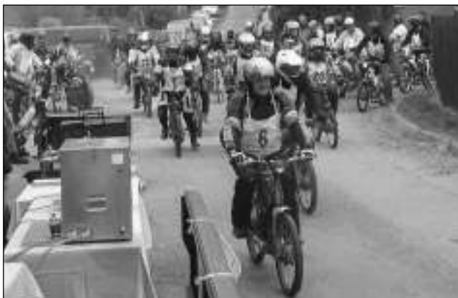
START. Závodníci startovali u svinařské hospody.

V sobotu 26. září se tedy sjeli mopedáci a jejich příznivci tradičně k hostinci U Lípy. Po přihlášení a přejímce strojů (zda je upravený, nebo neupravený) byl závod ve 14 hodin letným startem zahájen. Za běžného provozu se jelo po trase Hodyně -