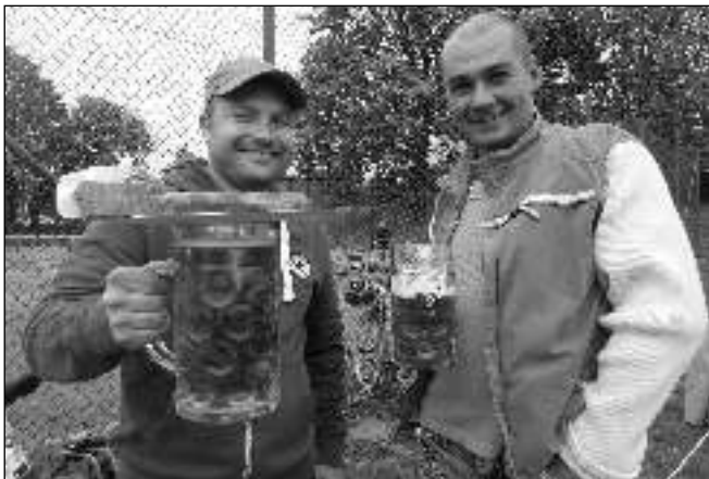
TUPLÁK A KLOBÁSA. Dva ze spokojených hostů letošního Svinářského Oktoberfestu.