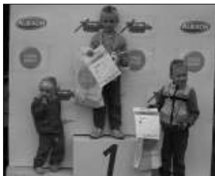
VYHRÁLI. Vítězové jedné z kategorií všeradičského cyklomaratonu.