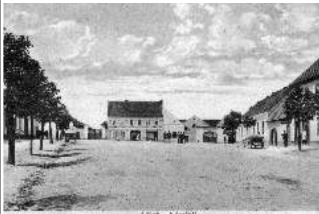
Nedatovaný pohled vydaný nákladem obchodníka S. Zdrůbka zachycuje tehdejší podobu liteňského náměstí.

Se zajímavými záběry Litně vás prostřednictvím své sbírky starých pohlednic seznamuje obyvatel městyse, sazeč a dobrovolný hasič Lukáš MÜNZBERGER.