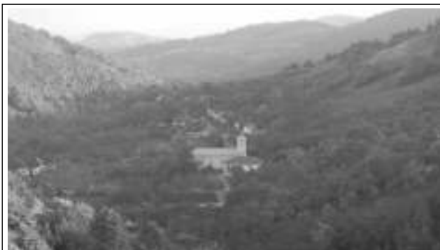
U KRAJANŮ V GERNÍKU. Havelské posvícení oslavili v polovině října čeští krajané, kteří obývají rumunskou ves Gerník rozkládající se v kopcích nad Dunajem (foto 1). Mohutné oslavy se v této partnerské obci Všeradic protáhly na několik dní. Jedním z jejich vrcholů byla nedělní mše sva-