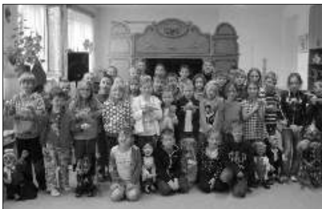
VE ŠKOLCE. Karlštejnští školáci v místní školce zhlédli dvě divadelní představení.

* Sbírku použitého ošacení bude v listopadu v Karlštejně organizovat občanské sdružení Diakonie Broumov. O přesném termínu akce budete včas informováni. (per)