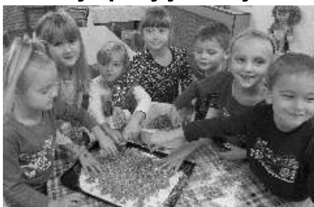
MALÍ KUČAŘI. Karlštejnští předškoláci si ve školce upekli jablečný koláč.

Jablečný koláč dětí z MŠ Karlštejn: 40 dkg hl. mouky, 15 dkg cukru moučky, 14 dkg tuku, 2 vejce, prášek do pečiva, mléko dle potřeby, citronová kůra. Marcela HAŠLEROVÁ, Mateřská škola Karlštejn