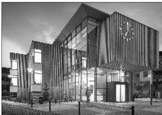
STAVBA ROKU. Dostavba dobřichovické školy.

POŽIL KONOPI. Motorkáře, který byl pod vlivem Canabis, zadrželi při běžné kontrole v Karlštejně místní »státní« policisté. Řidiči byla zakázána další jízda a bylo s ním sepsáno oznámení o přestupku. (heš) SRAŽKA U MOSTU. Auto s motorkou se srazily 22. 10. na křižovatce u mostu v Karlštejně. Po ošetření lékařem byl řidič motocyklu převezzen řevnickými záchranáři se středně těžkým zraněním do nemocnice. (bob) NAŠLI MRTVÉHO. K otevření bytu v Karlštejně byli 16. 10. povoláni policisté a fevničtí profesionální hasiči. Po otevření byla uvnitř nalezena mrtvá osoba. Případ šetří policie. (pav) BĚŽEC V TRENÝRKÁCH. Oznámení o muži, který v černošické Měsíční ulici pobíhá v trenýrkách přijala 20. 10. po polední místní městská policie. Mladík se situaci snažil strážníkům vysvětlit a zdůvodňoval ji neodkladnou tělesnou potřebou. Byl strážníkům poučen, aby příště vyhledal odlehlejší místo. (duš)