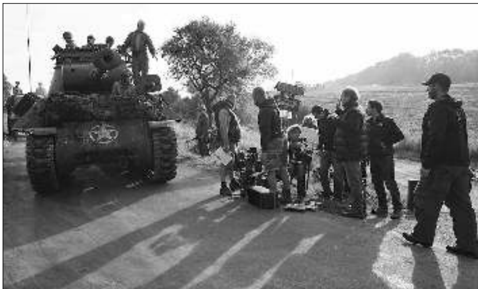
V AKCI. Americký tank a filmový štáb při natáčení u Vinařic.