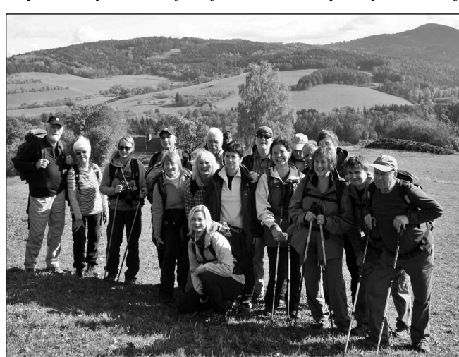
Turistická výprava na pastvinách nad Sušicí.

kde byl naplánován oběd. Po něm nás čekal neuvěřitelný stoupák do Smí. Zde se nachází nádherně opravený šindelový kostel Nejsvětější