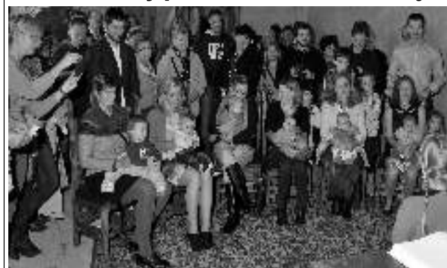
NOVÍ KARLŠTEJŇÁCI. Víťání občánků se konalo v sobotu 24. října na hradě Karlštejně.