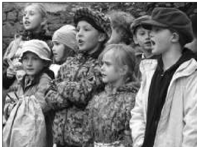
NA POSVÍCENÍ. Vystoupení dětí ze školy.

Velké poděkování všem, kteří přispěli ke zdárnému průběhu akce, i těm,