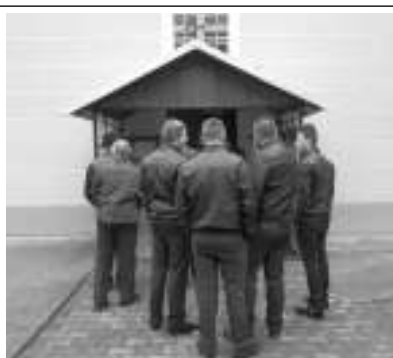
tá, kterou před zaplněným, nedávno opraveným kostelem česko-rumunský celebrol místní farář. Na bohoslužbě z přibližně tří stovek obyvatel Gerníku chyběl opravdu málokdo - jako poslední těsně před začátkem dorazili zdejší mladíci (foto 2). Součástí oslav byly i dvě taneční zábavy, na kte-