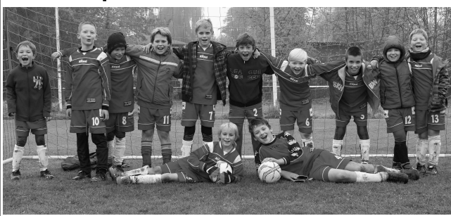
Poslední podzimní zápas na domácím hřišti sehrála v sobotu 24. října starší příprava Revnic. Úhonic rozdrtila 5:0.

ky. Ve 2. půli už Dobřichovice dominovaly. Další gól zaznamenal opět Plzák v 60. minutě. V 76. minutě převzal Smiovský těsně za půlící čarou míč a postupoval jako tank středem hřiště... Žádný z několika protihráčů, kteří na něj dotírali, mu ho nedokázal vzít ani ukopnout! Na hranici velké vápna vypustil prudkou střelu k tyči a bylo to 4:1! (oma)