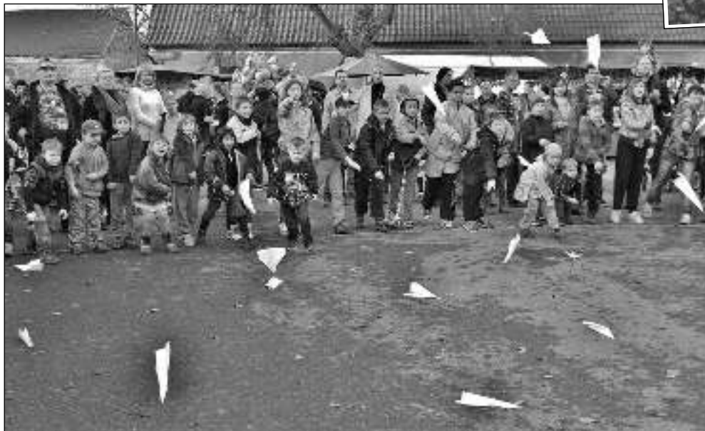
VLAŠTOVKY NA POSVÍCENÍ. Stovky diváků dorazily 7. 11. na návěs v Letech, kde se za krásného počasí konala oslava Martinského posvícení. Připraven byl bohatý program; děti mj. házely »vlaštovkou«.