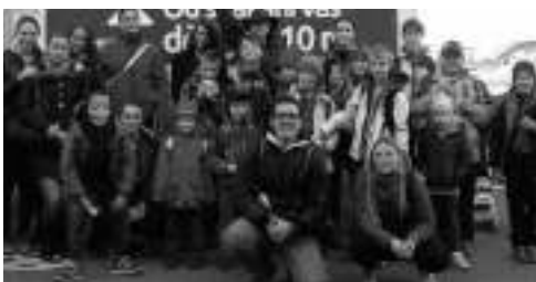
Hlásnotřebaňská výprava v Praze.