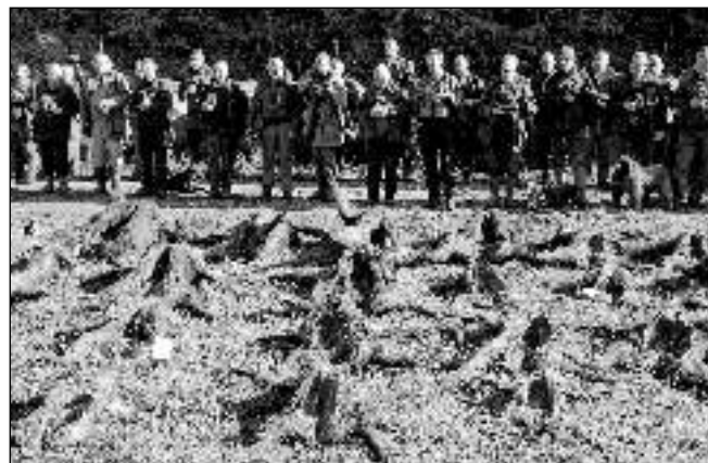
PO LOVU. Řevničtí myslivci s vyvrženými divočáky, které střelili u zdejším tůní 24. října.

Za mlhavého rána 24. října se sešlo 42 lidí, aby pokračovali v zářijových loveckých úspěších. Cílem byla lokalita okolo řevnických tůní. Ohledávka terénu prozradila, že tam v té době zalehlo větší množství divočáků. Tůně byly v několika řadách obstoupeny a lov začal. Byl obzvláště nebezpečný pro malé vzdálenosti a nedobrou viditelnost. Nic se však nepříhodilo. Lidé bydlící v blízkosti se domnívali, že na tůně přiletělo větší množství kachen, tolik ran padlo. Výsledek: sloveno 22 divočáků a jedna liška. Myslivci se ještě prošli po stránkách nad tůněmi, ale už bez loveckých úspěchů. V letošní sezoně, která představuje zatím sedm měsíců, slovíli myslivci 108 divočáků. Tolik se kdysi lovilo koroptví! Další nátláčka je plánována na 28. 11. František ŠEDIVÝ, Revnice