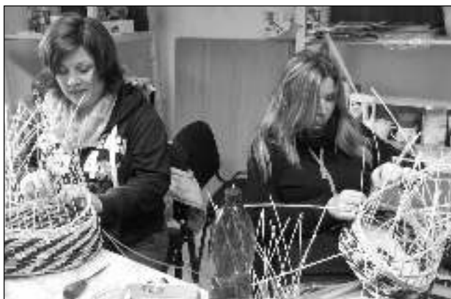
RELAXACE S KOŠÍKY. Jednou z aktivit liteňského Domečku je relaxační odpoledne s pletením košíků.

Tradiční a hojně navštěvovaný liteňský školní ples (10. února) je určen výhradně pro mladé dámy a pány, žáky liteňské základní školy. Mezi nimi již nyní vládne nervozita, kdo že bude nový král a královna. Několik dní po takto výjimečné události odjíždíme, již po osmnácté, na zimní expedici do hor - tentokrát budeme