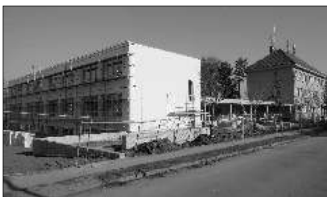
BRZY BUDE HOTOVO. Před dokončením je přístavba řevnické základní školy. Stavební práce mají hotově do konce listopadu. V dalších měsících bude podle webových stránek školy následovat vysoušení nové budovy, pokládka linolea a vybavování učeben.

Výčet pochybení paní magistry Seidlerové, o kterých pan Sudek hovoří jako o zcela nepodstatných či vykonstruovaných, začal na jaře roku 2014. V protokolu Inspektorátu práce pro Středočeský kraj, který navštívil školu na základě podnětu odborové organizace zaměstnanců školy, se konstatuje hned několik porušení zákona č. 262/2006 Sb. Za nejzávažnější lze považovat nerovné zacházení a netransparentní odměňování zaměstnanců. Ředitelka školy totiž vyplatila svým dvěma zástupkyním zcela nadstandardní odměny. Inspektorát práce se zabírá především pracovníprávními vztahy mezi zaměstnavatelem a zaměstnanci, tudíž primárně řešil nespravedlnost poměru, ve kterém byly peníze rozděleny: jeden zaměstnanec dostal odměnu 215 000 Kč za 4 měsíce práce a jiný 500 Kč za celý rok. Za tuto zřejmou nerovnoměrnost udělil kontrolované osobě sankci 30 000 Kč. Sankční řízení nakonec musel zastavit z důvodu uplynutí roční lhůty na vypořádání, a tím se záležitost nespravedlivého odměňování, ač nedo-