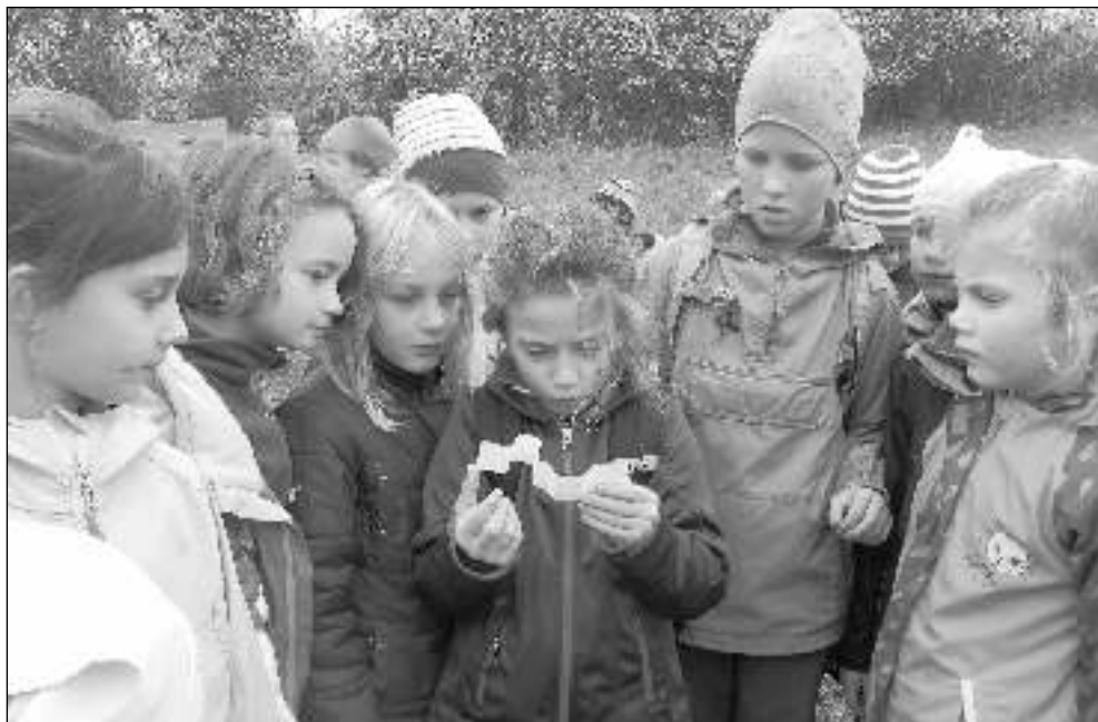
NA VÝLETĚ. Liteňští školáci v přírodě.

Tento školní rok pracoviště v Litni otevřelo celkem šestnáct zájmových kroužků v oblastech sportovních, výtvarných, jazykových a společenských, kde se schází pravidelně sto šedesát dva dětí. (Dokončení na str. 8)