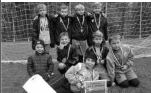
Další úspěch si připsala fotbalová příprava FK Lety. Ve skvěle obsazeném turnaji, kterého se v Benátkách nad Jizerou mj. zúčastnily týmy Jičína, Mladé Boleslavi, Kolína, Berouna, Xaverova či Vlašimi, se probodovala až do finále. V něm podlehla klukům z Jablonce nad Nisou.

množství šancí se podařilo skórovat opět jen Šlapákovi ve 39. minutě. To se mohlo hostům vymstít, protože domácí hned po přestávce z první akce snížili. Naštěstí se Dobřichovice probudily a znovu opanovaly hrací plochu. V 75. minutě poslal Halenka dlouhý pas do křídla, na Plzáka. Jeho úprk po lajně pomali obránci nezachytili, takže zamířil do pokutového území a z úhlu prostřelil bezmocného gólmána - 1:3! Domáci už se na