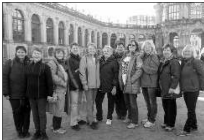
V DRÁŽDÁNECH. Holky v rozpuku v drážďanském barokním areálu Zwinger.

Minuli jsme Rathen, Wehlen, viděli jsme rezidenční město Pirna i pozoruhodný hrad tyčící se na kopci Sonnenstein. Cesta z Děčína do Drážďan měří 67 km, loď trvá 4,5 hod. Ale krásně nám to uteklo a začala prohlídka Drážďan. Někteří si možná pamatují na trosky v centru města po náletech v roce 1945. Dnes je vše nádherně opraveno. Prošli jsme Zwinger, komplex muzeí a obrazáren, obdivovali novorenesanční Semperovu operu, která byla zničena dokonce dvakrát - jednou požárem a pak během bombardování. Znovu otevřena byla v roce 1985. Pěkná je i katedrála Nejsvětější Trojice, nazývaná Hofkirche, největší chrámová stavba v Sasku. Kostel Frauenkirche je asi nejnámější dominantou města. V roce 1945 byl zničen a jeho trosky ponechány jako připomínka hrůz války. Po sjednoce-