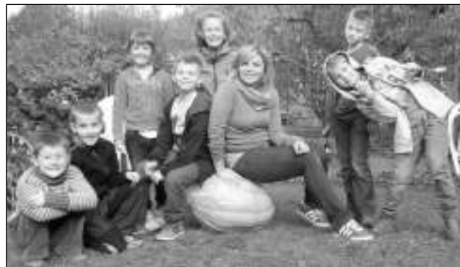
S MAXIDÝŇÍ. »Družinové« děti na školní zahradě.