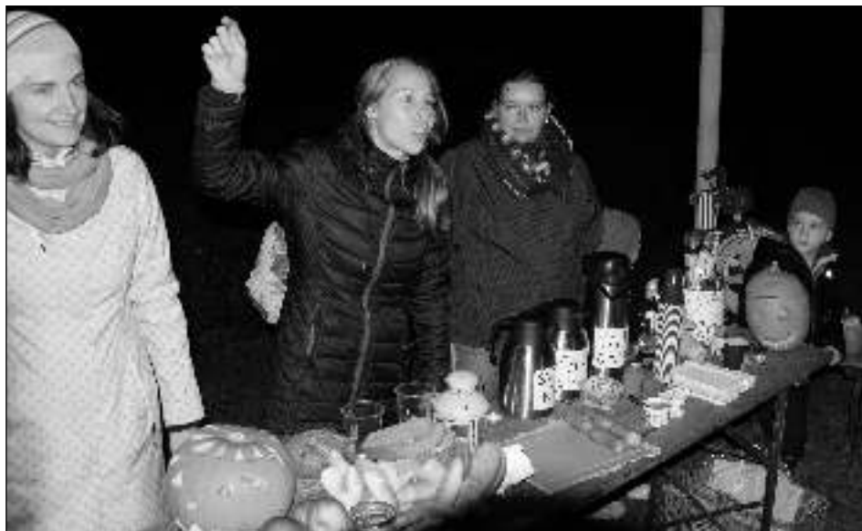
NA NÁVSI. Pohoštění po průvodu bylo připraveno na všeradické návsi.