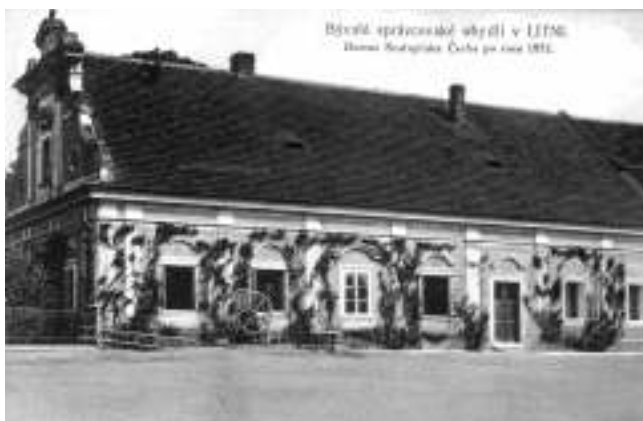
Pohlednice zasláná v roce 1928 zachycuje tehdejší podobu bývalého spřávcovského obydlí v Litni.