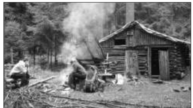
NA OSADĚ. Roveři v trampské osadě Zelené Šišky.