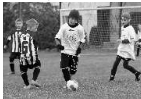
POSLEDNÍ TURNAJ. Malí všeradičtí fotbalisté v zápase se Zdicemi.