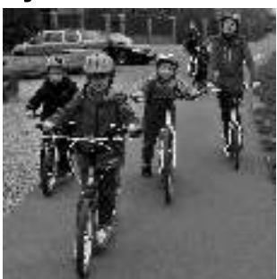
Koloběžkového výletu, který uspořádal řevnický spolek Kalamář, se zúčastnilo 13 dětí. Vlakem se vydaly do Radotína, kde »osedlaly« stroje a vydaly se 14 km po cyklostezce zpět do Řevnic. Cestou plnily úkoly a dočkaly se i zmrzliny či dortíků v cukrárně. Cestu zvládli na jedničku všichni, i nejmladší, pětiletý Pepík.