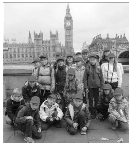
NA BŘEHU TEMŽE. Zadnotřebeňští školáci v Londýně.