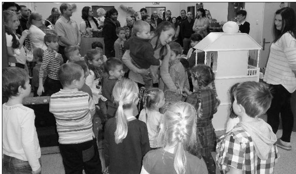
PLNO. Na slavnostním otevření rekonstruované školky byla hlava na hlavě.