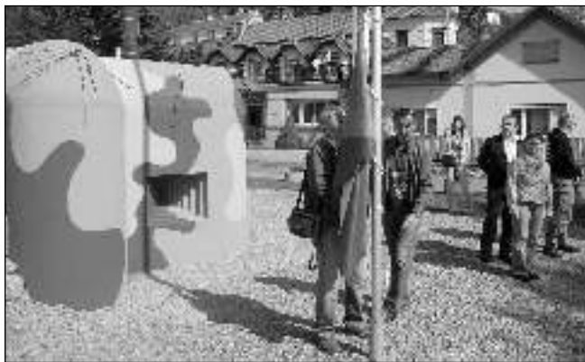
Museum lehkého opevnění Karlštejn bylo slavnostně otevřeno letos 8. května, v den výročí konce druhé světové války.

Bunkr se letos rozloučí s veřejností o první adventní neděli (29. 11.), kdy se v Karlštejně bude konat zahájení tradičního Královského adventu. V rámci muzejní stezky budou tento den otevřena všechna místní muzea, včetně obou zde stojících pevnostních objektů - státního hradu a Muzea lehkého opevnění Karlštejn (M.L.O.K.). Již teď se těšíme na no-