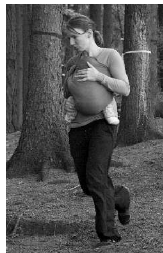
MEZI STROMY. Lesní běh absolvovaly všechny věkové kategorie závodníků.