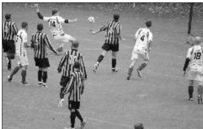
A ZASE VÝHRA. Karlštejní fotbalisté (ve světlém) v zápase s Novým Jáchymovem, který na hřišti soupeře vyhráli 3:2.

ším střelcem je s devíti zásahy Erik Klusák. Ani tentokrát se mužstvo bohužel nevyhlo zraněním, která po-