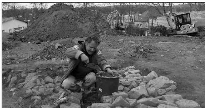
PRŮZKUM. S výsledky archeologického průzkumu, který předchází výstavbě, bude veřejnost seznámena na přednášce.