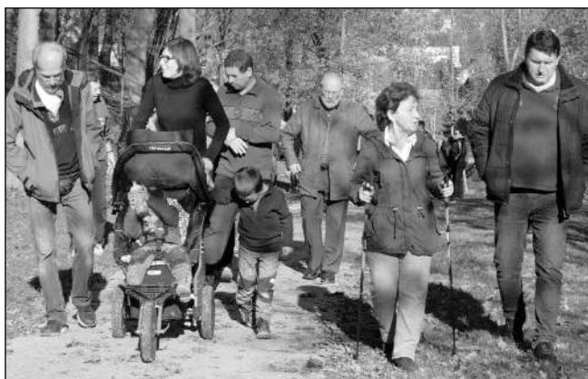
NA PROCHÁZCE. Komentovaná procházka po revitalizovaném řevnickém parku.