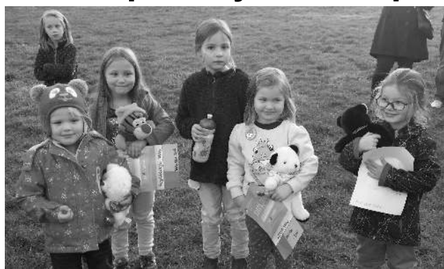
S ODMĚNAMI. Malí účastníci drakiády.