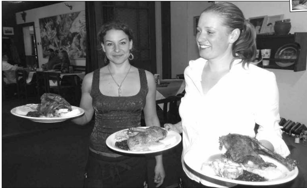
AŽ ŽLJE MARTIN! Slavnost svatomartinských vín se konala 11. 11. (od 11.11) v Karlštejně. Kromě první letošní tekuté révy mohli hosté ochutnat i tradiční martinské husy. (Viz strana 7)

„Minulý týden dostala obec Zadní Třebaň oznámení o prodloužení uzavírky silnice III/11517. Jinými slovy to znamená, že rekonstrukce mostku přes Bělečský potok se výrazně protáhne - podle dodavatele až do 15. 3. 2016.“ uvedl zadnotřebaňský zastupitel Jiří Petříš. Zastupitelstvo s tím podle něj sice nesouhlasí, ale protože se jedná o investici kraje na silnici, která obci nepatří, nemůže s tím nic dělat. „Vzhledem k tomu, že považujeme dobu 7 měsíců pro rekonstrukci mostu za absurdní, obrátíme se na média, aby informovala o (ne)průběhu rekonstrukce, která již téměř čtvrt roku komplikuje život nejen občanům Zadní Třebeň,“ dodal Petříš. (mf)