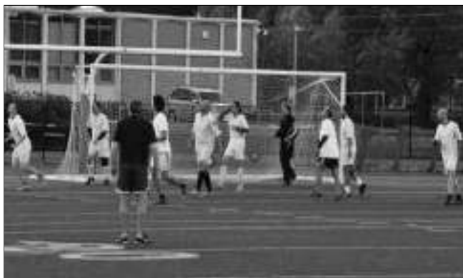
NA HRŠTI. Zadnotřebská stará garda v jediném zápase, který v Seattlu sehrála.

Díky pracovitosti vedoucího výletu jsme prakticky nevynechali žádné významné místo v Seattle. Navštívili jsme také Space Needle, vyhlídkovou věž, která je zároveň dominan-