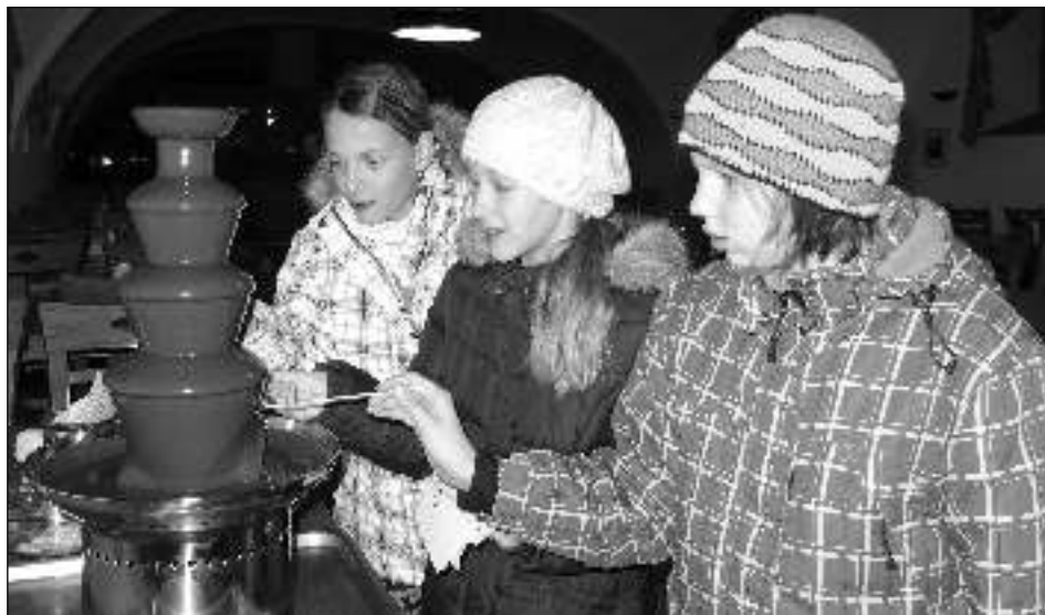
FONTÁNA. O čokoládu z fontány měly zejména děti velký zájem.