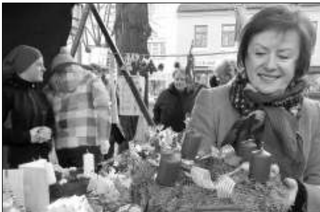
VÁNOČNÍ TRHY. V Řevnicích na náměstí Jiřího z Poděbrad se 5. 12. konaly vánoční trhy. O kulturní program se postarali bubenicí, soubory Proměny, Klíček, Notičky, zazněly vánoční zpěvy i jazz. Na náměstí byla spousta stánků s vánočními dekoracemi či dobrotami, k mání bylo jmelí i vánoční stromky. Nakonec přišel Mikuláš. (pef)

Na Presentaci výsledků průzkumu, která se konala 26. listopadu v Clubu Kino, jsme se dozvěděli, že skoro polovina obyvatel je s rozvojem města za posledních pět let spokojena a dění ve městě aktivně sleduje. Nejvíce hrdí jsme na Berounku a její okolí, architekturu – obzvláště historické vily a kostel. Nejpálčivějším problémem sledujeme dopravu (a to jak železnici, tak místní MHD), situaci v základní škole, nedostatečný počet míst ve školkách a bezpečnost. Často byla také zmiňována nutnost zlepšit fungování policie. V Černošicích nám chybí řemeslné obchody, přirozené centrum/náměstí, prostory pro sportovní a relaxační vyžití ad. Kompletní výsledky průzkumu jsou k nahlédnutí na webových stránkách města. Adéla ČERVENKOVÁ, Černošice