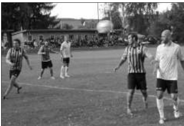
DERBY VYHRÁLI HOSTĚ. V poberounském derby, které se hrálo v září, podlely Lety doma mužstvu Všenor 0:3.

ších žáků mladý a ambiciózní Adam Ježek. Tým poctivě trénuje a je po podzimu na 1. místě s 25 body. Jeho výkony jsou pozitivní a rýsují se noví hráči pro tým dorostu.