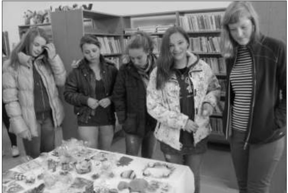
NA VÝSTAVĚ. Předvánoční výstava klientů Koniklece ze Suchomast se konala v liteňské knihovně. Ozdoby z korálků, skleněné svícní, látková srdíčka a další výrobky obdivovali i žáci místní školy.