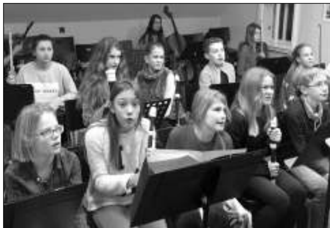
PREMIÉRA SE BLÍŽÍ. Malí dobřichovičtí muzikanti při zkoušce na vánočním představení Louskáček.