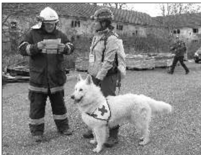
ZÁVODNÍCI. Jeden ze závodních týmů v akci.

Každý figurant dostal své místo, kde byl ukryt, a svou roli. Úkolem figuranta bylo setrvat v úkrytu, který si