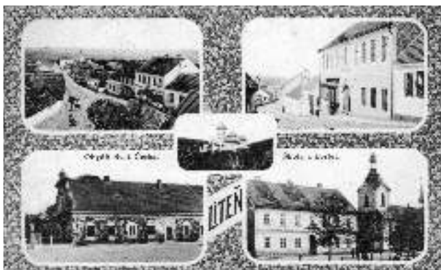
Pohlednice z roku 1925 ukazují zajímavé záběry prvorepublikové Litně.

Se zajímavými záběry Litně vás prostřednictvím své sbírky starých pohlednic seznamuje obyvatel městyse, sazeč a dobrovolný hasič Lukáš MÜNZZBERGER.