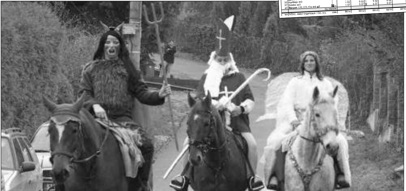
NA KONI. Mikulášské nadělování mělo v našem kraji různé podoby. Do Zadní Třebeň dorazila »svatá trojice« koňmo. (Viz str. 6)

8. prosince 2015 - 24 (662) Cena výtisku 7 Kč