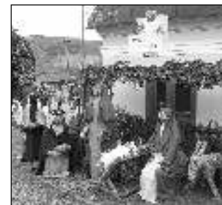
NA NÁVSI. Čenkovský betlém ze sena.

te navštívit až do 6. ledna. V sobotu 12. 12. od 17.00 se tu bude konat každoroční akce Adventní koledování - hodinka plná koled a písní v podání místní hudební skupiny. Po celou dobu bude betlém barevně osvětlen. Jiří FIRÝT, Čenkov