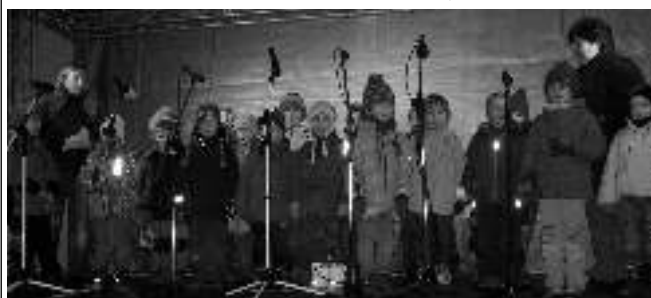
PÁSMO PÍSNIČEK. U vánočního stromu zazpívaly také děti z liteňské mateřské školy.

DOSPĚLÍ SI MOHLI KOUPIŤ VĚNCE, SVÍCNÝ I KERAMIKU, DĚTI VYRÁBĚLY OZDOBY A MALOVALY PŘÁNÍ