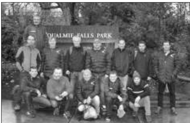
V PARKU. Zadnotřebeňská stará garda na jednom z výletů po okolí amerického města Seattle.

Ubytování bylo velmi spartánské, ve dvou pokojích. Snídaní jsme si museli každé ráno uvařit sami (tedy hlavně usmažit vejce) a k tomu opéct tousty. K dispozici bylo místní, trochu slané nebo arašídové máslo, marmeláda, káva, kousky banánů,