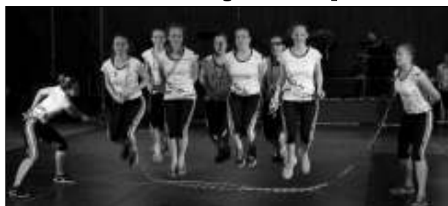
REBELKY. Mistryně světa ve skákání přes švihadlo na dobřichovickém plesu.