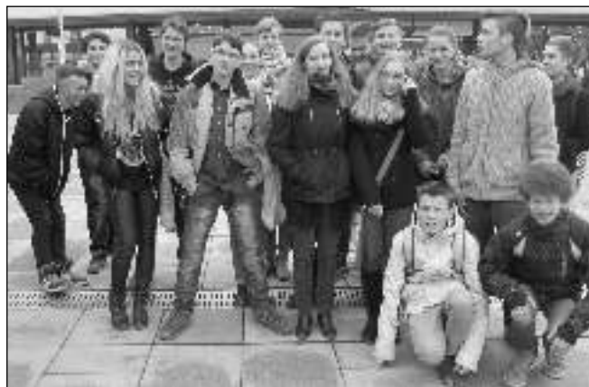
CO BUDEME DĚLAT? Liteňská výprava před pražským Kongresovým centrem.

li příjemně s užitečným a vypravili se na výstavu Schola Pragensis v pražském Kongresovém centru. Setkání se zástupci středních škol a učilišť je pro žáky důležité - mohou se učitelů i žáků dané školy zeptat na