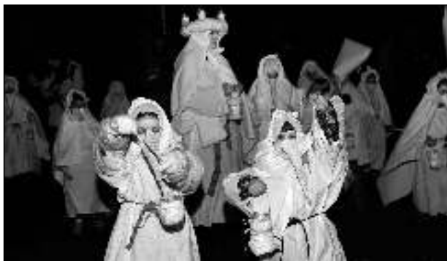
LUCKY. Obchůzka svatě Lucie Litní.

I svátky a slavnosti sv. Lucie jsou tajemnou až strašidelnou atmosférou naplněny. Sv. Lucie byla, hlavně v Čechách, vnímána jako ochránkyně před čarodějnými silami. Den svátku sv. Lucie 13. 12. připadal podle juliánského kalendáře na nejdelší noc v roce, noc sv. Lucie byla spojována s