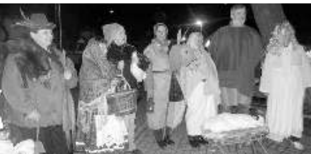
BETLÉM NA NÁVSI. Živý betlém u kapličky v Hlásné Třebani v podání místních Holek v rozpuku.

Rekordní účast nejspíš měla vánoční »Rybofka«, která se již tradičně konala na řevnickém náměstí Jiřího z Poděbrad přímo na Štědrý den. Před zahájením vystoupení ve 13.00 bylo již náměstí zaplněné desítkami svátečně naladěných rodin. Zatímco příležitostný sbor pod taktovkou Lukáše Prchala zpíval před Modrým domečkem slavnou Rybovu mši, posluchači se mohli občerstvit svařeným vínem či pivem. A třebaže počasí vánoční Vánoce nepřipomínalo, nálada panovala víc než sváteční. Tak zase za rok.