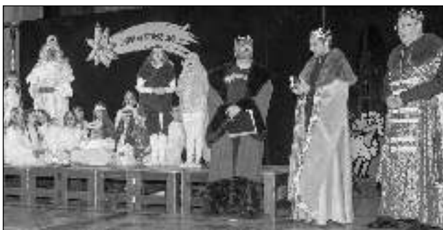
V KATEDRÁLE. Kukadýlko v pražském chrámu sv. Víta.

Shoda šťastných okolností, náhod a dobrých známostí umožnila dětskému divadelnímu souboru Kukadýlko z Dobřichovic vystoupení v posvátných prostorech Katedrály sv. Víta na Pražském hradě. Stalo se tak v úterý 22. prosince od 18 hodin. Když to dnes, s odstupem několika dnů, hodnotím, rozhodně to nebylo to nejlepší, co jsme spolu s malými