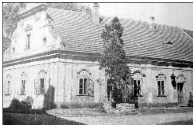
ČECHOVNÁ. V tzv. Čechovně bydlel otec slavného básníka, odtud podnikal malý Svatík Čech své první objevné cesty do okolí, hlavně na náves, kde naslouchal vyprávění sousedů »ve stínu lípy«.