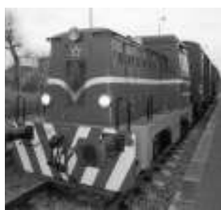
V LITNI. Historický vlak na nádraží v Litni.