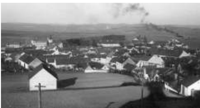
Takový byl pohled na Liteň za první republiky.

Se zajímavými záběry Litně vás prostřednictvím své sbírky starých pohlednic seznamuje obyvatel městyse, sazeč a dobrovolný hasič Lukáš MÜNZZBERGER.