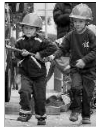
V AKCI. Malí řevniční hasiči na jedné z akcí.