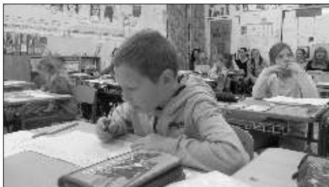
PŘIŠLI SE PODÍVAT. Jak se učí jejich děti, se přišli 19. ledna do zadnotřebeňské školy podívat rodiče.

Podbrdsko - Do šestnáctého roku své existence vstoupil letos dobrovolný svazek obcí Horymír. Nyní sdružuje deset obcí na Podbrdsku od Svinář po Velký Chlumec. Obyvatelům nejen svých obcí přináší informace o dění v tomto regionu na webu www.horymir.net. Nově je možné na web posílat informace o akcích, které se v mikroregionu a jeho sousedství konají. Stačí na stránkách vyplnit formulář, v němž pořadatelé uvedou, kdy a kde se akce koná i kdo ji pořádá. Kliknutím pak lze formulář odeslat. Po schválení bude akce zdarma uveřejněna na webu. Formulář mohou použít i další zájemci pro uveřejnění článků o dění v regionu. Horymír sdružuje obce Lážovice, Vižina, Skřípel, Velký Chlumec, Nesvačily, Podbrdy, Skuhrov, Svináře, Vinařice a Všeradice. (pan)