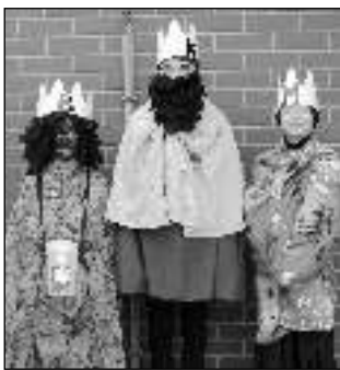
NA KOLEDĚ. Tříkráloví koledníci.

Vánoční svátky není jen pár dnů kolem Štědrého večera, patří k nim i symbolický závěr v podobě obchůzky Tří králů, která připadá na 6. 1. Z Ladových obrázků si každý představí trojici malých chlapců v bílých ministrantských šatečkách. Dříve s nimi chodil i jejich »nadržený« - kněz. Společně měli požehnat a provést ochranu obydlí i chlévů před špatnostmi, které by je v nastalém roce mohly potkat. Doba se změnila a všeobecný dostatek obrátil naruby i tuto zvyklost. Už nechodí kněz, aby lidem pomohl, ale jsou to naopak koledníci, kteří žádají o pomoc pro jiné. Jejich úkolem je připomenout lidem, že mohou po chvíli vlastní