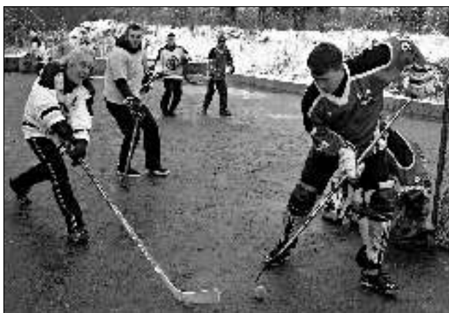
KLOUZÁČKA. V sobotu 23. ledna nejdřív hřiště pokrývala sběhová pokrývka, po jejím odklizení to pořádně klouzalo.

V sobotu 16. 1. bylo na programu 2. kolo základní části. „Stejně jako v kole prvním byla klání velmi vyrovnaná - za jeden hrací den se zrodily čtyři nerozhodné výsledky. To v minulosti nebylo zcela běžné, například