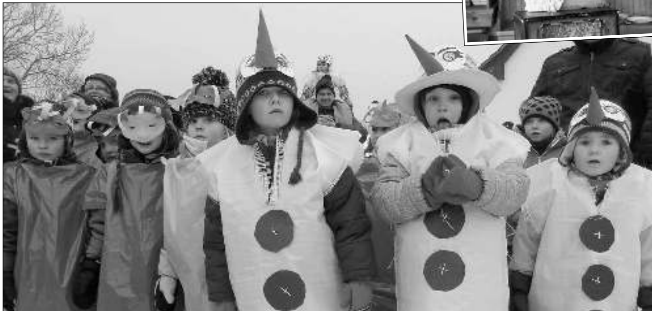
DOBA MASOPUSTNÍ. Několik oslav masopustů už se konalo v našem kraji. V Letech 23. 1. účinkovaly místní děti. (Viz strana 2)