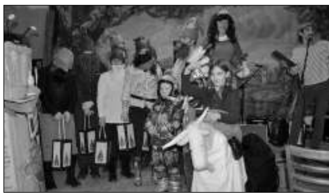
V HOSPODĚ. Nejlepší masky - dětské i dospělé - byly na závěr průvodu vyhlášeny v hospodě U Zrzavého paviána.