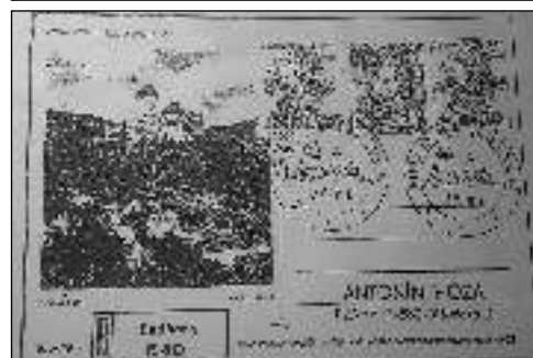
NAJDOU SE? Hledané R-nálepky z poštovny na hradě Karlštejn.