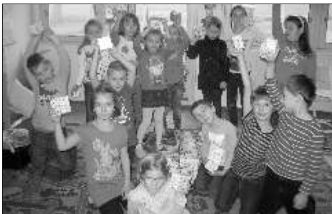
ŠKOLNÍ NADÍLKA. Vánočních dárků se osovské děti dočkaly i ve své škole.

předvedly se jako jako herci, zpěváci i konferenciéři. Po skončení představení se začaly tvořit řady před 2. třídou, kde byl nachystán jarmark. Prodávaly se rozmanité výrobky, které pocházely z vánočních dílen. Během chvíle na prodejních pultech nezbylo téměř nic.