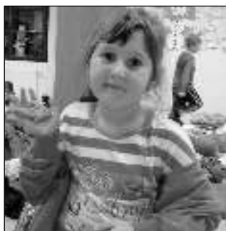
Jedno z karlštejnských dětí v Králově Dvoře.

VE SNĚHU. Děti z karlštejnské školy si konečně užívají zimní radovánky. Nepotřebujeme ani velké kopce, stačí nám zasněžená školní zahrada a jaká je tu legrace! Pěkně se vyvalíme, zkontrolujeme, postavíme sněhuláka a - hurá na oběd a do postýlky.