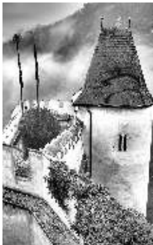
Mlha přede mnou, mlha za mnou a Karlštejn pode mnou...

Se zajímavými záběry Karlštejna i jeho okolí vás počínáje posledním číslem roku 2015 prostřednictvím svých fotografií seznamuje obyvatelka městyse Markéta FÍLOVÁ. (NN)