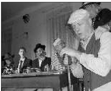
NA SCÉNĚ. Část protagonistů divadelního kusu Kdyby tady bylo pivo.

Tak začíná nová hra Kdyby tady bylo pivo, kterou 16. 1. uvedlo osovské Divadlo ze stodoly před zaplněným sálem v bývalém hostinci U Kafků ve Skříplu. Hru napsal Josef Kozák, který má také největší podíl na jejím uskutečnění. Se svými kolegy herci ji začal oživovat loňského jara, naplno se do zkoušení pustili v září a za necelé čtyři měsíce mohla být premiéra. Jedná se o svěží zábavné dílo, kde se u společného stolu setkávají roztočivé postavy (indián, žid, pastor, námořník, sedlák, šaman...), které houževnatě lpějí na svém: tu na judaismu, tu na křesťanství či toltéckých čtyřech dohodách. Hlavní dějová linka je jednoduchá: mladý kovboj miluje dceru sedláka Jíry, ale