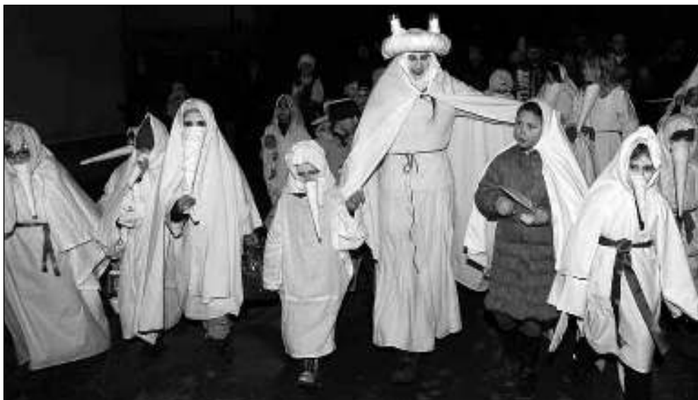
LITNÍ ŠLY LUCKY. V polovině prosince loňského roku prošel Litní průvod Lucek. (Viz strana 8)