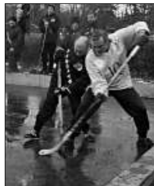
U MANTINELU. Ostré souboje byly k vidění hned v prvních zápasech turnaje.

Citrus Team - Boston 2:2 IQ Ouvey - Samotáři 1:4