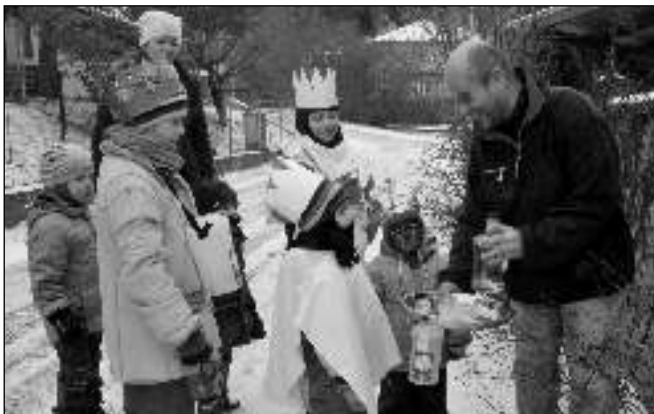
KRÁLOVÉ. Tři králové na obchůzce v Zadní Třebani a ve Svinařích.

ZADNOTŘEBAŇSTÍ VĚNOVALI VÝTĚŽEK KOLEDY NA CHARITU, SVINAŘSTÍ MATEŘSKÉ ŠKOLE