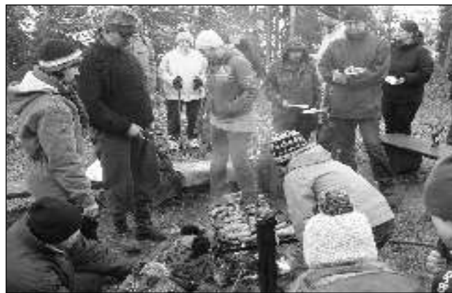
U OHNĚ. Turisté pod brdskou rozhlednou.

ještě o dvě hodiny déle. Znovu můžete navštívit rozhlednu až v dubnu, kdy zahájí novou sezonu. (pan)