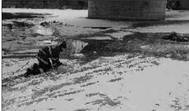
NA LEDU I POD NÍM. Hasiči 14. ledna nacvičovali u letovského mostu záchranu tonoucího, pod kterými se propadl led.

chodte na led tenčí než 10 cm, nepohybujte se ve skupinách a vyvarujte se vodních ploch s přírodním přítokem i odtokem vody. Jakmile uslyšíte praskání, hned se vraťte na břeh.