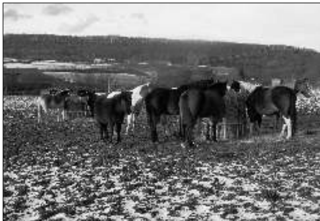
ZIMNÍ IDYLA U LEČE. Lednové procházky v okolí Litně nabízejí nejen romantický obrázek. Zimní «zátíží» s koňmi na lehce sněhem pokrytých pastvinách bylo k vidění v neděli 15. ledna u Leče.