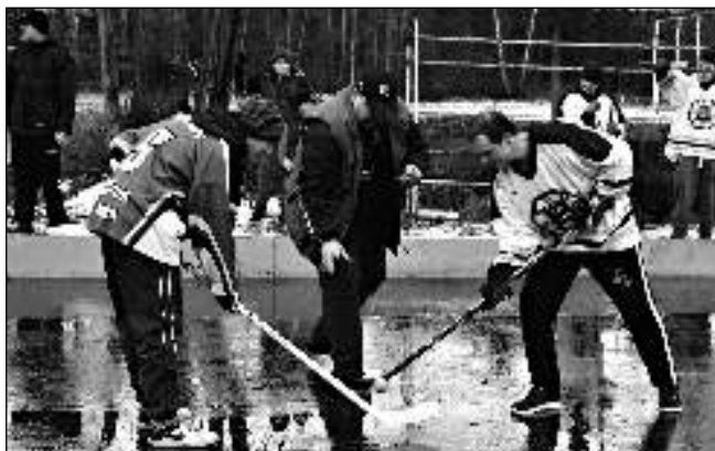
PRVNÍ VHAZOVÁNÍ. V sobotu 14. ledna začal v Řevnicích dvacátý ročník turnaje v pozemním hokeji.