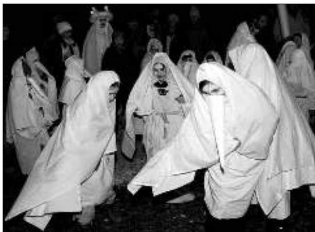
ZÁVĚREČNÉ VYSTOUPENÍ. Liteňskou slavnost svaté Lucie uzavřelo vystoupení všech Lucek a Luciašů.

Událost svou atmosférou ještě umocnila společná návštěva zámeckého parku, kde nám na cesty svítily svíčky, a první z průvodu vylekal hlas hejkala i bengálský oheň. Zahnal jsme strachy při poslechu hry na flétnu. Dvě naše Lucky všem zahrály, společně jsme si zazpívali a už si na strašidla a demony nikdo ani nevezpomněl. Podle lidové víry je sv.