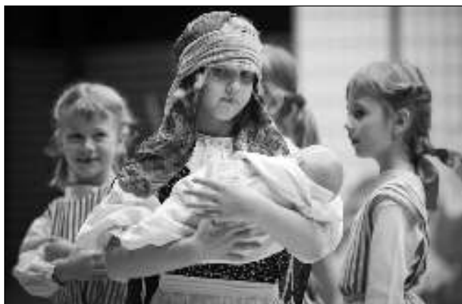
S MIMINKEM. Děti z Klíčku v černošické hale.

* Dětské odpoledne s karnevalem, hrami a soutěžími hostí 29. 1. od 15.00 Club Kino Černošice. (vš) * Výstava fotografií ze soutěže Photocontest se do 30. 1. koná v Místní knihovně Radotín. (dar) * Betlémy z krkonošských muzeí jsou do 8. 2. k vidění v Muzeu Českého kraje Beroun. (pez)