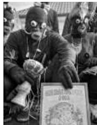
Loni byli neoriginálnější maskou poberounského masopustu v Zadní Třebani vyhlášení kanibalové. Kdo vyhraje letos?

Výrobu ozdob a šperků přijedou předvádět skláři z Jizerských hor, těšit se můžete na gruzínské speciality, pirohy, alsaské víno, koření, horkou čokoládu, medové perníčky i na pravou venkovskou zabijačku. Pro děti budou připraveny projížďky na koních, pro všechny pak bohatý kulturní program - na improvizovaném jevišti v podobě valniuku se postupně představí kapela Třehusk a Notičky, kejklřir PET, pěvecký Třebasbor, veselou scénku předvedou děti z řevnického »dramatáku«, masopustní frašku zase poberounští ochotníci, kteří se také postarají o tradiční pochovávaní Masopusta. Hned poté budou vyhlášeny nejlep-