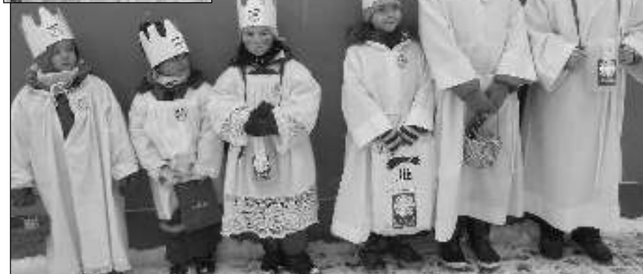
DEVĚT KRÁLŮ. Děti, které 7. a 8. 1. obcházely Osovem i Osovcem a vybíraly na charitu.