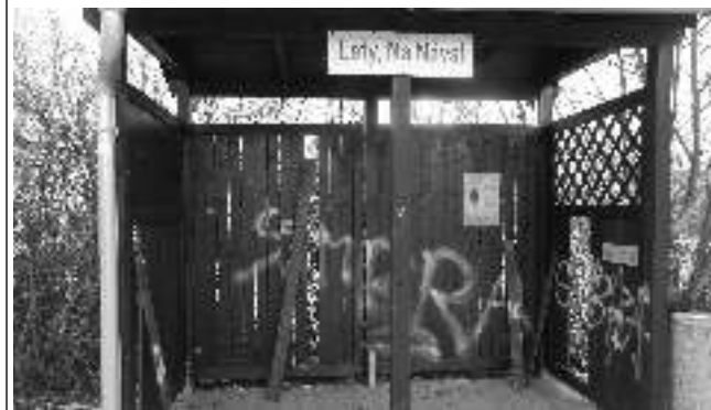
Silvestrovské oslavy v Letech byly pravděpodobně příčinou značného poškození dvou autobusových stanic v ulici Dobřichovická, asi 100 metrů od návsi v Letech. Zastávky postavené v roce 2010 z rozpočtu a dotace regionu Dolní Berounka, každá v hodnotě 70 000, byly vandaly vážně poničeny. Krycí prkénka vyražena, svodnice okapové roury včetně kolénka ukradeny, na střechu naházeny větve. Událost byla nahlášena městské policii v Řevnicích, vyšetřuje se, ale pachatelé zatím zjištěni nebyli. Škoda se odhaduje na 40 000 Kč. Jiří PERINA, Lety