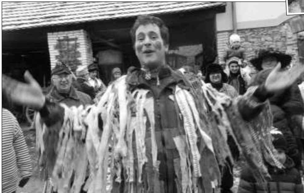
ZAČAL MASOPUST. První letošní oslava masopustu se konala 14. 1. v Hlásné Třebani. (Viz str. 2)

Současná forma viru je dle Státní veterinární správy vysoce patogenní pro ptáky, přenos na člověka ale dosud zaznamenán nebyl. Přesto vydala veterinární správa mimořádná opatření k zamezení šíření nebezpečné nákazy - aviární chřipky na území ČR. Všem, kteří jako podnikatelé chovají drůbež či jiné ptactvo, se zakazuje chovat je ve volném výběhu. Nařizuje se zajistit ochranu chovů před zavlečením aviární chřipky a vést řádnou evidenci o chovu, úhynech, přesunech a veterinárních ošetřeních zvířat. Zakazují se trhy, výstavy, přehlídky, zkoušky s drůbeží a ostatním ptactvem, chovatelské soutěže i soutěže poštovních holubů. (Dokončení na straně 5)