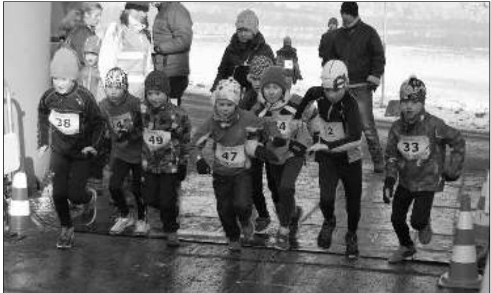
BĚHALI LITNÍ. Pátý ročník zimního běhu se konal předposlední lednovou sobotou. (Viz strana 8)