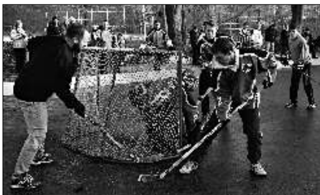
BLÍŽÍ SE FINÁLE. Bandy cup spěje k finálovému play-off. Zbývá sehrát poslední kolo základní části turnaje.