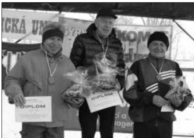
NA STUPNÍCH VÍTĚZŮ. Vítězové jedné ze seniorských kategorií liteňského zimního běhu.

Hlavní závod odstartoval ve 12 hodin. Zúčastnilo se ho 80 závodníků - 14 žen, 50 mužů, 5 dorostenců a 11 účastníků běhu pro zdraví. Letošní hlavní závod měl novou trať. Start i cíl zůstal stejný, změna nastala po proběhnutí zámeckým parkem. Běžci se vydali kolem restaurace Ve Stínu lípy po silnici na Měňany a dále po turistické cestě kolem rybníku Obora. Po zdolání kopce se pokračovalo do Dolních Vlenců a po silnici