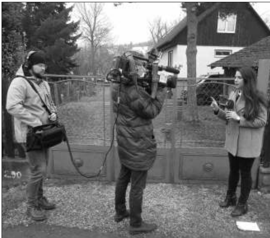
DOVNITŘ NE. Likvidaci nakaženého chovu přijel 6. února do Hlásné Třebaně natáčet štáb České televize. Za vrata usedlosti na břehu Berounky se však - stejně jako další přítomní novináři - nedostal, nepustili ho tam policisté.