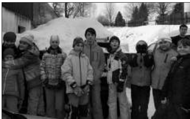
V KOVÁŘSKÉ. Výprava hlásnotřebaňských mladých hasičů v Krušných horách.

Děti napsaly do cestovního deníku: Pololetní prázdniny připadly na pátek 3. 2., uvolnění z jednoho dne škol-