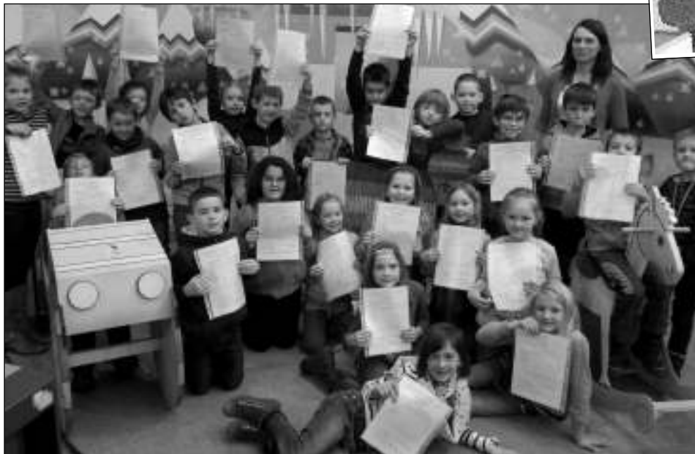
VE STUDIU. Část liteňských školáků si pololetní vysvědčení převzala ve studiu České televize na pražských Kavčích Horách. (Viz strana 7)

O druhou, větší černošickou vilu kontroverzního podnikatele, který z Česka utekl do Jihoafrické republiky a odpykává si tu několik trestů, se přihlásila Krejčířova manželka Kateřina. (mif)