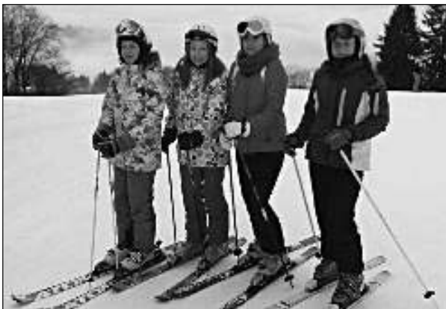
NA LYŽÍCH. Účastníci lyžařského kurzu liteňské školy v Jizerských horách.