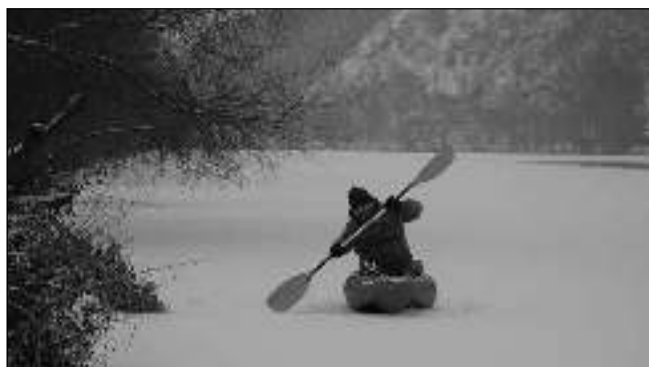
V KAJAKU PO BEROUNCE. Na zamrzlé Berounce bylo v uplynulých dnech možné vidět hokejisty, krasobruslařky i běžce na lyžích. Ale nejen je - první únorový víkend jste mohli u plovárny mezi Hlásnou Třebaní a Karlštejnem spatřit náruživého kajakáře.

Strážníci na místě našli půlroční, silně promrzlé štěně. Ačkoliv měl pes čip, nebylo možné přes národní registr dohledat majitele. Vzhledem k tomu, že během dvou dnů psa nikdo nepostrádal, byl převezen do psího útulku. Následně se podařilo zjistit chovatele, který psa začátkem ledna prodal ženě z Mníšku pod Brdy. Žena ztrátu štěně nikde nehlásila a strážníkům tvrdila, že psa ztratila při procházce. Neprojevovale ani zájem o jeho vyzvednutí z útulku. Protože vzniklo podezření ze spáchání přestupku podle zákona na ochranu zvířat proti týrání, bude se událostí zabývat příslušný správní orgán. Otmár KLIMSZA, MP Černošice