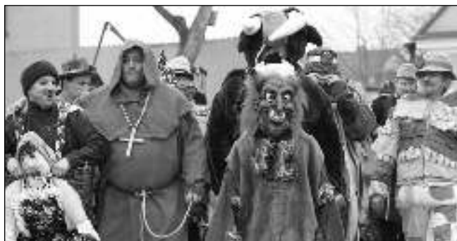
V PRŮVODU. Maškary na letovském masopustu.

14. 2. 17.30 RICHARD MÜLLER: NESPOZNANÝ 14. 2. 20.00 PYROMAN 15. 2. 10.30 OSTRAVAK OSTRAVSKI 15. 2. 17.30 KRÁLOVNA KRYSŤYNA 15. 2. a 17. 2. 20.00 PADESÁT ODSTĚNŮ TEMNOTY 16. 2. a 18. 2. 17.30 (So 20.00) JACKIE 16. 2. 20.00 POSLEDNÍ KRÁL 17. 2. a 18. 2. 17.30 (So 15.30) LEGO: BATMAN FILM 3D 18. 2. 17.30 FLORENCIE A GALERIE UFFIZI - dokument 21. 2. 17.30 MÍSTO U MOŘE 21. a 24. 3. 20.00 T2 TRAINSPOTTING 22. 2. 17.30 ANDĚL PÁNĚ 2 22. 2. i 28. 2. 20.00 JÁ, DANIEL BLAKE