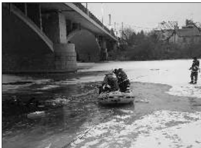
POD MOSTEM. Liteňští hasiči v lednu absolvovali výcvik na zamrzlé Berounce pod letovským mostem.

V sobotu 21. ledna se konala výroční valná hromada SDH Liteň. Zhodnotili jsme kulturní, sportovní a záahovou činnost za uplynulý rok. Jednání navštívilo mnoho našich členů i hostů. Těší nás dobrá spolupráce s okolními SDH i s profesionálními hasiči a jinými organizacemi. Po schůzi následoval hasičský