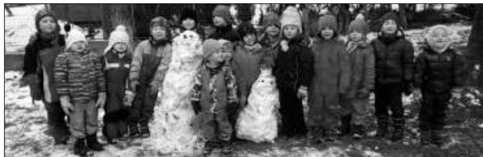
U SNĚHULÁKŮ. Zadnotřebská předškoláci na zahradě »své« školky.